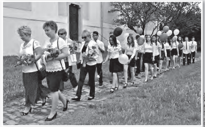
Léggömbbel a kézben ballagtak a széchenyisek

„Néhány perc, néhány év, néhány könnyű álomkép...” – hangzott a városi sportcsarnokban, amikor bevonult a Wosinsky iskola két osztályának összesen 28 végzős diákja június 18-án. Három verset