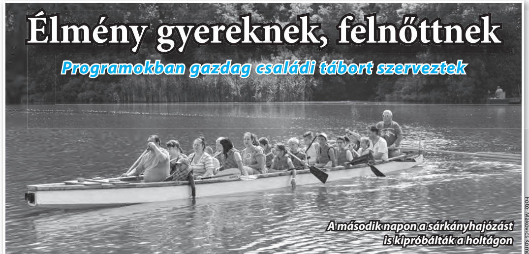
A második napon a sárkányhajózást is kipróbálták a holtágon

Programokban gazdag családi tábort szerveztek