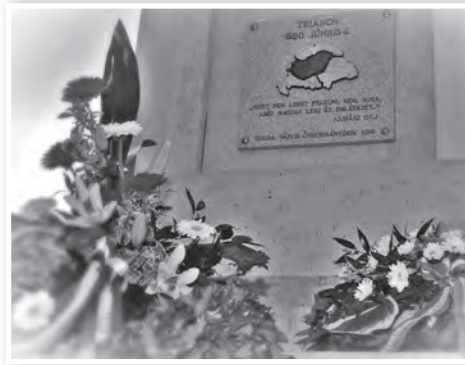
Az emléktáblán Juhász Gyula Trianon című versének két sora olvasható