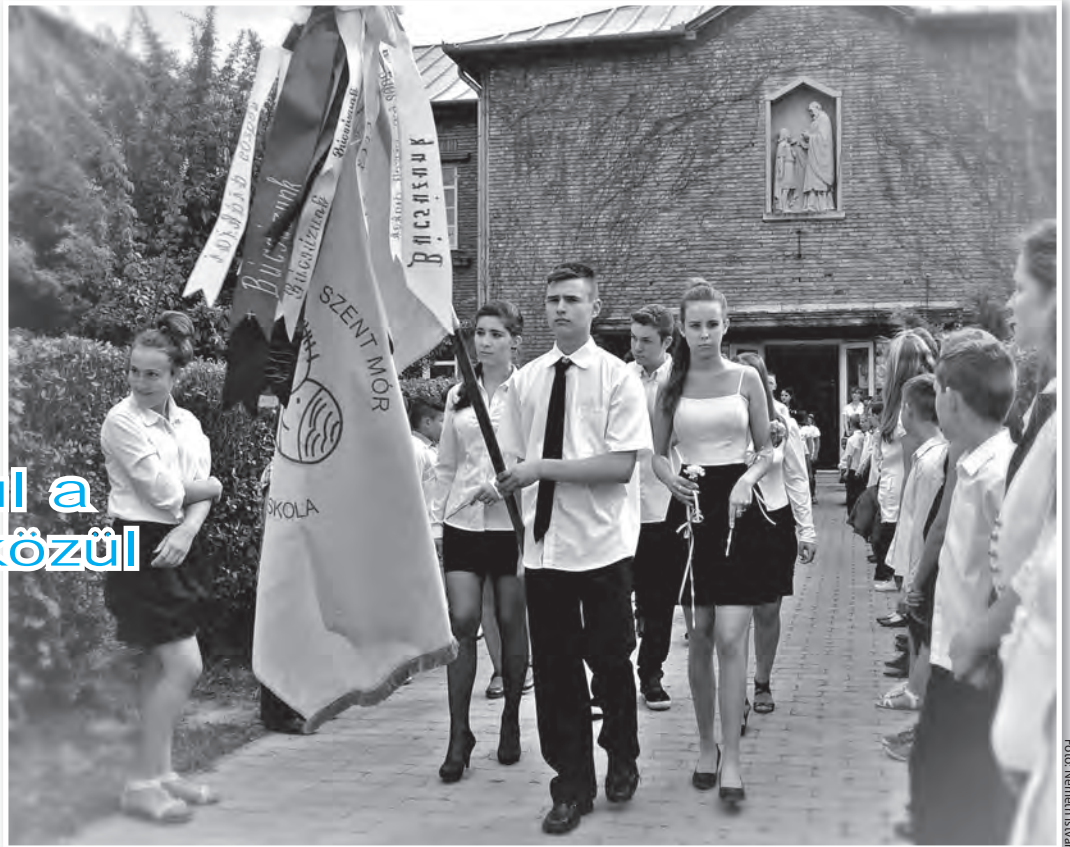
A Szent Mór katolikus iskolából kilenc végzős diák ballagott el