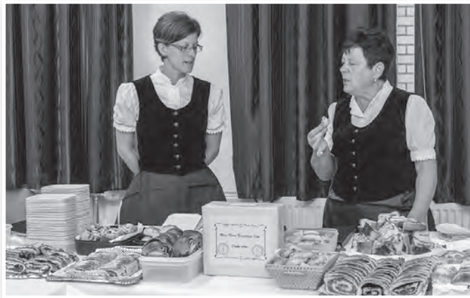
A mözsi és a tolnai német klub, a Karitás, a Wosinsky iskola és a mözsi óvoda által készített, sokféle kelttészta lehetett kóstolni a művelődési házban

mellesleg a Mözsi Német Nemzetiségi Klub vezetője is.