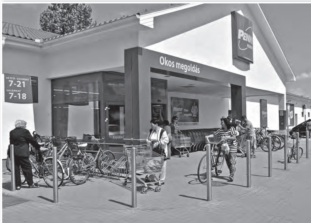
Újra nyitva tartanak a nagy üzletek is vasárnaponként

– A törvényben meghatározott mértékű bérpótlékot biztosítjuk a dolgozóinknak.