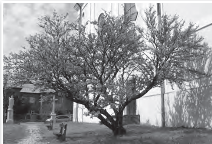
Egy fa, ami a törzsén is hoz virágot

róla? Legelőször is az, hogy sokáig nem volt egyedül. Párja – akivel sosem látták egymást – a templom túlsó oldalán, a sekrestye és a káplánlakás közt állt, amit az itt díszlő spirea (gyöngyvessző) bokrokkal együtt a '90-es évek közepe táján vágta ki, vélhetően az egyszerűbb fűnyírás érdekében. Kora valószínűleg meghaladja a száz évet. Hogy mit ért meg ez alatt? Legalább négy utcanévvaltozást, kezdve ültetésékor még a Schulgassében, ami nem sokkal ezután Szent Imre utcára változott. De ebben se öregedhetett meg, az új idők új szeleivel Úttörő utcára módosulva, ami egy újabb rendszerváltással ismét Szent Imre palástját vette magára. Hasonló korú, szép példányok vannak e fajból innen nem messze, a Kossuth