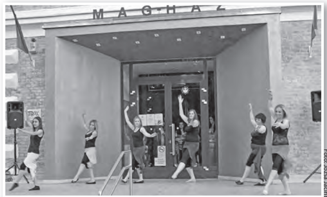
Látványos bemutatót tartottak a hastánc csoportok

A fény és a tűz ünnepe a Szent Iván éj apropóján