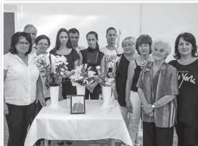
Családja körében utoljára a pályán

Temetésére július 11-én Pécsért került sor, ami után neki még járt egy „tisztelőtör” a tolnai pályán is, ahol itteni barátai is elbúcsúzhattak tőle. Ká