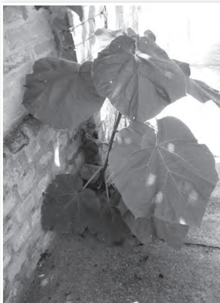
Egy falból kinőtt példány

ban díszlik szépen. Kínában régen az ottani családok, ha leánygyermekük született, egy ilyen fát ültettek el a kertjükben, amit akkor vágtak ki, amikor leányuk férjhez ment, ebből készítvén el számára a hozomány részét képező bútorokat és faeszközöket. Ebből pedig két dolog is következik. Az egyik, hogy rendkívül gyorsan nő, a másik pedig, hogy az asztalos ipar számára is értékes fafaj. Nemrég egy Sárszentlőrincen telepített, több hektáros császárfá ültetvényről is hallottam, ahol az ott felnövő, sudár, egyenes és csomómentes fiatal törzseket hajó (jacht)