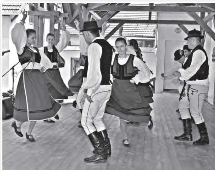
A Csátaljai Bukovinai Székely „Istrimfli” nevű ifjúsági Táncscsoport bukovinai székely táncokat mutatott be

mányok ápolásának és népművészeti kincseink megőrzésének a jelentőségére. Céljuk feléleszteni, élénkebbé tenni a közösségi kultúrát Mözsön, hogy mindenki megtalálhassa az őt érdeklő népművészeti alkotótevékenységet, vagy egyszerűen csak élvezhesse annak eredményét. A nap lényeges üzenete: keressük és látogassuk egymás rendezvényeit, legyünk nyitottak és befogadók!