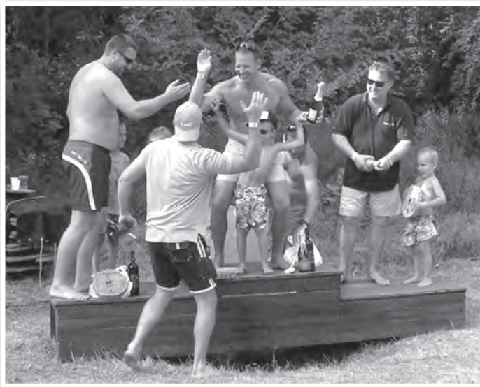
Öröm a dobogón a halfőző verseny eredményhirdetésén