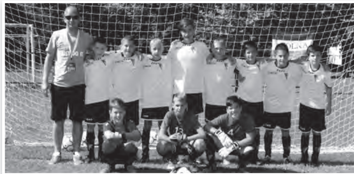
Az U13-as csapat a kaposvári tornán

Akadémiától viszont 4-0-ra kikapott, így a csoportban a 2. helyen végzett. A 4 közé jutásért a Debreceni Olasz Focisuli ellen 1-1-es döntetlen után büntetővel 3-2-re diadalmasokdtak. Az elődöntőben a Mátészalkát verték 1-0-ra. A döntőben a Nyíregyházi Akadémia csapatával 0-0-t játszottak, büntetővel ezúttal a nyírségi csapat nyert.