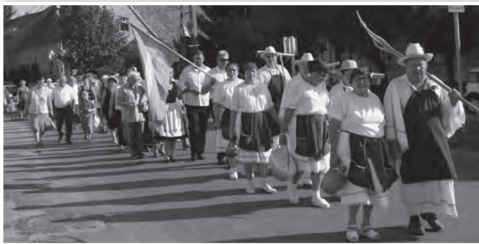
A Nyugdíjas Szabadidő Klub tagjai alkották az aratófelvonulás gerincét

tyájává is váltak az iszlám hódítás idején. Ennek kapcsán tért ki az alpolgármester az aktuálpolitikára. Népszavazás előtt áll az ország. Ismét nagy emberáradat érkezik délkelet felől. Berta Zoltán szerint a tét a függetlenségünk, a kereszténység megőrzése. Az alpolgármester megítélése szerint nekünk a Szent István-i úton kell járnunk.