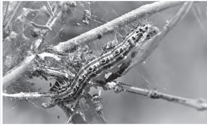
A puszpángmoly hernyója

lyén tápnövénye még a pirosvirágú magyal és a japán kecskerágó is. Ez utóbbi nálunk is gyakori dísznövény, így, mint potenciálisan fenyegetettre, rá is érdemes odafigyelni. Hernyói a bokrok ágai közé szőtt szövedékben telelnek át, amelyek korai tavaszodás