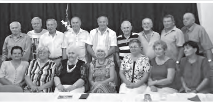
Tizenöt öregdiák és a Tanár néni (balról a harmadik) vett részt a találkozón

Búcsúzóul elhangzott: öt év múlva újra itt.