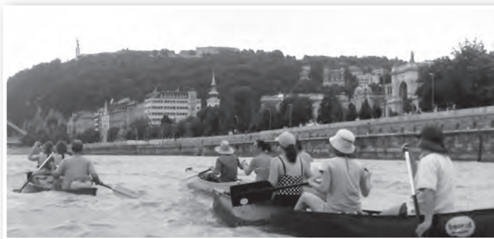
Budapestnél a hullámok miatt nemigen volt lehetőség a látványban gyönyörködni

majd a Visegráddal szemközti parttól gyönyörködtünk egy ideig a látványban. Délután érkezünk meg első táborhelyünkre, a Szentendrei-sziget északi csücskén, Kisoroszi mel-