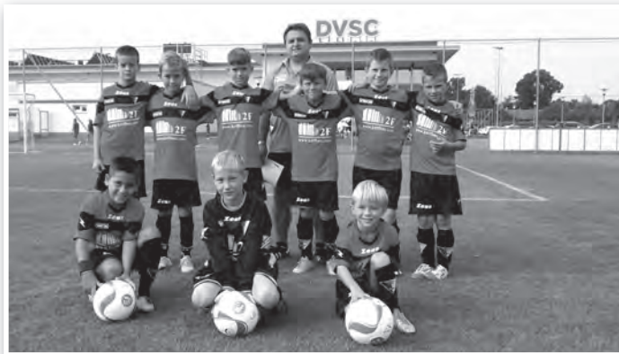
Az U10-es csapat a debreceni tornán

Az U12-es gárda a csoportmérceken 1-0-ra verte a Debreceni SI-t, 2-0-ra a Füzesgyarmatot, a Debreceni