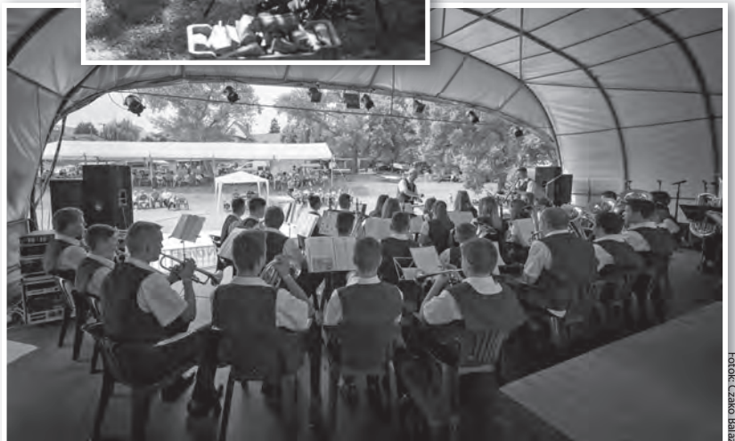
Az uzoni ifjúsági fúvószenekar koncertje

Az R-Go koncert után a Bárka Fesztivált hosszú és látványos tűzijáték, majd a Colorado Band műsora zárta. (További képek a Bárka Fesztiválról a szomszédos oldalon.)