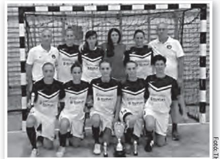
A Tolna-Mözs kupagyőztes csapata

A tolnaiak a DVTK elleni gólzáporos győzelemmel jutottak a döntőbe. A Hajdúböszörmény a bronzmeccsen meggyőző játékkal verte a miskolciakat, jelezve, hogy a bajno-