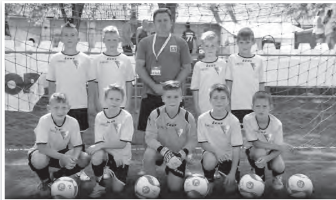
Az U12-es csapat a kaposvári tornán