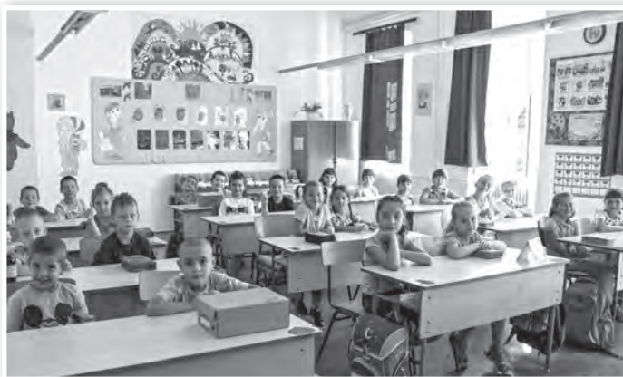
Leendő elsősek ismerkedtek a sulival augusztus 29-én az Eötvös utcai iskolában tartott „kóstolón”

A kormány által hozott döntés alapján az alsó tagozatosoknak már csak 30 percnyi tananyagot kell elsajátítaniuk a 45 perces tan-