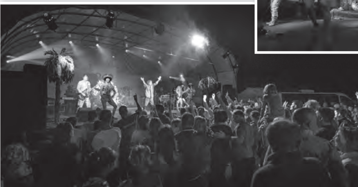
Az R-Go koncert volt a legnépszerűbb program az idei fesztiválon

Akár a Bárka Fesztivál mottójaként is felfogható a „Tiszta erőből nyár” című örökzöld sláger, amely szintén elhangzott az idei fesztivál legnagyobb érdeklődést kiváltó programján, Szikora Róbert és az R-Go koncertjén, augusztus 13-án.