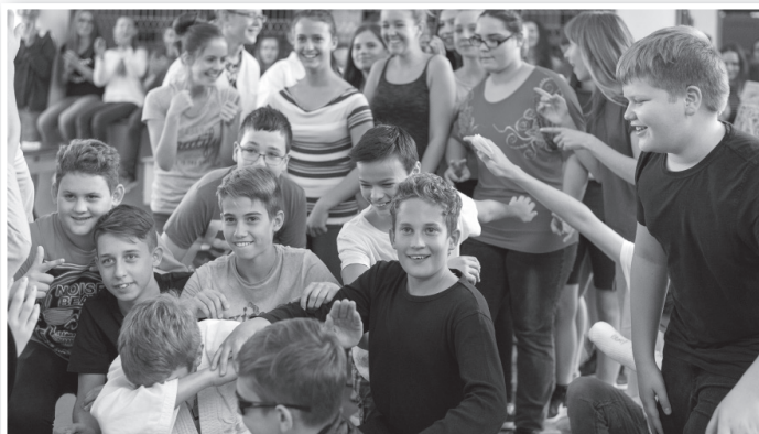
A hetedikesek gólyatáncának maguk a szereplők is örültek

A fenntartóváltás nem változtatott a hagyományokon