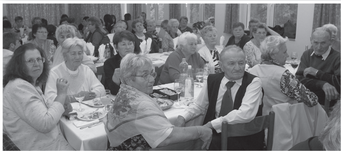
Több, mint hetven egykori patexes dolgozó jött el az idei találkozóra

Az eseményen szó esett a 2010-ben felavatott, jelenleg a régi művelődési ház épületének egykori kávéházának helyén berendezett textiles emlékszobáról is. Az erről, illetve a Pamuttextilművek Tolnai Gyáráról szóló anyagot a tolnai értéktár bizottság legutóbbi ülésén felvette a helyi értéktárba.