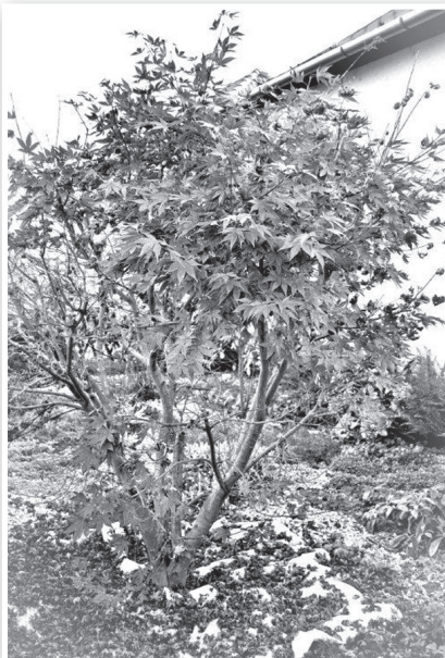
A japán juhar a Sport utcából

legszebb Tolnán, a Bartók Béla utcai óvoda előtt áll, de volt egy hatalmas termetű példány a József Attila és a Dózsa György utca sarkán, amit sajnos kivágtak. Ám maradt is belőlük a környéken, például a Strissow-szky-sarkon és a főút menti Nap-sugár ABC melletti parkban. Ennek