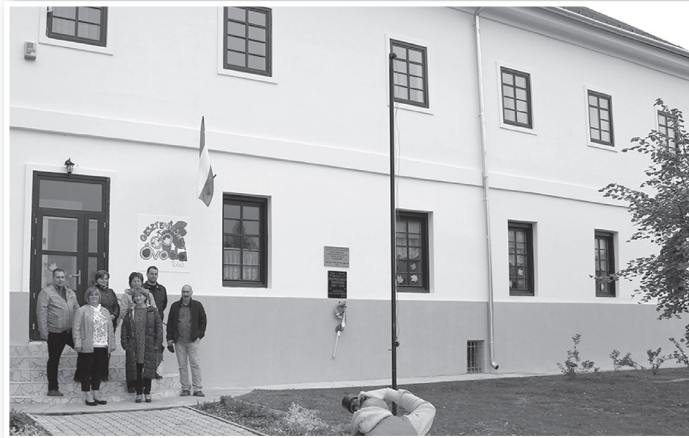
A sajtótájékoztató résztvevői a felújított épület előtt

2015 nyarán elkészült az ingatlan tetőzetének felújítása is. A mintegy 15 millió forintba kerülő fejlesztés költségeihez a JETA 10 millió forintot biztosított. A város az ötmillió önrészen túl saját erő-