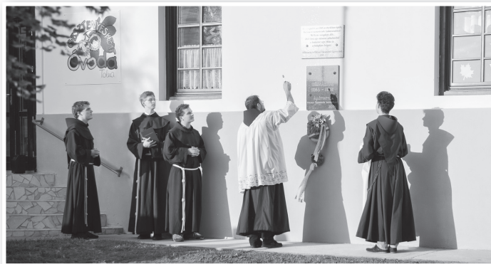
Az egykori kolostor falán levő emléktábla megáldása

többször is a nap folyamán. A válasz nem deklarációkban érkezett, hanem annak a bejelentésével, hogy a helyi plébánia közösségének egy hölgy tagja, családanyaként, épp ezekben a hetekben kérte felvételét a rend világi ágába. ká