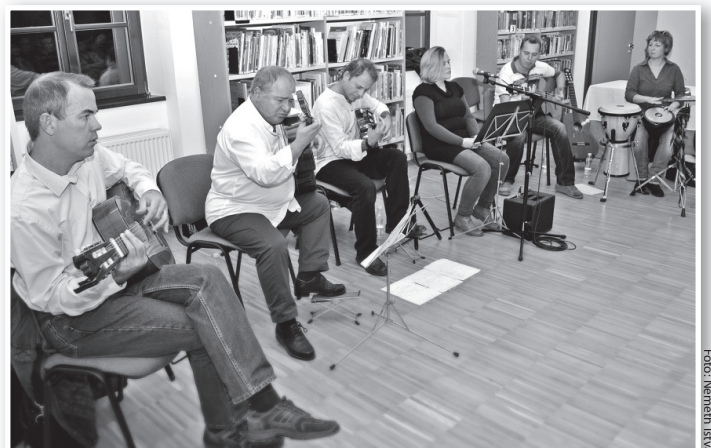
Emlékeztető produkció volt a gitárkvartett ezen műsora is

az elhangzott Babits-versek tolmácsolója elmondta: vagy a versek ihlették a gitárkvartett zeneszámait, vagy a saját szerzeményeikhez kerestek ahhoz illő költeményt – a hat évvel ezelőtt született műsoruk így állt össze. A színvonalas produkcióban tíz Babits-vers hangzott el, többek között a Hazám, az Esti kérdés, a Télutó a Sédpatakánál, vagy az Aliscum éghajú lánya. A mintegy harmincfős közönség nagyon élvezte a produkciót, a végén ráadást is követelt az előadóktól.