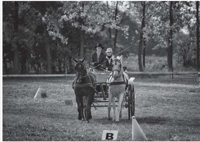
Balesetmentesen és sportszerűen zajlott a verseny