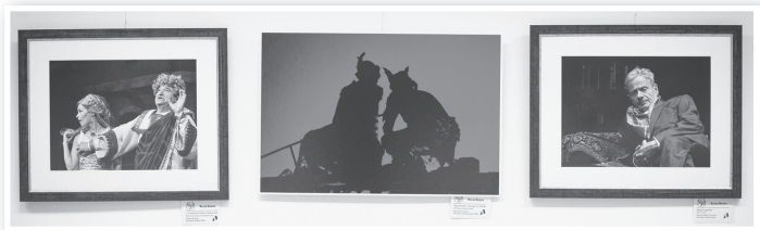
Néhány kiállított fotó a színház világából

A DaDalia Galéria Fotókörének A természet és az ember című fotókiállítása október 14. és 28. között volt látható a Mözsi Művelődési Házban. Az interneten szerveződött közösség hat amatőr alkotója egyedi látásmódjával nem mindennapi szemszögből mutatja meg a természetet, a környezet és az ember viszonyát.