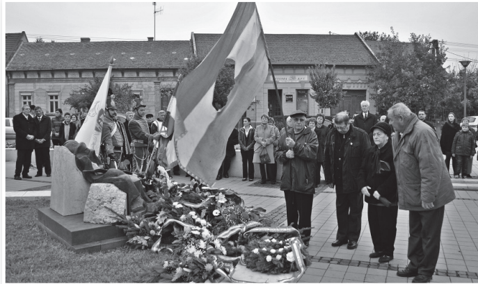
Tolnai és mőzsi nyugdíjasok hozták el a Hősök terére az '56-os zászlót

hozott el. Hogy hatvan évvel az események után mindez már történelem? A gimnazistáknak mindenképpen. A téren azonban volt néhány arc – és itt elsősorban két hölgyre kell gondolnunk – akikről