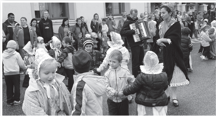
Mözsi óvodások a művelődési ház előtti össztáncon

Az adományok leadási helye a Családsegítő Központ, Tolna, Bajcsy-Zs. u. 96., december 12-ig, hétköznaponként 7.30 és 16 óra között. Az ajándékokat ünnepélyes keretek között december 15-én osztják ki a Tolnai Kulturális Központban. ká