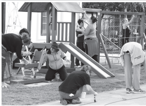
Több, mint ötvenen vettek részt a közös munkában

is, mely óvodai programunk egyik alappillére. Az igazi örömet azonban a hétfő reggel jelentette számunkra, amikor a gyerekek boldogan fedezték fel együtt az új és a régi, kedvenc felújított játékaikat. Köszönet mindenkinek a példa értékű összefogásért!