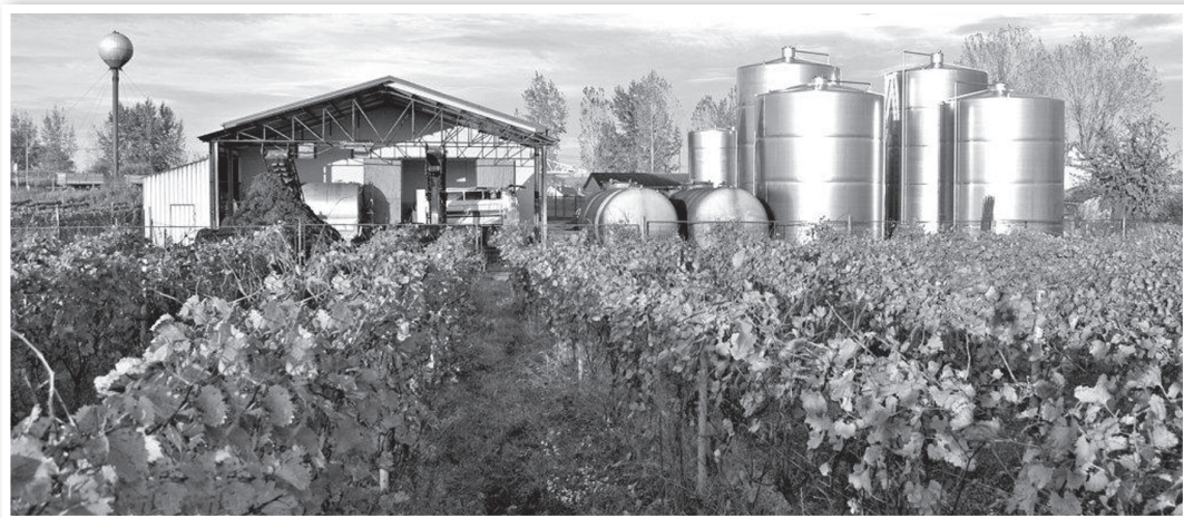
A Tolna Borház. A csökkenő kereslet miatt elég lett a kevesebb szőlő is

Az elmúlt enyhe télen jól teleltek a tolnai szőlők, némi későtavaszi fagy csak a mélyebben fekvő területeken pusztított. Jó volt az indulás is, s bár sokat esett kora tavasszal az eső, de a metszéssel így is mindenütt időben végeztek. Virágzás után mutatott legszebbet a szőlő, ekkor többen mondták is, az idén szép termés várható. Aztán egy júniusi reggelen megérkezett a jég az Öreghegyre, ezután július 13-14-én közel 100 mm eső esett, amit az augusztusi párás napok sorozata tetézett be, egy átlagon felül erős, kései lisztharmat, illetve peronoszpóra fertőzéssel. Hogy ami maradt, az legalább jó áron elkelt? Sajnos nem. A szőlő felvásárlási ára ugyanis nem, vagy alig érte el az előző években már meghaladott kilogrammonkénti 100 Ft-ot, amiért – fogalmazzunk így – még így se álltak sorban a felvásárlók.