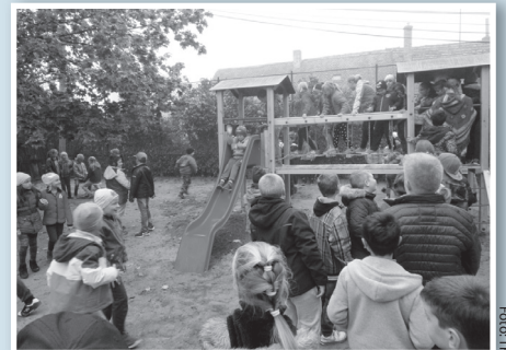
Nem lesz baj az új játékok kihasználtságával

A több, mint száz alsó tagozatos széchenyis diák a szomorú, ködös idő ellenére önfeléd vidámsággal vette birtokba hétfő reggel háromnegyed nyolckor az átrendezett iskolaudvart. Az aznapi első tanítási óra jelentős része is a játékok kipróbálásával telt.