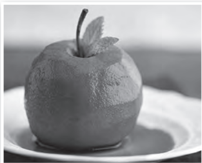
Egy különleges desszert almával és borral

Különleges desszert ünnepi alkalmakra. Hozzávalók: 4 érett, aromás, kemény alma, fél citrom leve, 1 liter burgundi, vagy hasonló vörösbors, ½ dl feketeribizli-likőr, 1 rúd vanília, 8 szem egész bors, 1 kakukkfűág,