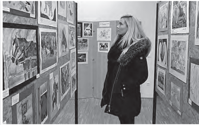
Százötven képet állítottak ki a beérkezett 1700 közül

felvázolását követően – elmondta, hogy három fordulóban válogattak a képek közül. Az elsőkben a legkevésbé sikerült rajzokat vették ki a munkák közül, a másodikban csak a kiállításra került 150 darab kép