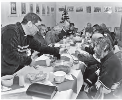
A Karitás ebédje a Civil Házban

A Tolnai Katolikus Karitás 2016-ban is gyűjthetett a város CBA boltjaiban. Erre két alkalommal, november 26-án és december 3-án volt alkalmuk. Az itt befolyt adomány, a templomi gyűjtéssel kiegészülve 800 kg tartós élelmiszert szolgáltatott ahhoz a 200 ajándékcsoomaghoz, amiket december 12-13-án osztottak ki a rászorulóknak között. Ebben az időszakban zajlott egy tűzifa akciójuk is, aminek során három család jutott közel 20 ezer forint értékű tüzelőhöz, amin túl egy családnak még új kályhát is vásárolt a szervezet.