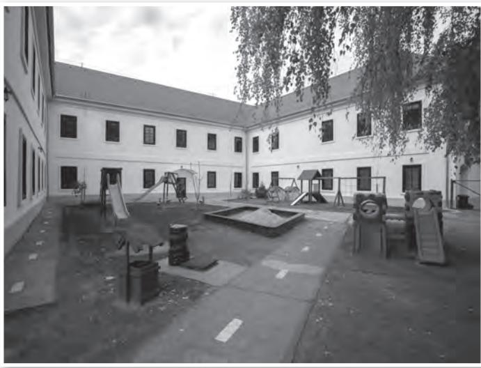
A tolnai zeneiskola épülete is jelentős JETA-támogatással újjulhatott meg

Élelmiszer csomag Fácánkerten hagyomány, hogy az önkormányzat megajándékozza a helyi szépkorú polgárokat karácsony előtt. 2016-ban a 70. évüket betöltött idősek 2 ezer forint értékű élelmiszercsomagot kaptak. Összesen 82-en részesültek ilyen ajándékban.