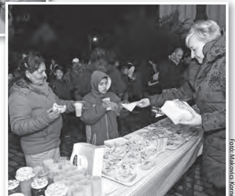
A Szent Mór iskolanyitogatója szeretetvendégséggel és adventi vásárral zárult

A Szent Mór katolikus iskola december 12-i „iskolanyitogató” programján lehetett mesét és gitárzenét hallgatni, műsort adtak a színjátszó csoport mellett az iskola alsó tagozatosai, végül szeretetvendégség és adventi vásár zajlott az intézmény előkertjében. Az iskola színjátszó készítség felleptek óvodákban, az idősek otthonában és a karácsonyi misén is.