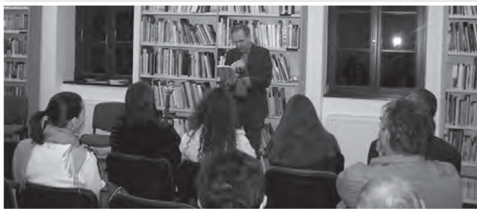
A könyv szerzője is felolvastott a könyvből

Ború és derű együtt jár Wessely Gábor legújabb kötetében