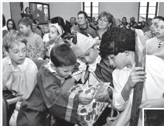
Pillanatkép a Tedd szebbé a karácsonyt! ajándékátadójáról

is azokért a jól tanuló és jó magaviseletű gyermekekért, akiknek a családja erre rászorul. A Tedd szebbé a karácsonyt! összefogás résztvevői a Háló Közalapítvány, a Családsegítő Központ, a Tolnai Kulturális Központ és Könyvtár, a Civil Voks Egyesület, a Mőzs-Tolnai Református Nőszövetség, a Magyar Vöröskereszt Tolnai Csoportja és a Tolnai Plébánia Karitás Csoportja tagjai voltak. A december 15-én, a MAG-Házban rendezett ajándékátadáson ötven tolnai és mőzsi iskolás vehetett át névre szóló, több ezer forint értékű csomagot a közreműködő szervezetek vezetőitől. A műsort a Szent Mór katolikus iskola diákjai adták.