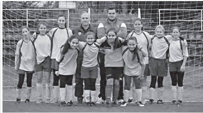
A TMFSE U-15 lány keresztpályás csapata

Az U-15 fiúk között a TMFSE a csoport utolsó helyén végzett. A fiúk itt két győzelmet szereztek és többször szoros küzdelemben maradtak alul.