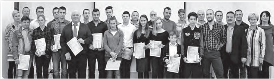
A sporttalálkozó résztvevői, edzők, versenyzők, sportvezetők

Nagyra értékeli a város vezetése a tolnai sportélet szereplőit