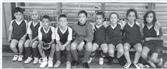
Az U-9-es vegyes csapata