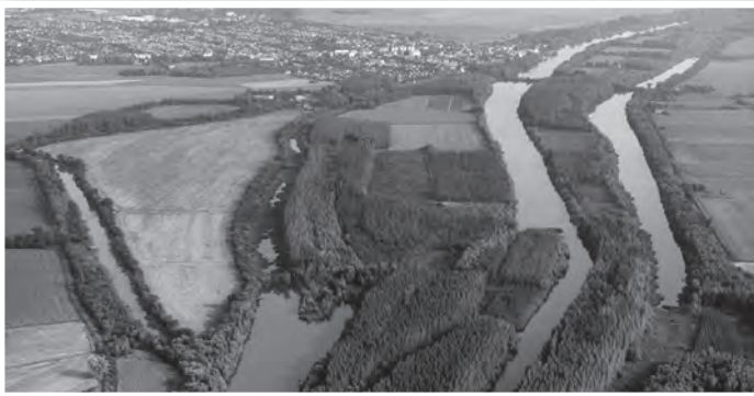
A Tolnai Alsó Holtág északi része madártávlatból

Az új bérlő(k) kiválasztásáig a két holtágra nem lehet területi jegyet váltani, a horgászat ezeken a holtágakon egyelőre tilos. Az új bérleti szerződések megkötéséig is gondoskodni a vízterületek őrzéséről.