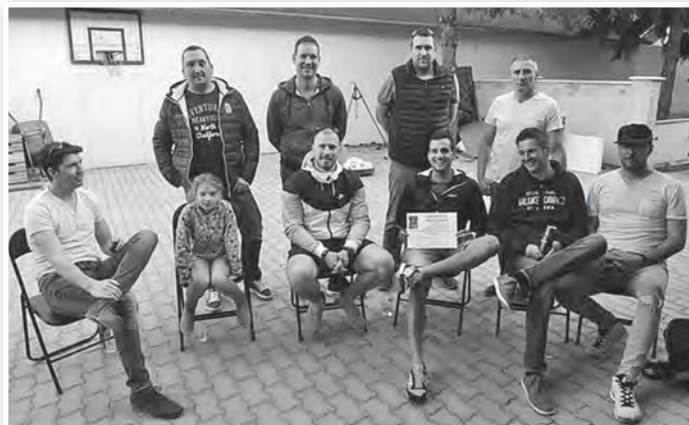
A halászlé itthon, barátok között esik a legjobban