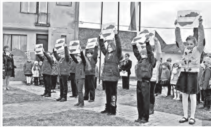
A mözsi iskolások formabontó produkciót adtak elő

Végül a városvezetők, a német nemzetiségi önkormányzat, a helyi óvoda és az iskola, a Mözsért Civil Egyesület, a mözsi német klub, a Mözsi Nyugdíjas Klub, a székely egyesület, a tolnai polgárőrség valamint a tolnai nyugdíjas egyesület képviselői elhelyezték koszorúikat az emlékműnél. Az ünnepség zárásaként a gyerekek tűztek nemzeti-színű zászlókat, díszeket az emlékműhöz vezető út mellé. K.E.