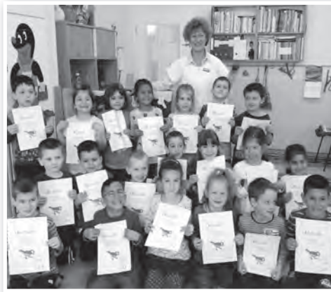
Mindenki győztes volt, aki részt vett a programon

Dalaink, meséink, de még a felkínált különféle játékaink is a mada-