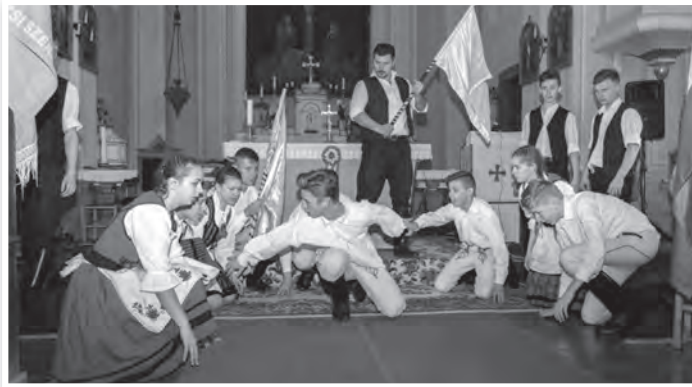
A kislülpösi Verőfény táncsoport adott műsort a mözsi templomban

Az 1854. március 10-én, Marosvásárhelyen, a hajdani Posta-réten kivégzett székely vértanúk emléknapját a Székely Nemzeti Tanács öt éve nyilvánította a székely szabadság napjává. Százhatvanöt évvel ezelőtt, 1852 januárjában tartóztatták le az osztrák uralom ellen irányuló, Makk József tüzérezredes által létrehozott függetlenségi mozgalom székelyföldi szervezetének legfőbb vezetőit: (bágyi) Török János teológianárt, (martonosi) Gálffy Mihály ügyvédet és (nagyváradai) Horváth Károly földbirtokost. Két év vizsgálati fogság után ítélték őket kötél általi halálra. A nemzeti önrendelkezésért harcoltak és áldozták életüket. Az elbu-