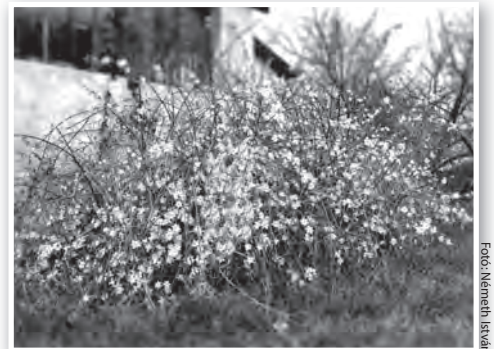
Az igazi jászmin ritka, de azért akad belőle Tolnában is

Mire ezek a sorok megjelennek, a téli jászminok már rég elvirágozva, csendesen mosolyognak a kert többi bokrainak nagy igyekezetén, amivel hűsvetra már túl leszünk az aranyeső, a japánbirs, a törpeman-