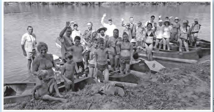
Az élő Tiszán is megfordult a kenukkal a tolnai társaság

Természetesen a szokásos esti közös bográcsozások és a reggeli, tárcsán sült kolbászos, szalonnás rántották és bundáskenyerek sem maradtak ki. Csak a rengeteg szü-