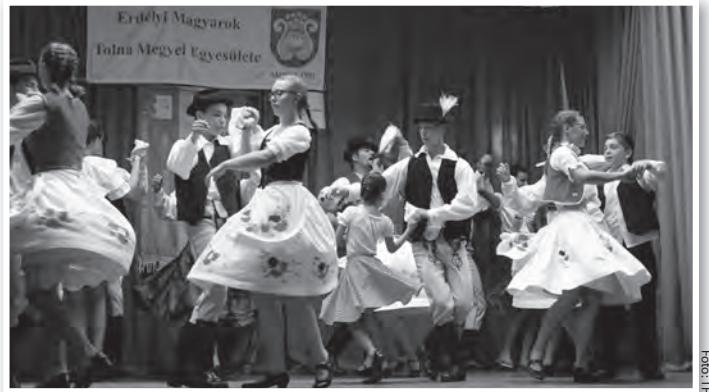
A színpadon a Kislülpöséről érkezett Verőfény táncsoport

Záróeseményként augusztus 4-én először a mözsi táborozók mutattak be erdélyi népi gyermekjátékokat, a nagyszámú közönség előtt. Majd a Táncpremier című műsorban a kislülpösi Verőfény és a görgényüvegcsúri Csalogány néptáncegyüttes előadásában még soha nem látott, eredeti gyűjtésből származó mezőségi, csávási és bölkényi táncrendeket és a hozzájuk tartozó viseleteket ismerhette meg a publikum. A közönség fergeteges vastappsal, felállva ünnepelte a lendületes, szívből jövő, elsőprő erejű táncot. Műsorukat másnap Szekszárdon mutatták be a Mözsön vendégeskedő erdélyi táncosok. K.E.