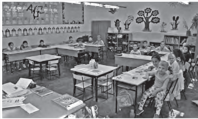
Az Eötvös utcai iskola I. B. osztályában is elkezdődött a tanítás