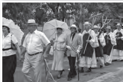
Idén is a Tolnai Nyugdíjas Szabadidő Klub tagjai adták az aratófelvonulás magját