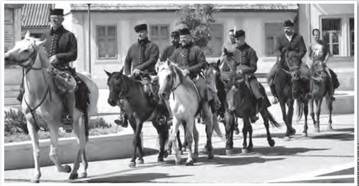
Lovas zarándokok a Hősök terén