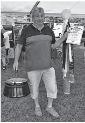
A foglalkoztatási központ csapata nyerte a halfőző versenyt