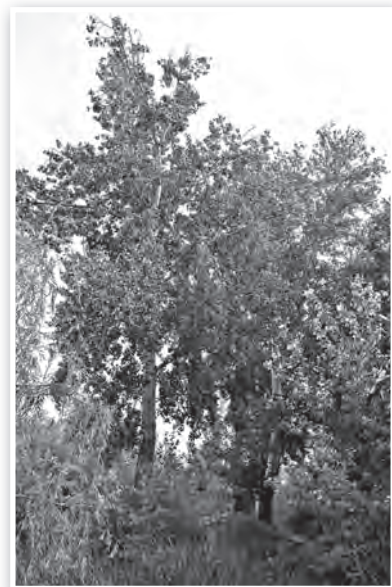
A Perler-gödör taksonyai sokakban ébresztenek régi szép emlékeket

De menjünk egy kicsit közelebb a fákhöz! Számolom őket, ami nem is könnyű, a törzseik köré nőtt buja, ártéri vegetációtól takartan. Végül ötben állapotunk meg, amelyek robusztusak, méltóságteljesek, életől kicsattanók. Szürke nyárok. Ez a faj, tudományos nevén Populus canescens az a fa, amely a fehér fűzzel, a többi nyárral és a behurcolt zöld juharral (népi nevén vízi kőrissel) az Alföld és a Dél-Dunántúl ártéri erdeinek a javát adja. Ez egy állandósult keverékfaj, vagyis hibrid, ami az itt őshonos fehérfenyő és rezzgőnyár frigyéből jött létre, mindkét szülőjének előnyös tulajdonságait egyesítve. Épp ezért vált dominánssá a növénytársulásban, néha akár 60-70 év alatt