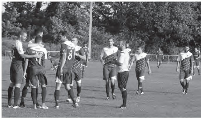
A tolnai csapat ötször örülhetett gólnak a Bonyhád ellen

A Tolna VFC négy forduló után 12 ponttal az 1. helyen állt.