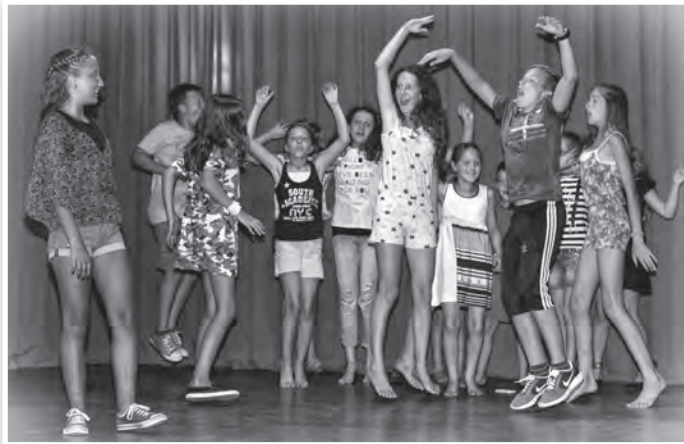
A táborzáró előadás egy látványos mozzanata

A tábor fontos kérdése volt: hogyan képesek megőrizni magyar