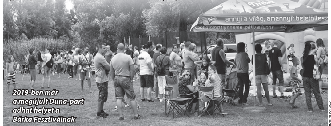
2019-ben már a megújult Duna-part adhat helyet a Bárka Fesztiválnak

A támogatási szerződést szeptember végéig megkötik, legkésőbb október elején indulhat a projekt. Ha nem húzódik el a közbeszerzési eljárás, jövő év október végére elkészülhet a beruházás.