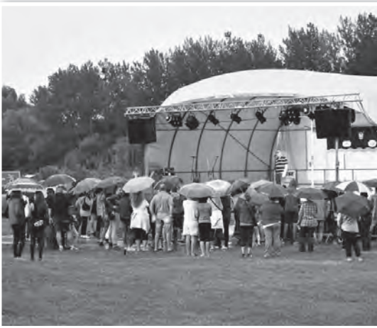
Ének az esőben Charlie-val

Az eső szerencsére nem sokáig tartotta magát, az időben előrehozott tűzijáték, majd zárásként a Collection koncert alatt – külsőleg legalábbis – már senkit nem fenyegetett az elázás veszélye.