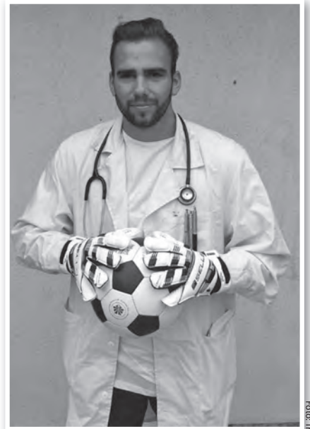
Gergőt az orvosválogatottban is szívesen látnák

Gergő arról is beszélt: nem ért egyet azzal, ha egy orvos a szabadidejében is minden percben a betegek rendelkezésére áll. Úgy véli, a rendelési időben teljes odaadással a betegért kell dolgozni, az ő érdekeit