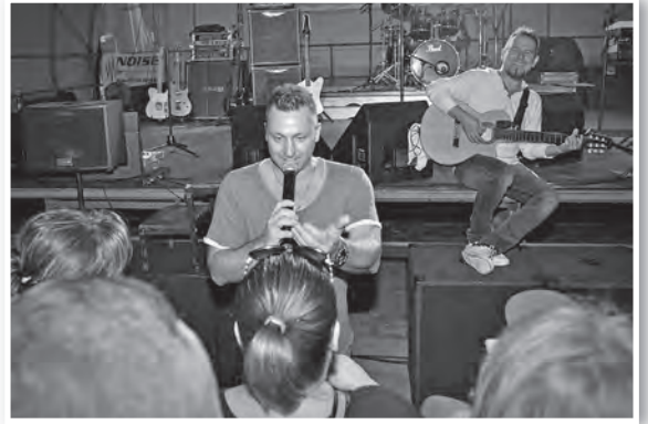
Kefir többeket elvarázsolt