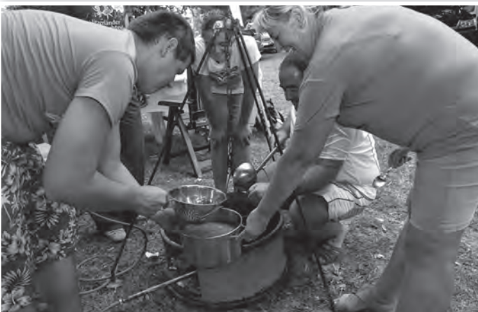
Tizennyolc csapat nevezett az Ollé, hallé!-ra