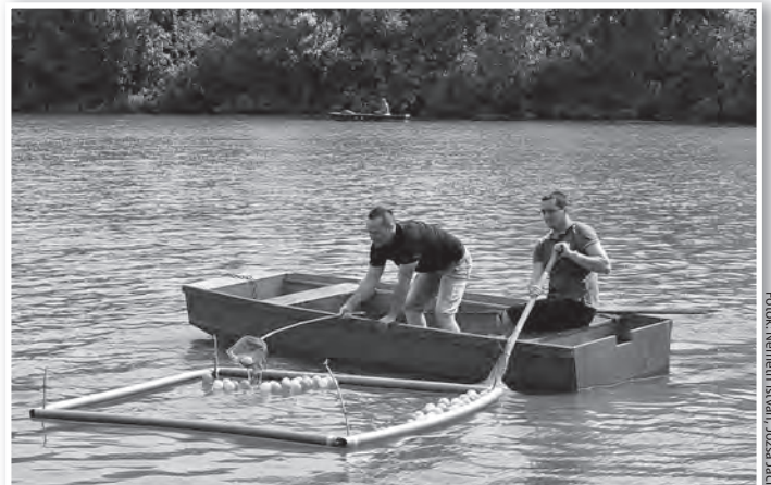
Csónakos labdahalászat a legigazibb tolnaiak versenyén