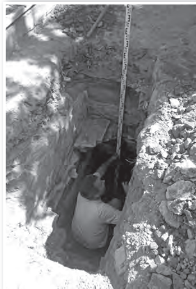
A régészek ún. szondaárkot ástak, hogy kiderítsék, a falrészlet milyen épületé lehetett

ben épült lakóház falrészletéről lehet szó. A régészek mintegy 80 centi mélyen megtalálták a régi épület kőlapokkal burkolt belső padlózatát is, alatta pedig egy pincére bukkantak. Bár a lelet nem a várhoz, vagy a templomhoz tartozik, mégis értékes. Ilyen későközépkori, előkelet, kőből készült lakóház ugyanis megyei szinten is ritkaságnak számít. Az épület a betöltési rétegben lévő kerámiatöredékek alapján a 18. század folyamán elpusztult, és pontosan az alapjaira épült fel az újkorban használt, közelmúltban összedőlő kis ház. Ódor János elmondta, hogy a Malom utca Tolna egyik legrégebbi olyan utcája, amely – a régi térképekkel való összevetés alapján – megőrizte eredeti vonalvezetését. Ez a terület már a középkorban is sűrűn beépített volt, a régész nem lepődne meg, ha a környékbeli régi, kis alapterületű házak alatt is a most feltárt-hoz hasonló, kőfalú épületek alapjai lennének.