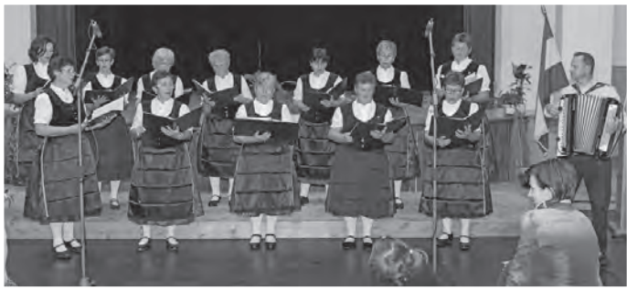
A Mőzsi Német Nemzetiségi Klub ének kara

A programot a Jánossomorjai Fúvós Egyesület fellépése zárta, közben a közönségből egyre többen táncra perdültek. Műsoruk végén a zenekar egy ismert dal közös előadására hívta a résztvevőket, így báli hangulatban ért véget a kulturális műsor. K.E.