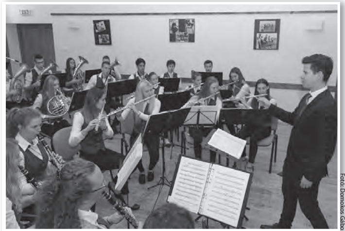
Az együttes igen nehéz darabokat játszott, minden eddiginél magasabb színvonalon

Népszerű fantasy filmzenék fúvós átíratban