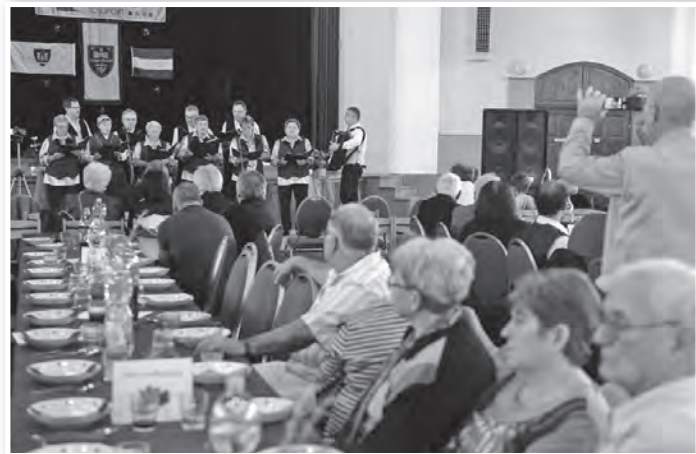
A Fekedi Vegyeskar is a fellépők között volt

A fellépések után vacsora és vidám, zenés mulatság következett, késő estig, kiváló hangulatban. Visszatérve Lutherre Márton mondsára: a kórustalálkozó résztvevőit minden bizonnyal soha nem fenyegette a bolondság veszélye.