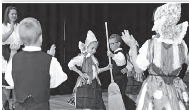
A mözsi Zöldkert Óvoda táncsoportja is fellépett

A Német Nemzetiségi Önkormányzat 23. alkalommal rendezett nemzetiségi napot, amelyen nemcsak a helyi, de más települések sváb művészeti csoportjainak műsorát is élvezhette a közönség a Tolnai Kulturális Központban.