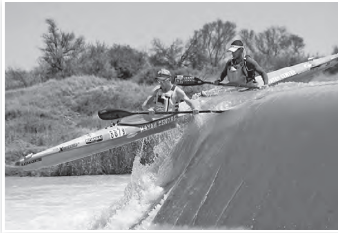
Ilyen veszélyes zúgókkal is meg kellett küzdeniük a Fish River Maratonon

Túlélték a legveszélyesebb zúgót is, és végül az értékes harmadik helyet szerezték meg úgy, hogy először indultak ezen a versenyen.