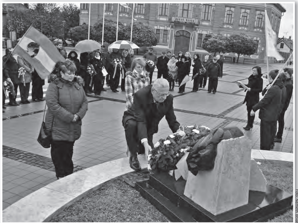
A szeles, esős időjárás ellenére a Hősök terei koszorúzás sem maradt el

A szónok azt hangsúlyozta, hogy a magyarok, a történelmi idők során mindig kivívták az önrendelkezéshez való jogukat. Lerázták az oszmán, a Habsburg és a szovjet igát is. A magyar forradalmárok '56-ban a hatalmas túlerővel, a tankokkal is szembeszálltak, a szabadságért. Ma is büszkék lehetünk a kart karba öltö egyetemisták elszántságára, hősiességére.