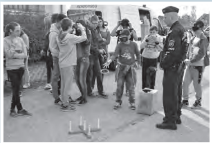
A rendőrség standjánál is sok érdeklődés várta a gyerekeket

Futóversenyyel indult a program, majd a gyerekek csoportjai tíz állomáson, forgószínpad-szerűen ismerkedhettek a bűnmegelőzéssel, az egészséges életmóddal kapcsolatos témákkal, a fenti szervezetek segítségével. A szervezők gondoltak a kikapcsolódásra is: a gyerekek kipróbálhattak egy hatalmas légvárat, finom egészséges ételeket kóstolhattak, nem utolsósorban pedig, a program zárásaként, az X-Faktor győztes Opitz Barbi koncertjét élvezhették.