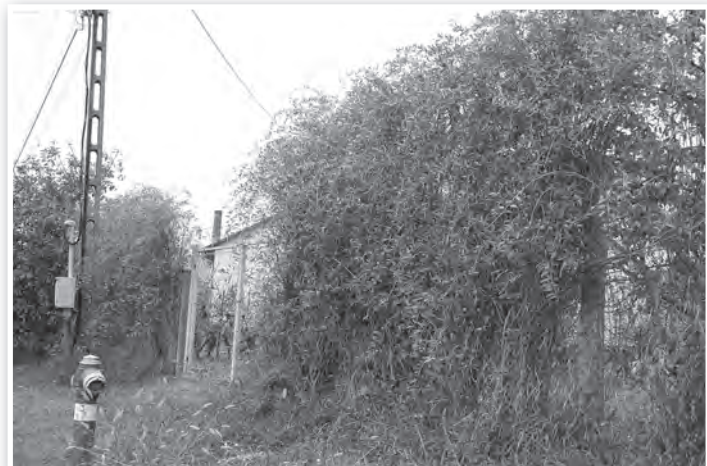
Egy száz évesnél is idősebb sövény a Babits utca legelejen

A Lyceumot egy debreceni példánya tette országosan ismertté,