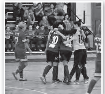
A tolnaiaknak volt okuk az öröme a Hajdúböszörmény elleni rangadón