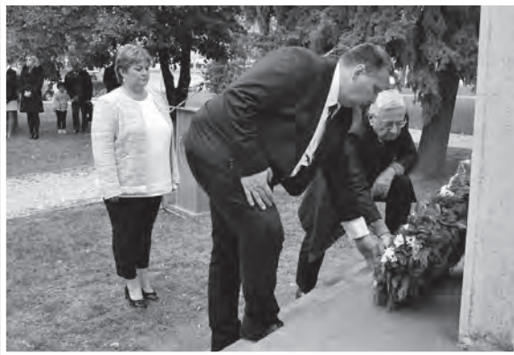
A város vezetői koszorúzták meg az emlékművet