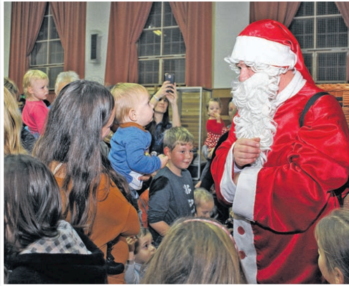
A nagycsaládosok Mikulása idén is bőkezű volt