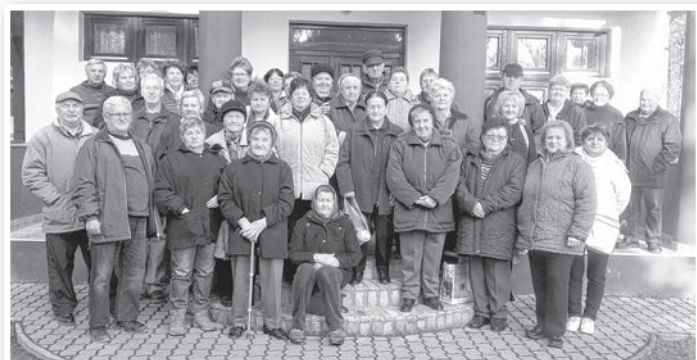
Tolnai vándorló nyugdíjasok a murgai művelődési ház előtt

élvezi a nagyobb társaságot, ismerős közösségben érzi jól magát igazán. Emellett örömet okoz neki, ha az idősebb, egyedül élő tagtársainak is tud egy-egy szép napot szervezni. Hiszen a Vándorló Szépkorúak Baráti Körének a lényege is az összetartozás, az egymásra figyelem. Hogy ha egy mód van rá, mindenki érezze jól magát.