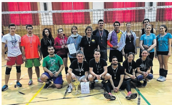
A november 3-i torna érmesei, fekete pólóban a Nagy Farkenstein csapata

A téli felkészülést január 9-én kezdjük, hogy aztán majd 9 hosszú hét után újra télmérkőzésen szállhassunk versenybe az első helyért. Erősítésekről még korai lenne beszélni, változások azért biztosan lesznek. Kemény tavasznak nézünk elébe, így a felkészülés is az lesz. Köszönöm mindenkinek az elmúlt év munkáját és kívánok jó pihenést, kellemes ünnepeket, tartalmas felkészülést, egészségben és eredményekben gazdag új évet! – zárta nyilatkozatát a vezetőedző.