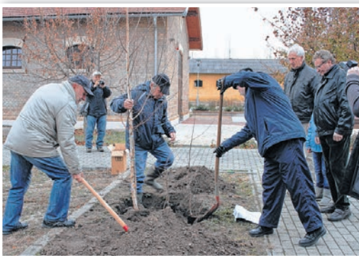
A vándorló szépkorúak fát ültettek