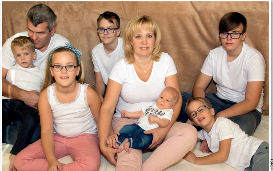
A szűk család, ők nyolcan: mama, papa, gyerekek

Amikor megkérdezem, hogyan reagál a külvilág a sok gyerekre, csak mosolyognak. Vannak