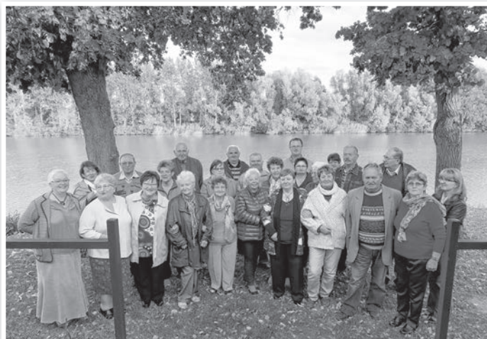
A találkozó tagjai a Gödör udvarán

túljutva találtak rá egykori tolnaiakra. A sok egymásra találás után régi barátságok elevenedtek fel és élnek azóta is, a technika eme nagyszerű vívmánya által. Hogy kinek mi jut