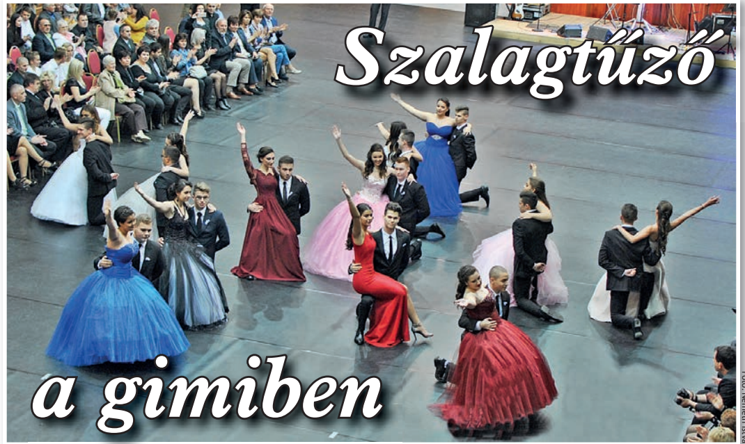
A 12. A osztály tánca is nagy tapsot kapott