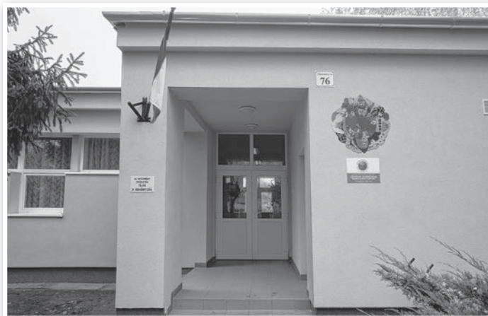
A tolnai Aprajafalva óvoda energetikai korszerűsítését mintegy 30 millió forinttal támogatta a JETA

igényeihez. Jelentős változás, hogy nőtt a támogatási intenzitás, azaz kevesebb önrészt kell vállalniuk az önkormányzatoknak a megpályázott projekteikhez. Egyes esetekben, így közösségi programok szervezése, tervdokumentáció készítése