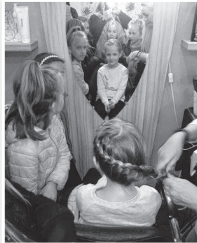
A fodrász szakmai bemutató is népszerű volt a széchenyis lányok körében

szerszámokat is kipróbálhattak. A Lampek húsboltban különféle húsrúkkal ismerkedtek meg, kóstolót is kaptak. A Penny Marketben megnézték az eladók munkáját.