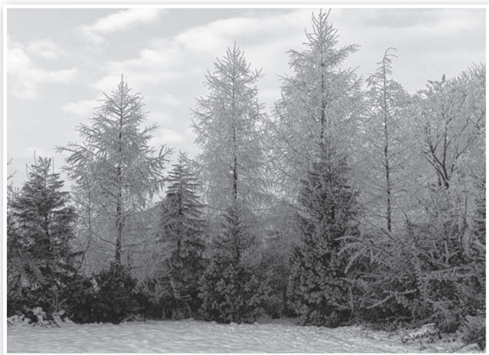
A hatalmas kert a béke szigete

Alig húsz évesen még nem felnőtt korúak ezek a fák, de az avatott szem már most meglátja bennük a jövő kertjét, ami már most is nagyon szép. A bejárat mellett egy gyönyörű atlasz cédrus fogad minket, jelezvén, hogy a szomszédos ártéri erdő mellől egy kertbe érkezünk. A fából épült lakóház mellett egy zömében örökzöldek alkotta sövény kíséri hátra a kert belsőjébe, amelynek cserszömörccéi és