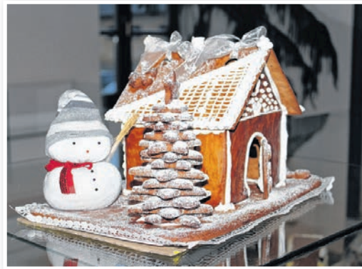
A díjnyertes mézeskalács mű

Másnap délelőtt a könyvtárban régi meséket vetítettek diafilmről a gyerekeknek. Délután az idén alakult Vándorló Szépkorúak Baráti Köre nyírfákat – egy fehér