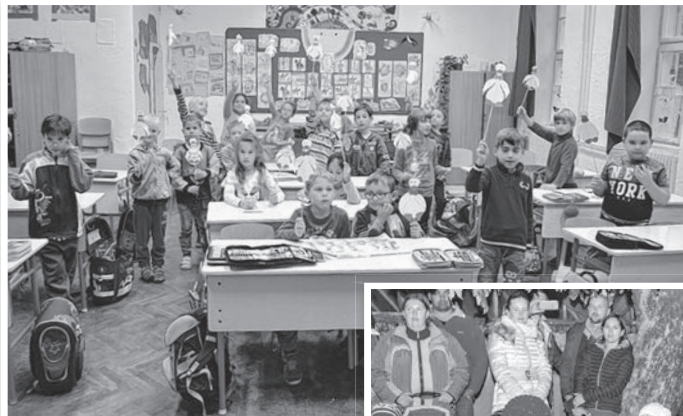
Az iskolások libabábót is készítettek