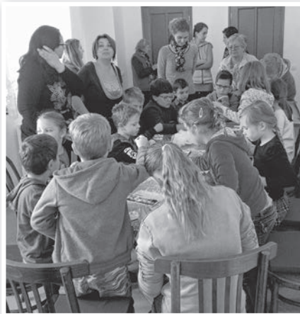
Ünnepi készület a tolnai református imaházban

November 25-én, az advent kapujában, az idén immár másodszor rendezte meg ünnepi készü-