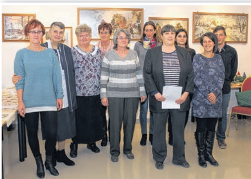
A Művészbejáró című kiállítás néhány alkotója