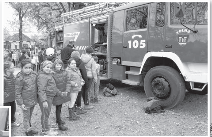
A tolnai tűzoltók is tartottak bemutatót a Wosinsky iskolásoknak