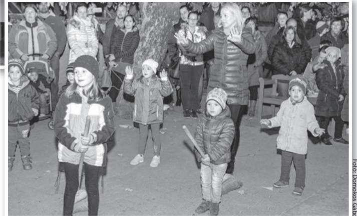
A műszi óvodások a felvonulás előtt műsort adtak