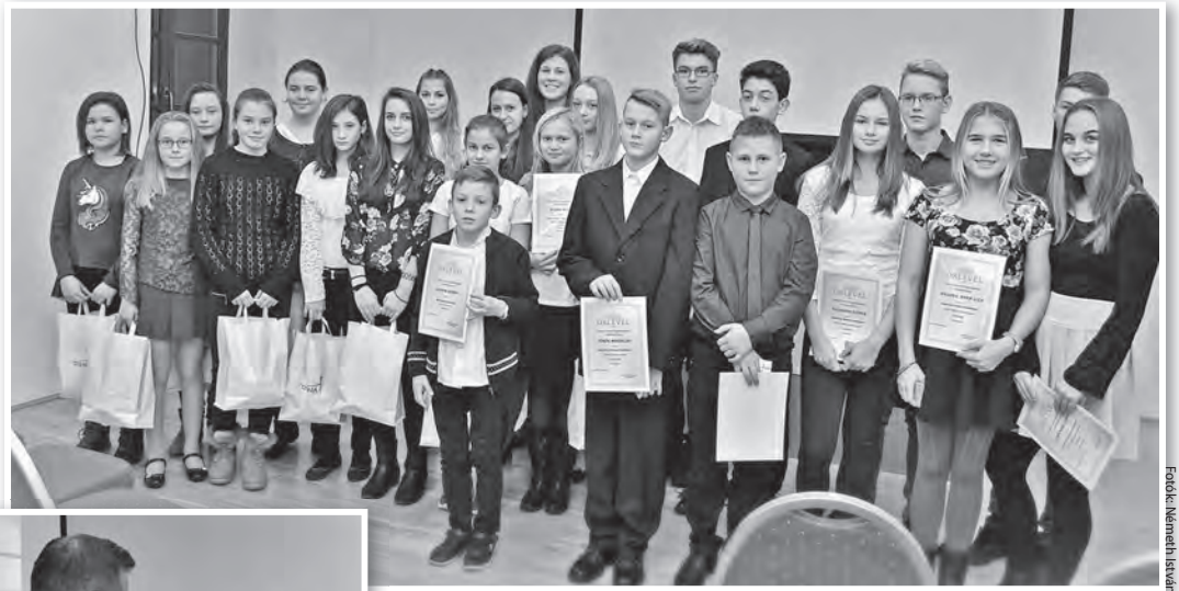
A városi sportünnepen részt vett, 2017-ben a legkiemelkedőbb eredményeket elért tolnai sportolók