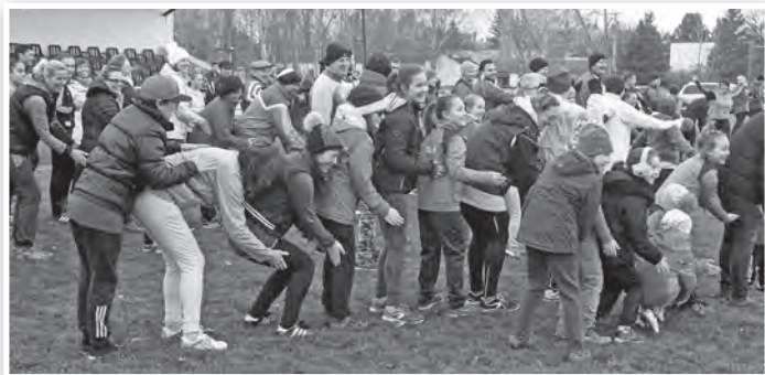
A zenés bemelegítés is szilveszteri hangulatban zajlott

A TOVÁBB-osok az év végén egy másik mozgásos programot is szerveztek: december 30-án a hagyományos Zengő-túrán vettek részt, mintegy negyvenen. Pécsváradról indulva jutottak fel a Mecsek legmagasabb csúcsára, ahol délben sok száz emberrel együtt koccintottak a boldog új esztendőre.