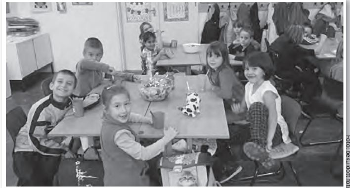
A gyümölcssaláta készítés és -evés sem maradhatott ki a programok közül

Változatos programot kínált a diákoknak a Széchenyi iskola az egészség-hónap alkalmából.