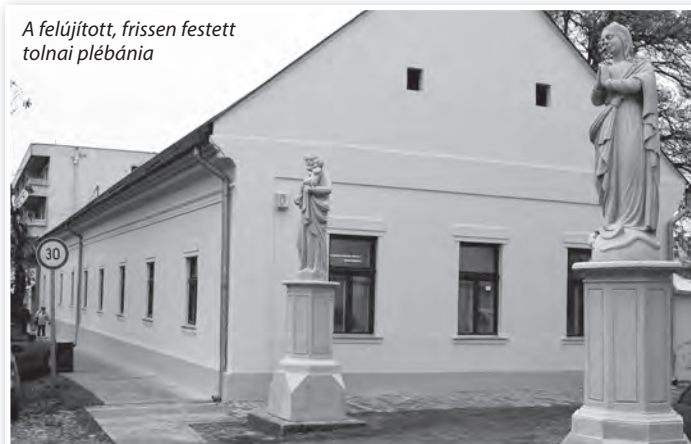
A felújított, frissen festett tolnai plébánia

mely mély vallásos lelkületébe enged bepillantást. Mint Link Judit könyvtárvezető elmondta, ezek a versek gyógyíthatnak, megnyugtatók, elringatják a lelket. Érdemes olvasni őket. A kötetből a tolnai Szent István Gimnázium két tanulója olvasott fel verseket. A jó hangulatú rendezvény teázással és beszélgetéssel zárult. LJ