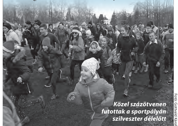
Közel százötvenen futottak a sportpályán szilveszter délelőtt

Egyáltalán nem szégyellték magukat a hagyományos szilveszteri futás résztvevői a 2017-es esztendő utolsó napján. Igaz, különösebb haszonnal sem járt számukra a 2017 méter teljesítése, leszámítva a célba érkezőknek járó szalancukrot, a teát, illetve a forralt bort, valamint a vidám hangulatban eltöltött időt és a néhány percnyi pulzusnövelő mozgást. (Folytatás a 19. oldalon.)