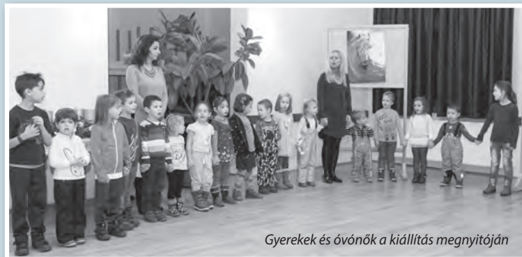
Gyermekek és óvónők a kiállítás megnyitóján

A mözsi Zöldkert Óvoda gyermekeinek kiállítása