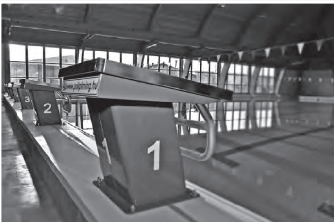
A létesítményben egy 25x15 méteres és egy 10x6 méteres medence áll rendelkezésre

Az uszoda a terheléses próbaüzem után, várhatóan február 2-től lesz látogatható a nagyközönség számára is.