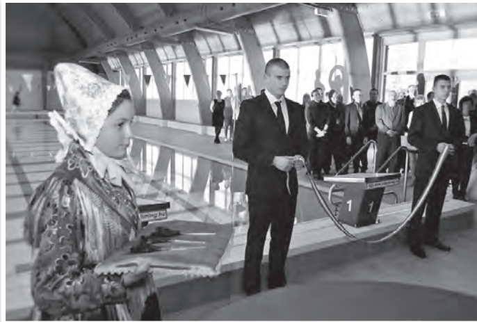
Az uszodaberuházáshoz a város 85 millió forinttal járult hozzá

Az egykori tolnai laktanya területén már több épület kapott új funkciót. Van gimnázium, szálloda, sportcsarnok, kulturális központ, öregek otthona s néhány céges műhely, raktár. Most egy olyan létesítményt avattak, melynek nem volt elődje, nem egy régi épület átalakítása során született, hanem a „semmiből nőtt ki”, az egykori gyakorló téren.