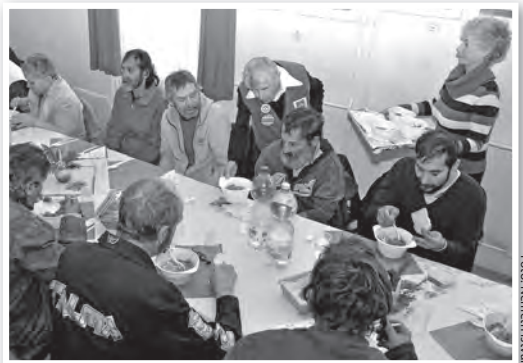
Negyven főre készült a töltött káposzta

December 23-án délben tartotta karácsonyi szeretetvendégségét a Katolikus Karitás Tolnai Csoportja, amelynek során negyven személyre főztek a szervezet aktivistái. A lélekemelő eseményre, amelyre a város és a városkörnyék