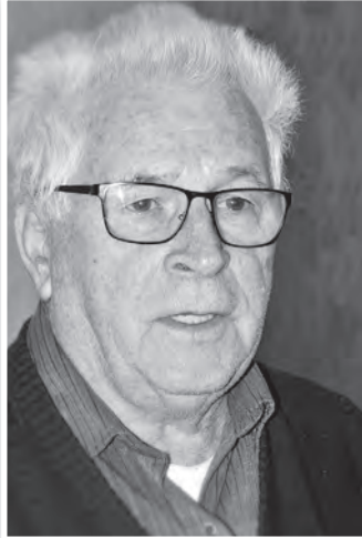
Pista bácsi nyugdíjasként, huszonhárom éven át kézbesítette a Népújságot

iskola elvégzése után került Pestre autószerelő inasnak, ahonnan fel-szabadulva, előbb a 2-es számú, majd az 1-es, fővárosi autószerelő vállalatához került. De mindez csak