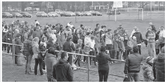
Közel 150-en teljesítették a távot