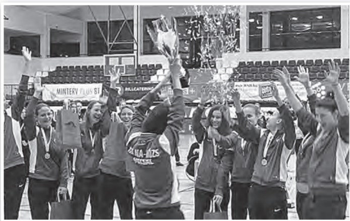
Igy örültek a felnőtt csapat tagjai a kupagyőzelemnek

A Kiskunfélegyházán rendezett Karácsony Kupa női futballfesztiválon a tolnai felnőtt és az U15-ös gárda is sikeresen szerepelt.