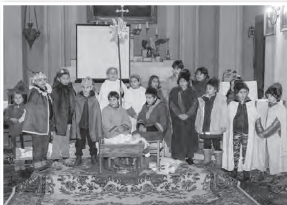
A katolikus iskola diákjai betlehemes játékot adtak elő a templomban

A református nőszövetség tagjai énekeltek az idősek otthonában, a tolnai imaházban pedig főzést, szeretetvendégséget tartottak. Mindemellett öt-hat éve advent idején jótevénykedés vásárt rendeznek a Lovardában. K.E.