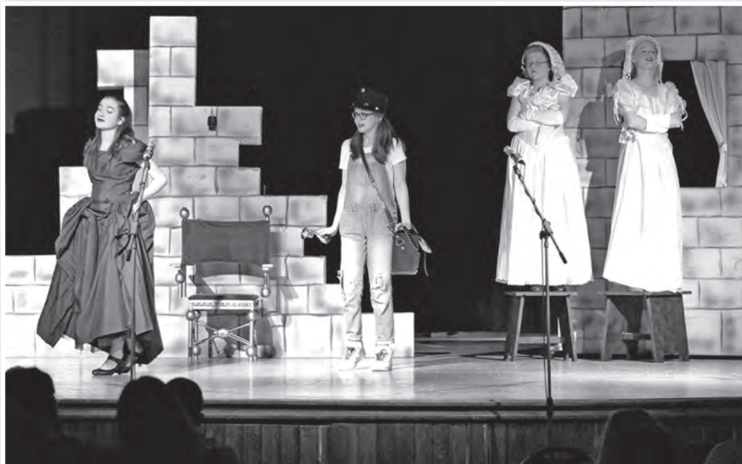
Részlet a Zenario társulat Tolnában előadott Hamupipőke előadásából