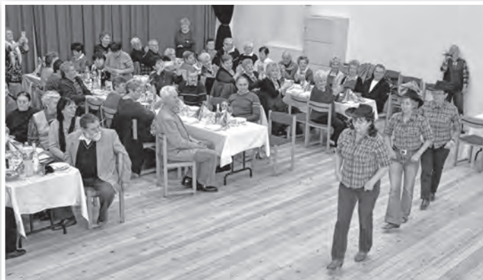
A műzsi country táncosok produkciójával kezdődött a vándorló szépkorúak évnvtitja