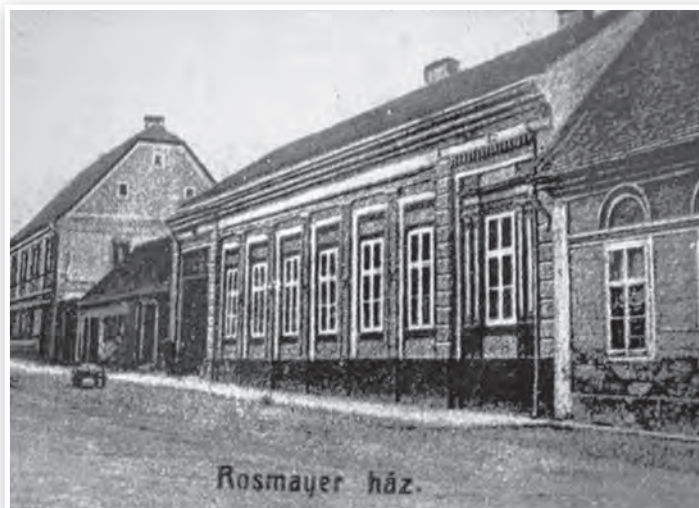
A Rozmáj ház, korabeli képeslapon

Jelentkezést fényképes önéletrajzzal a pbo-roadbt@gmail.com címre kérjük.