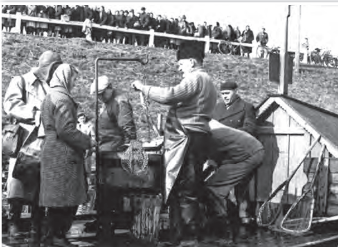
Sorban állás halért az egyik tolnai bárkánál, az 1950-es években