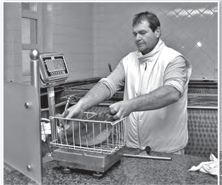
Mindhárom tolnai halboltban, így a Czikk Halasnál is sok hal fogy