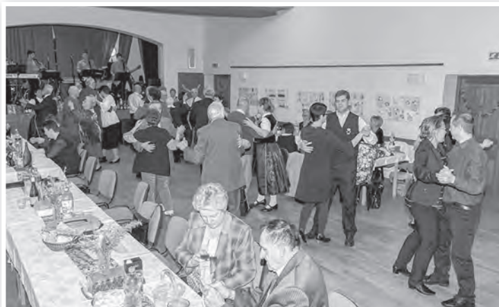
Nem hagyták elmúlni a farsangot bál nélkül

vártak vendégeket. A mözsi művelődési házban lebonyolított vidám rendezvény a Zöldkert óvodások és a város német hagyományát őrző – a Tolnai Német Nemzetiségi Baráti Kör és a Mözsi Német Nemzetiségi Klub – kórusainak műsorával kezdődött. Ezután a Somogy megyei sváb kisközség – Szulok – Silber Buam nevű zenekara következett. Az együttes tagjai húszas, de legfeljebb harmincas éveiket taposó fiatalok, akik kitűnő zenészként, korukat meghazudtoló módon voltak otthon a sváb folklórban és zenei hagyományban. Így hát nem csoda, hogy egy lendületes nyitó Walzer-rel pillanatok alatt életre kelt a táncparkett, nem sok pihenőidőt hagyva a hajnali kettőig tartó táncmulatság bálozói-