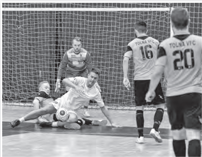
A Tolna VFC első Szedres elleni mérkőzése döntetlen hozott, a bronzmeccset viszont magabiztosan nyerte a Tolna