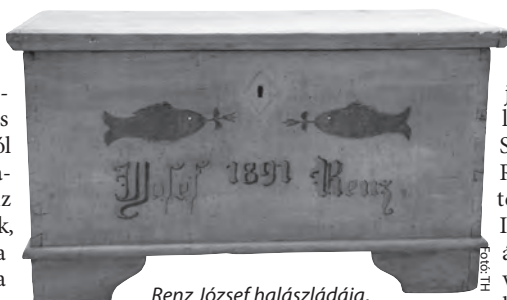
Rencz József halászládája, a bajai Türr István Múzeum gyűjteményéből