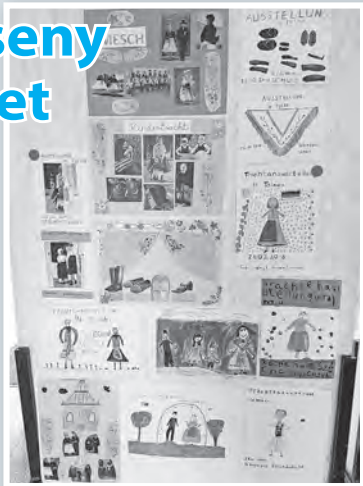
Néhány kiállított plakát a sok közül

Német nemzetiségi versenyt hirdetett a Széchenyi iskola a német nemzetiségi önkormányzattal együttműködve. A gyerekeknek plakátokat kellett készíteni a német népviselet témakörében.