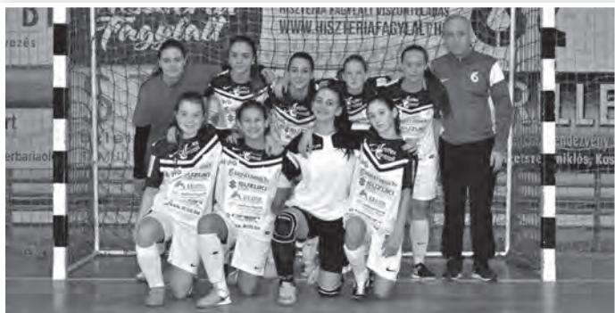
Az U15-ös leány csapat is sikeresen szerepel

KUPAGYŐZTES A TOLNA-MÖZSI! Lapzárta után érkezett: a Brand-Mission-Artifex Tolna-Mözs csapata nyerte a Magyar Kupa 2017–2018-as kiírását. A március 4-i döntőben büntetőkkel győzték le a Hajdúböszörményt.