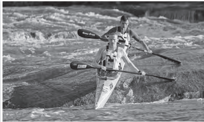
Százhúsz kilométert várt a kajakosokra a Dusi-maratonon

A lebonyolítás szerint a háromnapos versenyen összesen 121 kilométert várt az indulókra csütörtöktől szombatig, így a nyitónapon