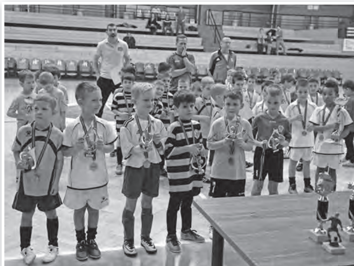
Szekszárdi, kalocsai és paksi csapatokkal mérkőzték a tolnaiak

Változás az is, hogy a kiemelt sportegyesületek a jövőben az edzőtáborozások költségeit is elszámolhatják a városi támogatás keretében.