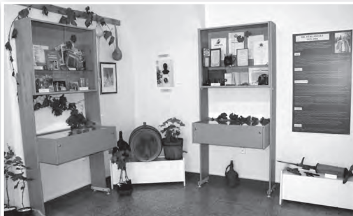
A kiállítási anyag egy része