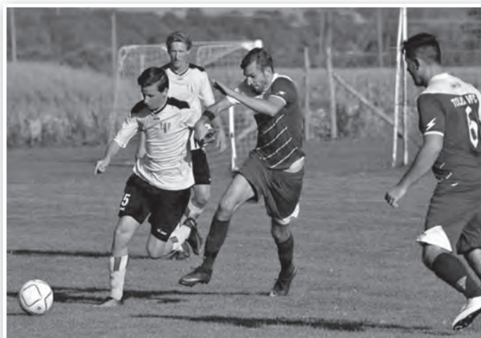
Nagy küzdelem várható a bajnoki címért

lyak, szeretnénk az utolsó tavaszi fordulóban Bátaszéken a mérkőzés és a bajnokság győzteseként elhagyni a pályát! A tavaszi szezon nagyon élvezetesnek és fordulatosnak ígérkezik, ehhez kívánok jó szórakozást minden szurkolónak és a megyei labdarúgás híveinek.