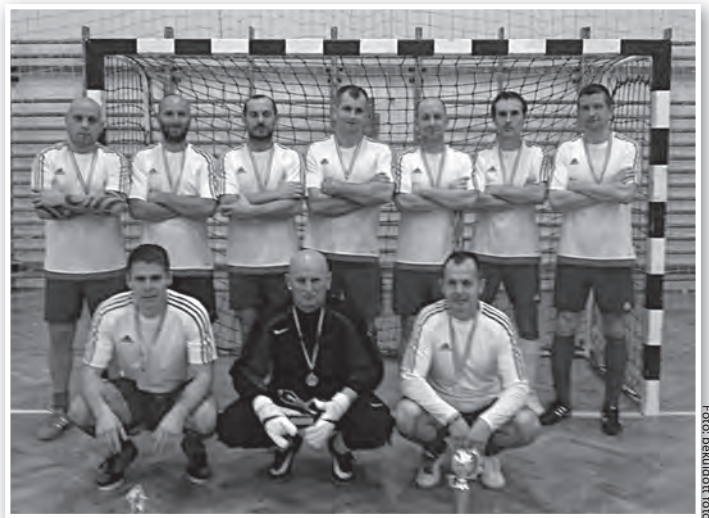
Az Old Brothers hibátlan bajnoksapata