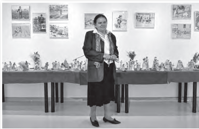
Az alkotó és a kiállított alkotások egy része