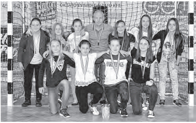
Három ponttal maradtak el az aranyérmestől

A leány futsal U15 I. osztályban is befejeződött a bajnokság. Vologymir Kolok tanítványai dicséretesen szerepeltek, a 3. helyen végeztek.