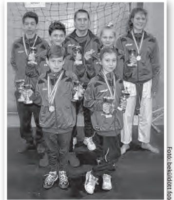
A sárvári versenyről is több érmet hoztak haza

A bált cégek és magánszemélyek egyaránt támogatták, a klub ezúton is köszönetét fejezi ki nekik.