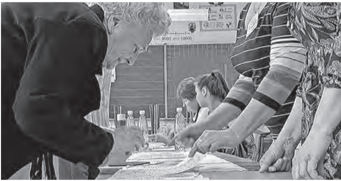
A városban zökkenőmentesen zajlott a választás

A tolnai választópolgárok 63 százaléka vett részt az áprilisi országgyűlési választásokon. A tolnai eredmények nem sokban térnek el az országos átlagtól, de azért akadnak különbségek.