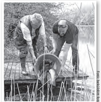
A Déli-holtág vizeibe is szép pontyok kerültek

A tavalyi mérsékelt telepítés másik oka a hal áfa csökkentés körüli várakozás volt: az elmúlt évben a beharangozott 2018-as áfacsökkentés „előszeként” jelentősen emelkedtek a halárak. Az Északi-holtágat üzemeltető Tolnai Horgász Egyesület emiatt inkább kivárt, kevesebbet telepített. A tavalyról megmaradt pénzből pedig idén az áfacsökkentés nyomán olcsóbbá – pontosabban a korábbi évekhez hasonló árává – való halból többet tudnak vízbe tenni.