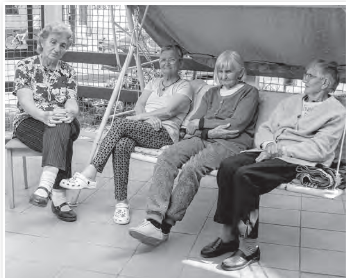
Jó időben a teraszon is kellemesen telik az idő