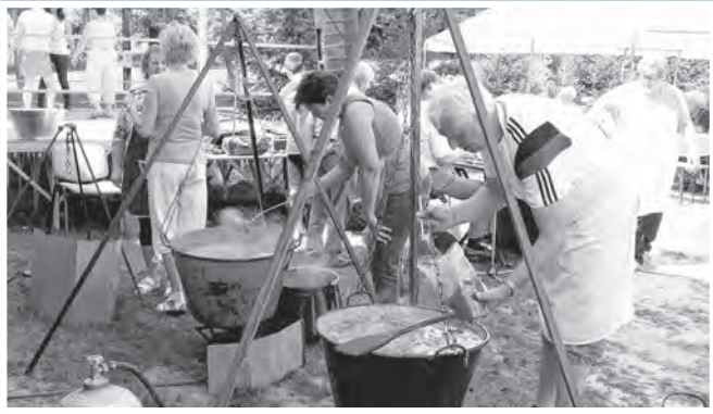
Készül a csülkös bagolyás csipetkével