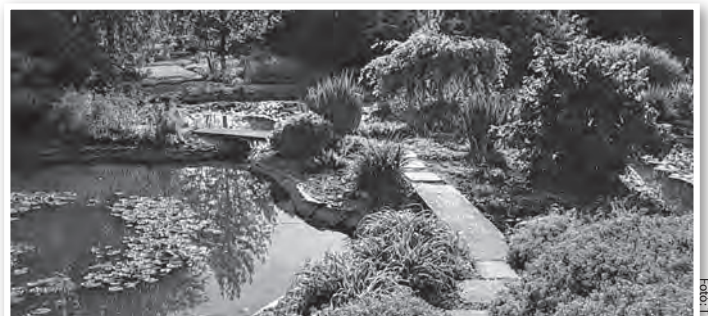
A Merczel-kertben egy tőrendszert is kiépített a tulajdonos

A Merczel-kert, mely a város, sőt a megye egy gyönyörű és különleges látványossága, bátran ajánlható minden érdeklődőnek. Link Judit