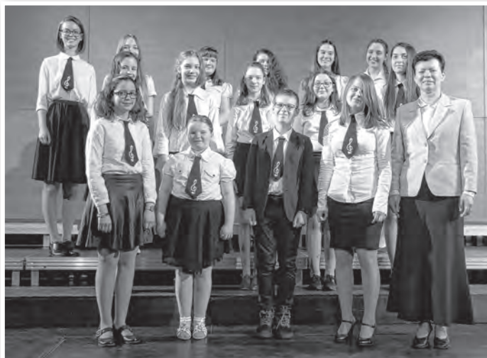
A tolnai zeneiskola arany diplomás kórusa

KÓTA (Magyar Kórusok, Zenekarok és Népzenei Együttesek Szövetsége) minősítést kaptak arany diplomával, emellett országos dicséret