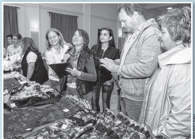
A tolnai csapat a Megyejáró Hétpóba egyik állomásán

A „Vár a Megyén” azokat a települési értéktár bizottságokat is elismerték, melyek kiemelkedő értékgyűjtő és népszerűsítő munkát végeztek. Idén a tolnai és a bogviszlói értéktár részesült „Érték-díjban”. Ez utóbbi témáról bővebben az 5. oldalon olvashatnak.