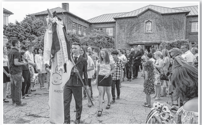
A Szent Mór katolikus iskola végzősei a templomi ünnepségre vonulnak

Nagyobb bánat sose legyen – szölte a dal, és felszálltak a léggömbök. A himnuszt követően Reményik Sándor Ballagás című versével megkezdődött az ünnepség. A hetedik-