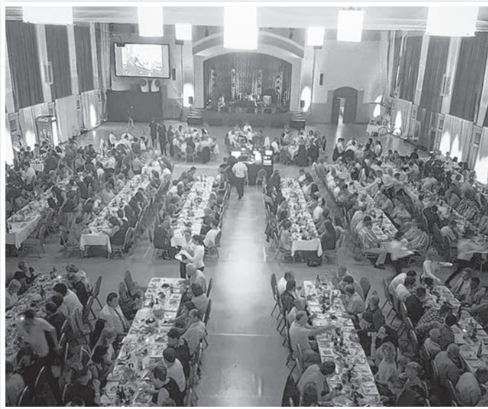
A Fastron megadta a módját a születésnapi ünnepségeknek

A különleges eseményre hivatalos volt a tolnai Fastron Kft. mintegy 700 dolgozója. Rajtuk kívül száz vendég kapott meghívást, köztük a Fastron németországi és malajziai képviselői, valamint itthoni állami és önkormányzati vezetők.