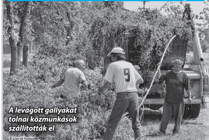
A levágott gallyakat tolnai közmunkások szállították el

Az áramellátás biztonsága érdekében is szükséges