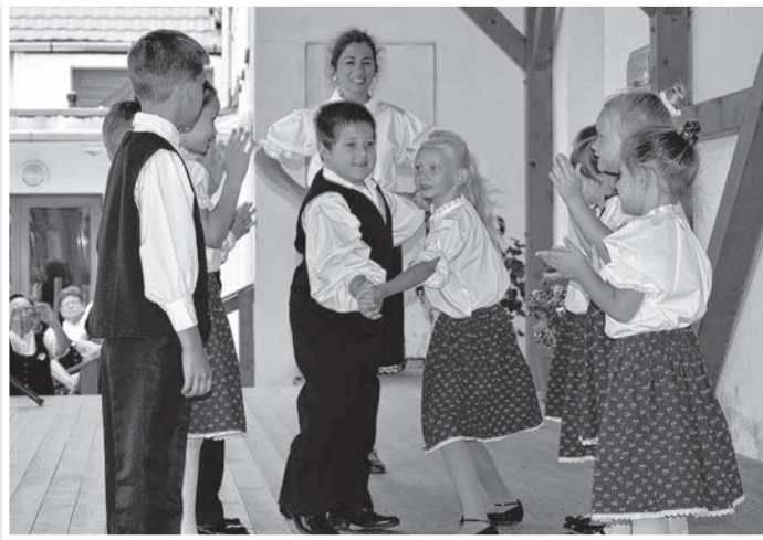
Mözsi óvodások fellépése a fesztiválon

Maga a keltkalács számos ízben és alakban volt megtekinthető és megkóstolható a művelődési ház egyik termében. A legismertebb formája a mákos és diós bejgli, de a legrégebbinek tartott recept a szilvával készült lepény, a kvecsa. -W-