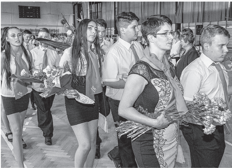
A Wosinsky iskola ballagási ünnepsége idén is a Városi Sportcsarnokban zajlott

Elballagtak a nyolcadikosok a város általános iskoláiból