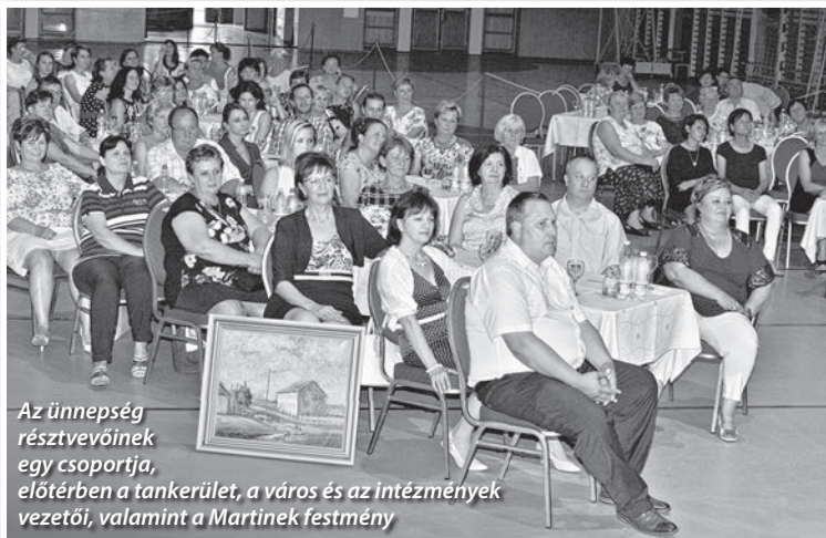
Az ünnepség résztvevőinek egy csoportja, előtérben a tankerület, a város és az intézmények vezetői, valamint a Martinek festmény