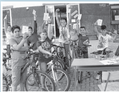
Kerékpáros ügyességi verseny is volt

A május 25-i diáknapi délelőtti programja Ki mit tud?-dal kezdődött a felső tagozat udvarán. A fellépők tánccal, furulya- és fuvolajátékokkal, dallal és versekkel szórakoztatták a közönséget. A továbbiakban a templomkertben lovaglás és íjászat, az osztályokban tetoválás, táblás játékok versenye, valamint kézműves kuckó várta az érdeklődőket. Karkötőket, terítőket, ügyességi játékokat lehetett készíteni. Hétfőpróba volt is a diákok. Volt célba dobás, lajhármászás, mocsárjárás, gólyaláb, pingponglabda pattogtatás. A kerékpáros ügyességi versenyre is sokan jelentkeztek. A délutáni program során a nagymamák és nagypapák elkísérték a diákokat egy kerékpártúrára, valamint egy generációs sétára, ahol Tolna nevezetességeiről tudtak meg érdekes információkat. A Lehel utcai csarnokban pedig játékos sorverseny várta a vegyes csapatokat. A diáknapi gokartozással zárult.