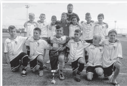
Az U12-es gárda 6. lett a Kölyökliga Országos Bajnokságban

Az U13, U14, U15 korosztály az NB II. nagypályás U14-es és U15-ös bajnokságban szerepeltek. Nyáron ők is strandfociban, télen a megyei futsal bajnokságban mutathatták meg tehetségüket.