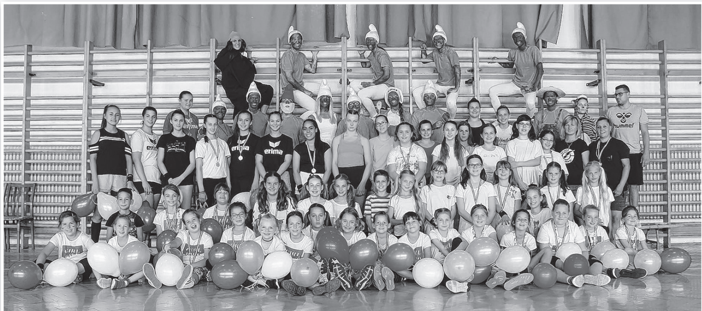
Csoportkép az évzáróról, ahol óvodásoktól a felnőttekig mindenki jelen volt

A megyei felnőtt csapat 1. lett a bajnokságban.