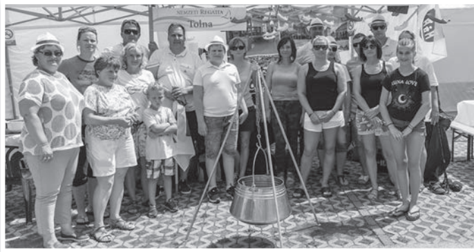
Tolnaiak és egy bográcsnyi krumplinokli

A vitorlás és a sárkányhajó versenyeken is remekül szerepeltek a város csapatai. A vitorlás gárda az előfutamból és a negyedöntőből is továbbjutott, ám a vasárnapi futá-