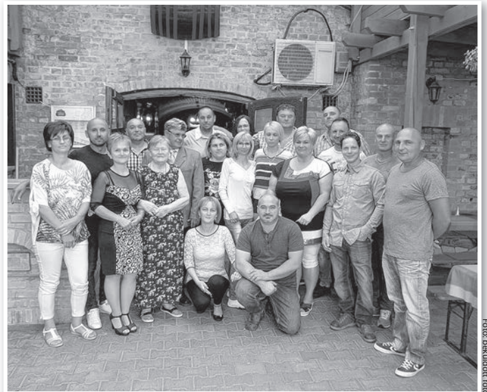
Összetartó közösség voltak és maradtak

– Nem hittem volna, hogy 30 év távlatából ennyi minden emléket és érzést újra át tudok élni. Nagyon