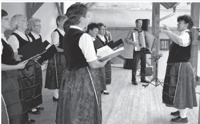
A mözsi német klub énekkarának műsora