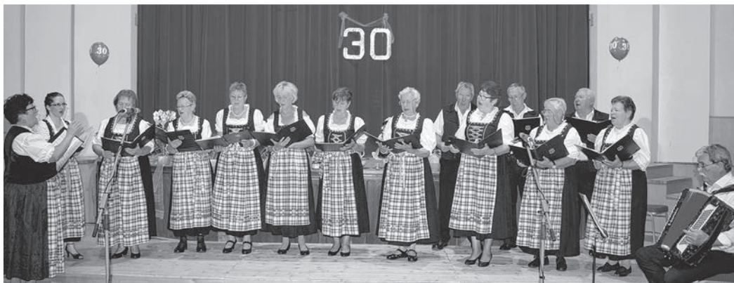
A jubiláló baráti kör énekkara volt az első fellépő a kórustalálkozón