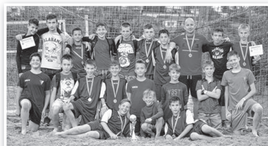
Az U13-14-es csapat 3. helyet szerzett az NB II-es bajnokságban

Az U8, U9, U10, U11, U12 korosztályok a Kiemelt Bozsik programban, és az országos Kölyökliga elnevezésű bajnokságban szerepeltek, mellette a nyári időszakban strandfociban, a télen pedig a megyei futsal bajnokságban vitézkedtek.