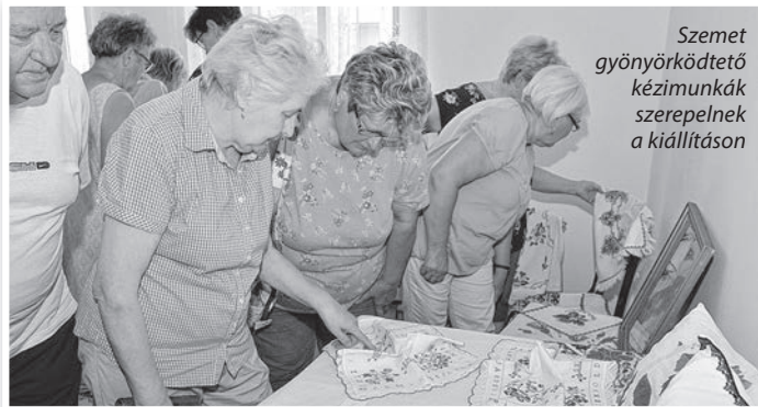
Szemet gyönyörködtető kézimunkák szerepelnek a kiállításon