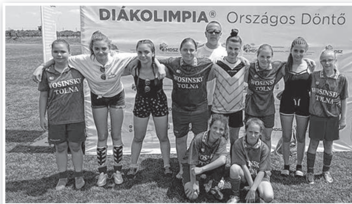
Remekül szerepeltek a tolnai lányok a diákolimpián