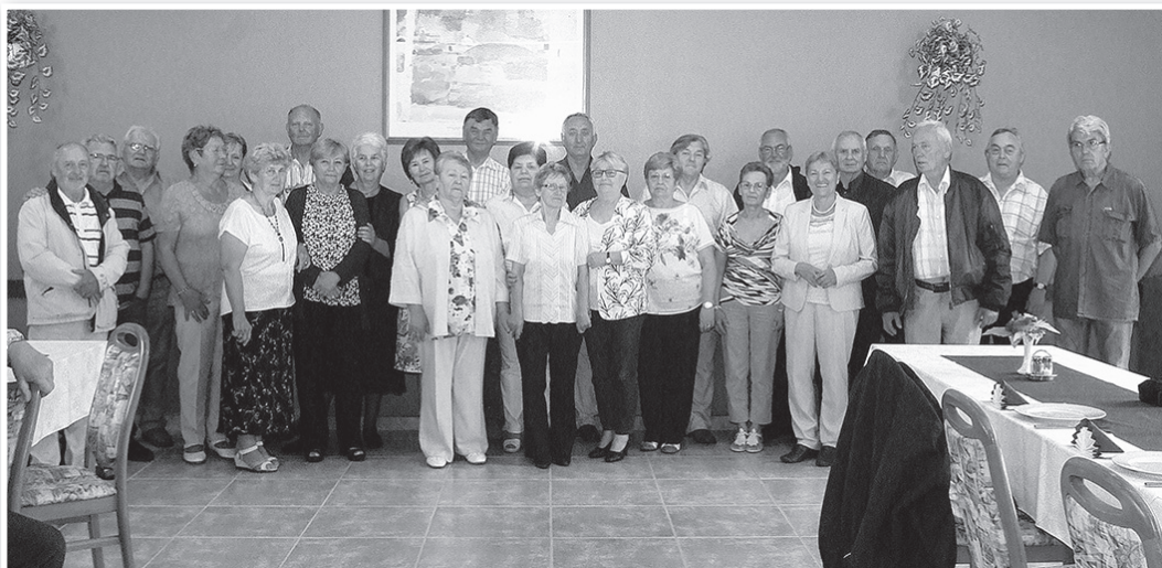
Az egykori fiúk és lányok most megint összejöttek

Arról pedig, hogy volt-e előnye abból, hogy az édesapja is tanított,