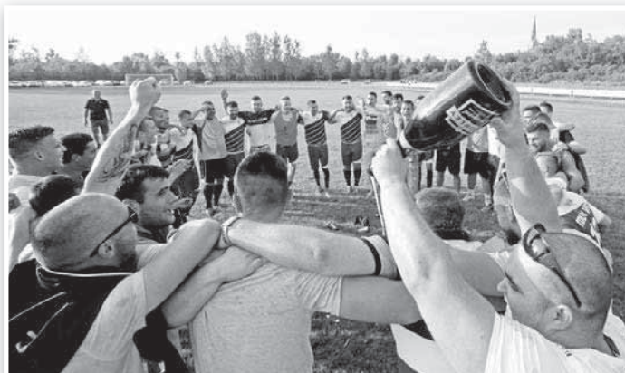
Remek lenne, ha a mostani bajnoki szezon végén is hasonló ünneplésben részesülne a csapat, mint idén júniusban, Bátaszéken