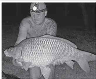
A 12 kilós július végén akadt horogra

mogyorót és erjesztett kukoricát használt. A rövid mérlegelés után pedig már vissza is engedte a halat a vízbe, mivel sporthorgászként minden 5 kiló feletti fogásával hasonlóképpen jár el. Pár hónappal korábban szintén egy kapitális méretű, tíz kiló feletti, 11 kg-os ponty akadt a horgára.