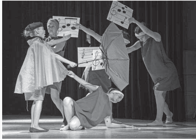
Pillanatkép a musical július 31-i tolnai főpróbájáról

török, kínai, indiai, bangladesi, horvát, kazah, ukrán, belorusz gyerekek mellé egy magyar fiatal is került. Az orosz résztvevők Moszkvából, Szentpétervárról, Andarszkból, Lesznojából, Cselja-