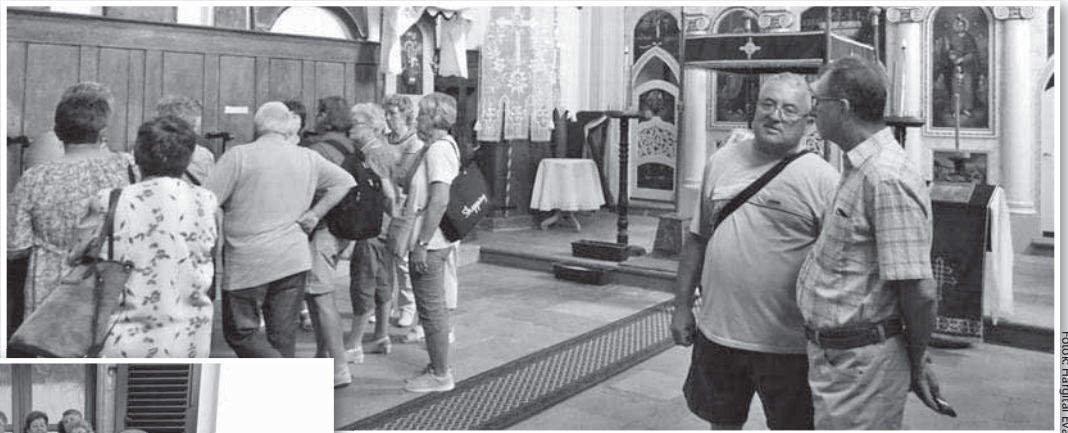
A medinai szerb templomot is meglátogatták

A szerb templomtól a lokátorig. Így is összefoglalható a vándorló szépkorúak június eleji medinai kirándulása.