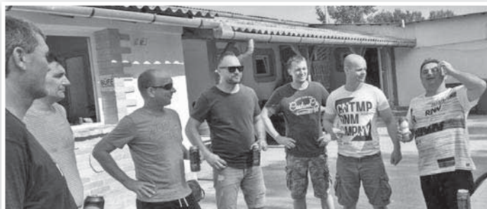
A pályán kívül biztosan megmaradt a gárda egysége

A pályán kívül azonban biztosan megmaradt a gárda egysége, amit a bavgulyás és némi hideg sörök elfogyasztása utáni baráti beszélgetés, emlékidézés is bizonyított. Valamint az, hogy már most kijelölték a jövő évi találkozó időpontját: 2019. július 13-án ismét lesz Generáció Kupa.