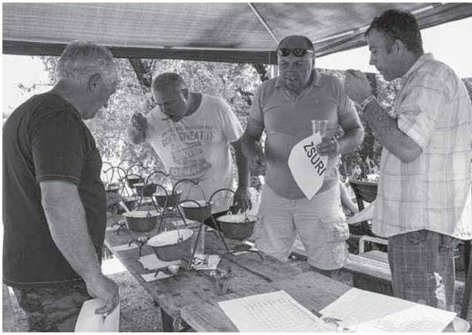
Nem volt könnyű dolga a zsűrinek