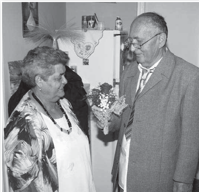
Az ünnepség még otthon kezdődött

A lakásban szétnézve múlt és jelen szépen megfér egymás mellett, a nagyszoba falán, főhelyen egy nagyméretű régi szentkép