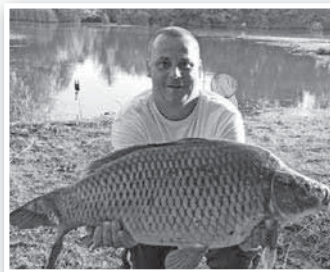
A 11 kilós pontyot tavasszal fogta