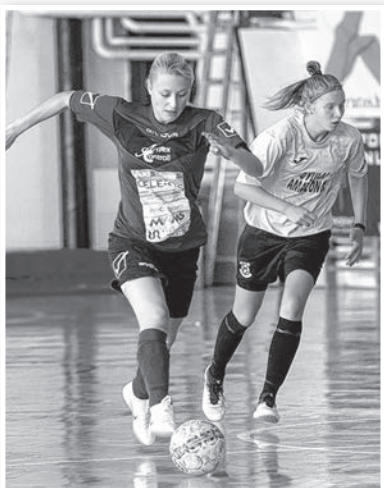
A Tolna-Mözs két lépéssel a Gyula előtt

A Tolnai Kajak-Kenu Sportegyesület fiatal versenyzője kajak egyes és kajak négyesben 1000 m-en áll majd rajthoz a serdülők nem hivatalos világbajnokságának tekinthető versenyén.