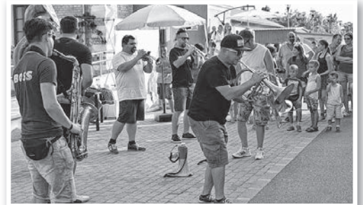
A BOSS csapata a „flaszteron” csinálta a hangulatot

Az ideai, rendhagyó Bárka Fesztivál – ahogy azt várni is lehetett – a korábbi éveknél kevesebb résztvevővel zajlott, de aki ott volt, jól érezte magát. Az új helyszín is tetszést aratott, többen felvetették, hogy a későbbiekben a Város Napi Vigadalom programját lehetne ott rendezni.