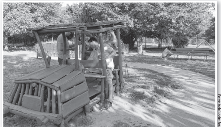
Munkában az egyesület tagjai

A SZIKRA 2018 márciusában alakult. Célja színvonalas és változatos közösségi programok szervezésével olyan közeget biztosítani a fiatalok számára, amely erősíti az összetartozást és azokat az értékeket, amelyek a mai virtuális világban háttérbe szorulnak. Az egyesület tagjai mindenkit szívesen