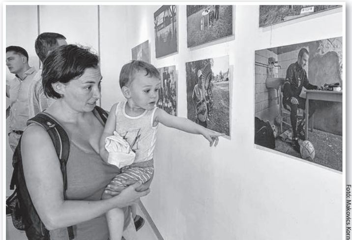
Nem csak a szakmának, a közönségnek is tetszettek a fotók