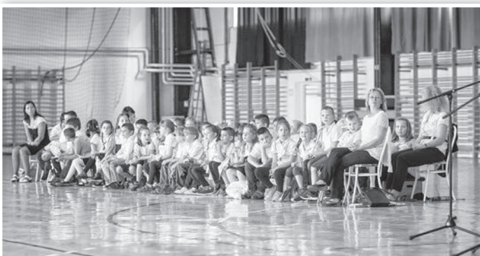
Tanévnyitó ünnepség a Városi Sportcsarnokban