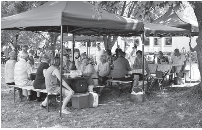
A gimnázium előtti fák alatt főttek a halászevek