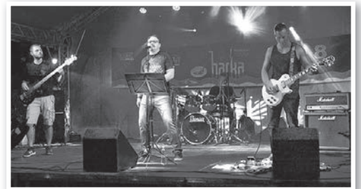
A Blaze Masters is odatette magát a színpadon