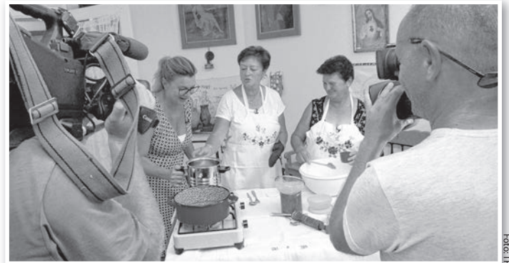
A kinyomós fánk készítését a mőzsi tájházban rögzítették

A Tolnán felvett anyagot várhatóan októberben, vagy novemberben láthatják a tévénezők.