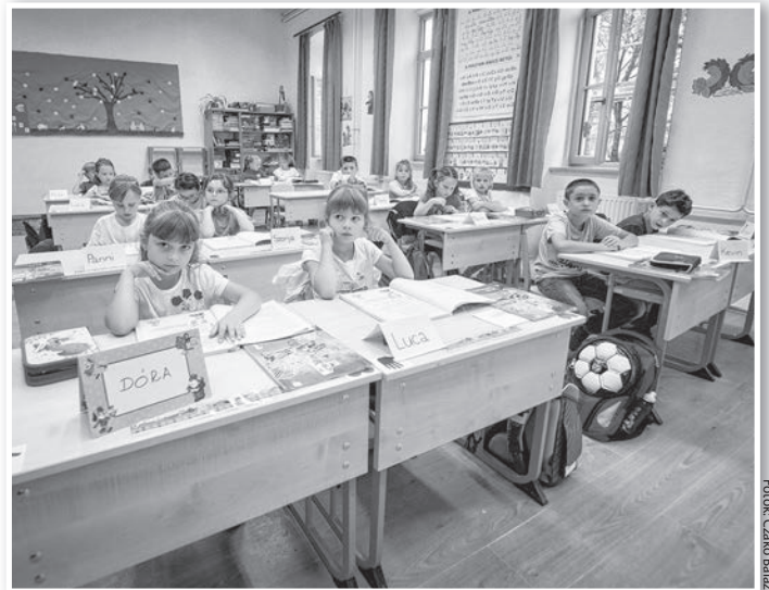
Az első tanítási napon az Eötvös utcai iskola 1. A osztályában

A Szent Mór Katolikus Általános Iskolában összesen 90 tanuló kezdte meg a 2018/2019-es tanévet szeptember 3-án, köztük 6 elsős. A tantestület jelentősen változott: öt pedagógus távozott az intézményből, közülük ketten nyugdíjba vonultak, más elköltözött, illetve nem vállalta tovább a tanítást nyugdíjasként. Minden álláshelyet sikerült betölteni, így új pedagógusok várták a diákokat tanévkezdéskor