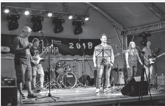
A Walking Mama blues és rockzenekar idén nyáron alakult