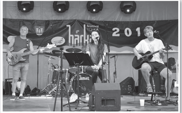
A Final Panic egyáltalán nem pánikolt