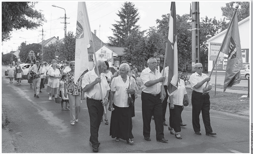
Idén is a Nyugdíjas Szabadidő Klub vezetésével zajlott az aratófelvonulás

Az augusztus 20-i ünnepi program a városi hagyományok szerint zajlott. Délután négykor indult az arató felvonulás a Penny parkolójától, a Tolnai Nyugdíjas Szabadidő Klub beöltözött tagjai, illetve a város vezetői, valamint az érdeklődők részvételével. (Folytatás az 5. oldalon.)