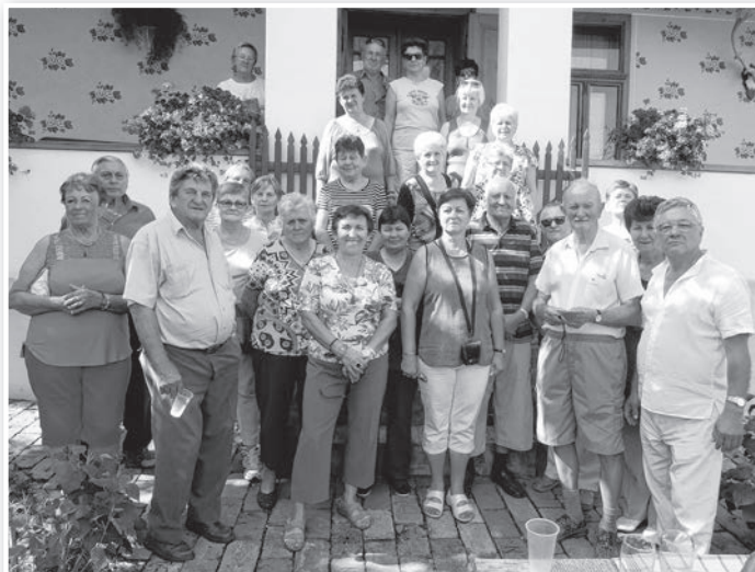
A mözsi német klub tagjai a Kisjakabfalvi Konrad-ház udvarán