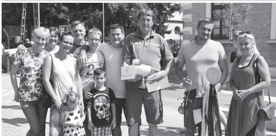
A halfőző verseny győztes csapata