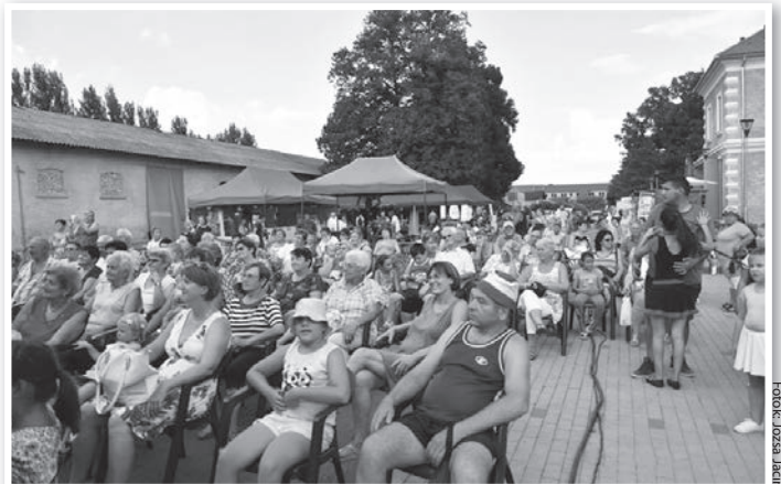
Sokan eljöttek a Bárka Fesztivál ideai új helyszínére is