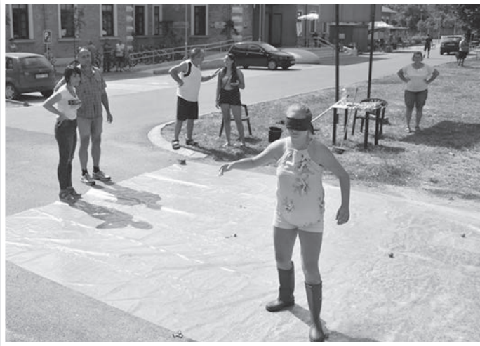
Tojástaposó munkában a Dunai Szivacsok csapata

Szombaton 10 órától indult a helytörténeti ügyességi csapatverseny a MAG-Ház környékén. A résztvevőknek Tolna múltjának egy-egy történetéhez kapcsolódóan kellett feladatokat megoldaniuk. A háromfős csapatok kipróbálhatták magukat a középkori vadászokat idéző „gerelyhajításban”. Bombázhatták (teniszlabdák segítségével) Tolna várának falait, és közreműködhetek a Duna kanyarjainak kiegyenesítésében egy kötél segítségével. De beleélhették magukat a Selyemfonó fonalgom-