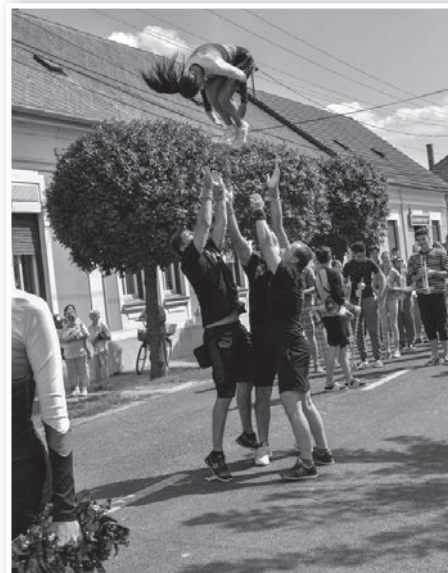
A budaörsi cheerleader csoport látványos kunsztokat mutatott be