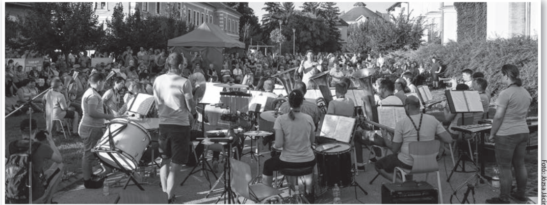
Benépesült a MAG-Ház melletti tér a tolnai IFZ koncertjére

De nem csupán a felvonulás tért el az általában szokásostól. A közel kétszáz fellépő ellátását is újszerűen oldották meg a rendezők, akik főzőversenyt hirdettek meg a fesztivál alkalmából. A jelentkező csapatoktól pedig azt kérték, hogy az egyébként sem csupán néhány főnek készülő főztjükből a fellépők is kóstolhassanak. Mintegy tíz csapat – köztük a tolnai zeneiskola, illetve a gimnázium gárdája, a Vándorló Szépkorúak Baráti Köre, a TOVÁBB, zenészek, zenerajongók, családi és baráti közösségek, még