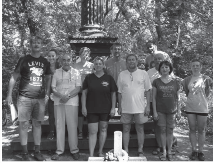
A TOVÁBB-os csapat az arnyas síremléknél

zerédj Pál neve fogalom Magyarországon: az önzetlen munka fogalma. Egy életet töltött el a közszolgálatában, mindent tett, min-