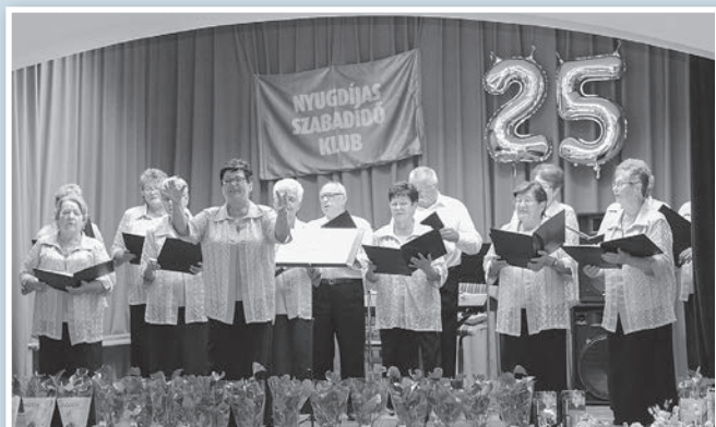
Utoljára lépett fel a szabadidő klub kórusa

A Tolnai Nyugdíjas Szabadidő Klub Kórusának 25. évfordulója