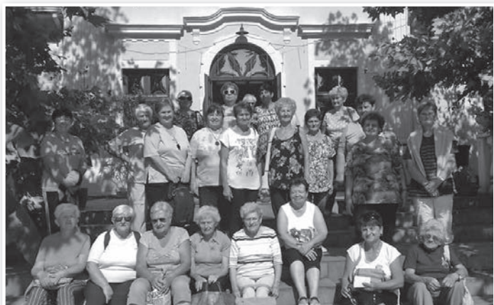
A közös fotó a Lukács rezidencián készült

Az idei év záró programjaként szeptember 26-án Kecskemétre és Szarvasra kirándultak, igen nagy létszámban: 53-an szálltak fel a buszra. Kecskeméten megnézték a Népi Iparművészeti kiállítást, ahol felfedezték Verseghy Ferenc habán tányérjait is. Szarvason az arborétumban jártak, és az ott lévő mini Magyarország makett kiállítást is megcsodálták. Hazafelé a fagyaltkülönlegességeket is kínáló híres soltvadkerti cukrászdába tértek be.