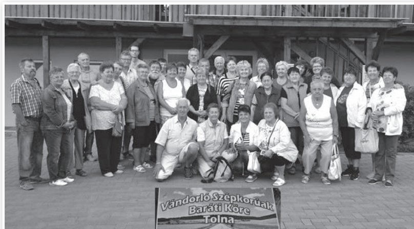
A tolnai vándorló szépkorúak az egerszalóki szálláshely előtt

nézték a Fátyol vízesést és még pisztrángot is kóstoltak. Délután a gyönyörű Bükk Nemzeti Parkon