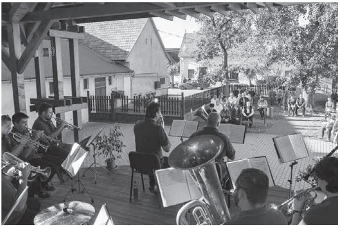
A ceglédberceli fiatal zenészek remek hangulatot csináltak