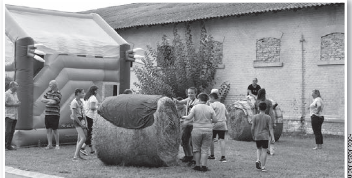
A volt istálló épület (a háttérben) a Brass Vegas Fesztivál idején. Jövő ilyenkor már másképp fog kinézni

A munkákat tanév közben nem lehetett elkezdni, az iskolai vakáció ideje túl rövid volt a kivitelezés befejezésére. Szeptember elsejére viszont az oktatás megkezdéséhez szükséges minimális feltételeket megteremtették. A befejezés határideje november 30., ami minden bizonnyal tartható lesz.