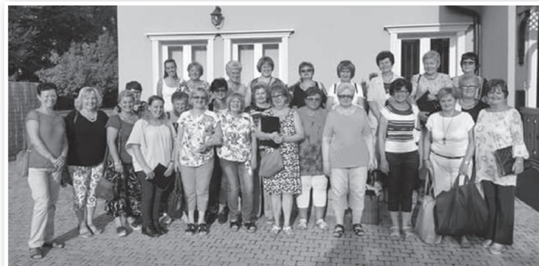
Hazaindulás előtt, a Villa Larusnál

Úgy ítéljük meg, hogy a kórus látogatása, szereplése hozzájárult a két település közötti partnerkapcsolat további fejlődéséhez. A település kórusát meghívtuk viszontlátogatásra Tolnára. Az utazással járó költségeket (szállás, étkezés, egyéb) saját erőből, az autóbusz költségét a tolnai önkormányzat közművelődési pályázatán nyert összegből fedeztük.