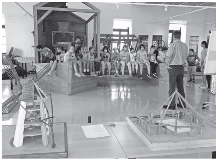
Foglalkozást is tartottak a gyerekeknek

Az előadások ingyenesek, a szervezők várnak minden érdeklődőt, különösen a szülőket, a rendezvényekre. Link Judit