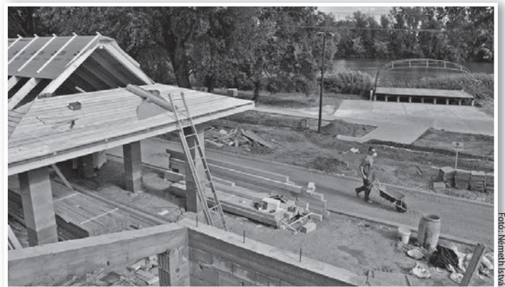
A Duna-parton is folyik az építkezés

Az ún. CLLD-pályázatról mostani számunkban a szeptemberi testületi ülésről szóló tudósításban,