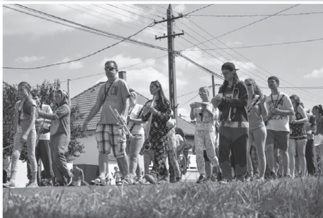
A Tolnai Ifjúsági Fúvószenekar tagjai is laza szerelésben vonultak fel

tokollhoz, aki akart, jelmezbe bújhatott. Ezért alakult úgy, hogy a tolnaiak például pizsamában vonulva fújták. (Folytatás a 9. oldalon.)