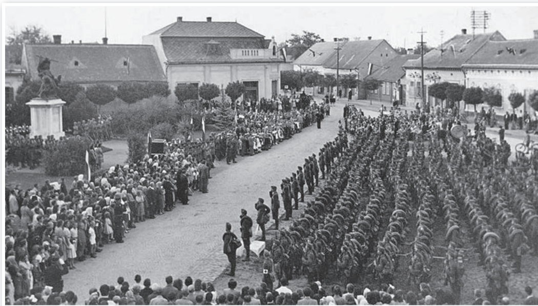
Egy kép 1942 júniusából: a Hősök terén búcsúztatták a frontra induló tolnai tüzérek