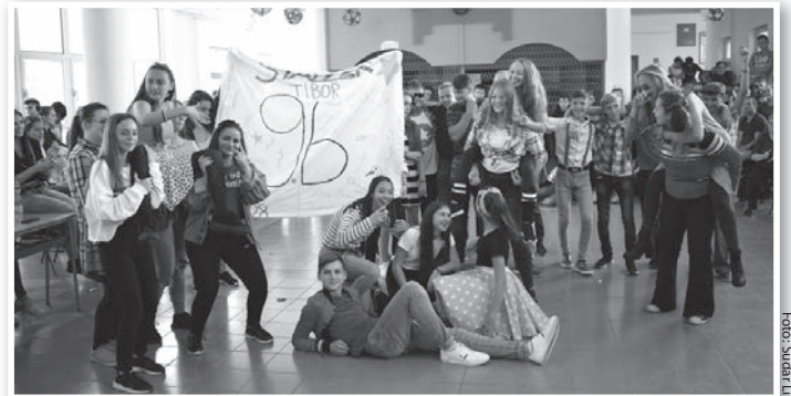
A győztes 9. b. osztály

Ezúttal három induló osztályt avattak a gimnáziumban