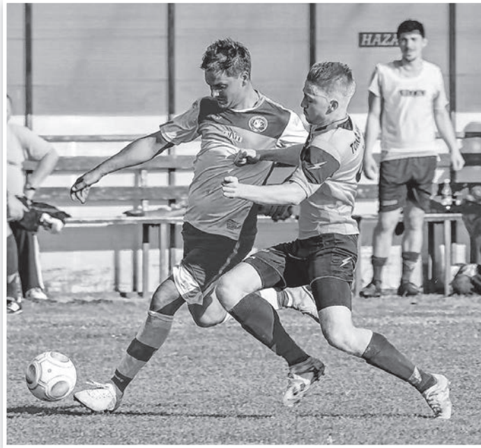
Szívósan küzdött a Bátaszék, de megérdemelten nyert a VFC