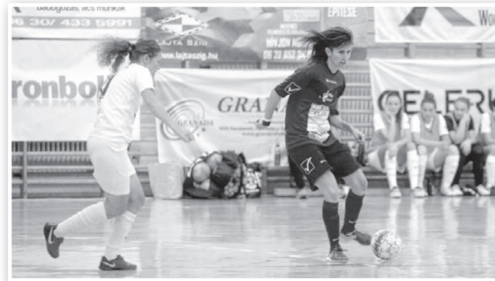
Varga Adélék a sírból hozták vissza a Miskolc elleni meccset

A két együttes egymás elleni múltja és a mérkőzés presztízse ellenére a lelátón békésen érkeztek