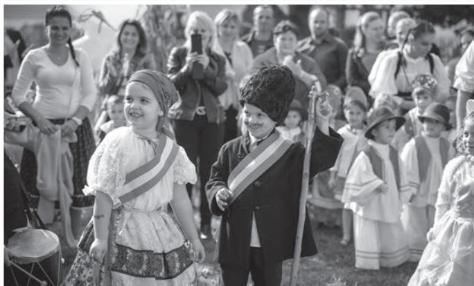
A bíróné kikérése sem maradt el

A Nemzeti Együttműködési Alap által kiírt pályázaton, valamint a város közművelődési pályázatán nyert összegek lehetővé tették, hogy az óvodások változatos tevékenységek során szerezzenek tapasztalatokat az ősszel betakarítható gyümölcsökről, a szüreti munkákról, a feldolgozáshoz szükséges eszközökről. A Schieber Pincészetnek köszönhetően ellátogathattunk Szekszárdon a Baranya-völgybe, ahol a gyermekek közelebről láthatták a szüret folyamatát. Az óvoda eszköztára egy új szőlőpréssel, darálóval és puttonnyal gazdagodott, így a jövőben a