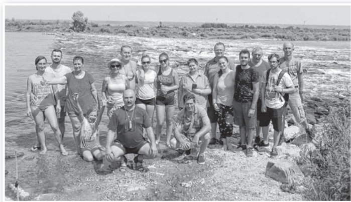
A Szigetköz csodálatos élményeket tartogat