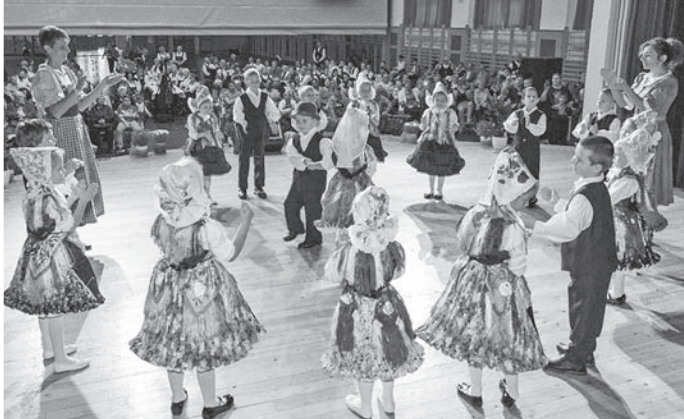
A műzsi óvodások műsorát is örömmel fogadta a szép számú közönség

A Német Nemzetiségi Önkormányzat XXIV. alkalommal rendezett nemzetiségi napot, amelyen helyi és más települések német nemzetiségi művészeti csoportjainak remek műsorát is élvezhette a közönség október 27-én, a Lovardában.