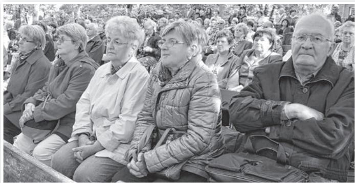
Tolnai zárandokok a máriaremei templomkertbentemplomkertben

A mise után egyéb kulturális és lelki programokat kínáltak a hívek-