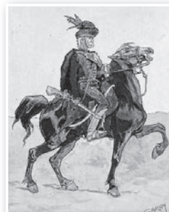
Egy jellegzetes Garay Ákos alkotás