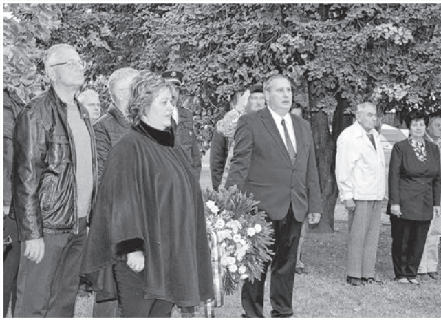
A város vezetői mellett számos szervezet képviselője és civilek is részt vettek a megemlékezésen

Nemcsak magyarok harcoltak a magyar szabadságért