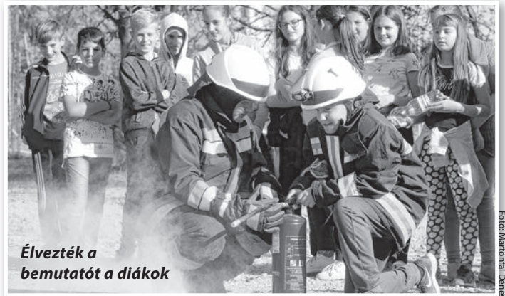
Élvezték a bemutatót a diákok

Az Év Polgárőr Pedagógusa kitüntetés egyébként számára meglepetés volt. Abban viszont mindenképpen megerősítette, hogy ezek szerint mások is úgy látják: jó úton jár, jó dolog, amit csinál.