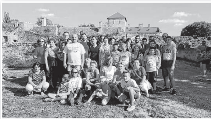
Tolnai nagycsaládosok a tatai várnál

Tatán, az „élővizek városában” rendezte hagyományos őszi találkozóját a Nagycsaládosok Országos Egyesülete. Az eseményen a Nagycsaládosok Tolnai Egyesülete is részt vett szeptember 15-16-án. A tolnaiak a találkozó első napján a várat, majd az Öreg-tavat tekintették meg, illetve a helyi kisvonattal, a Dottóval, idegenvezetés mellett ismerkedtek a nevezetességekkel. Megcsodálták a Tata melletti Fényes karsztforrás-csoportjánál kialakított, 2015-ben épült egyedülálló, 1350 méter hosszú cölöpsétányt is, ahol felfedezték a lappidék páratlan állat- és növényvilágát. Az Öreg-tó Hotelben eltöltött éjszaka, majd a közös reggeli után a második nap a tatabányai Fényes Fürdő nyújtotta élményekkel telt el. A kirándulást – már hagyományként – a dunaföldvári fagyaltozóban zárta a tolnai csoport.