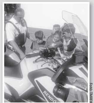
A rendőrmotorokkal is ismerkedhettek a gyerekek

A gyerekek a rendőrmotorok nyergébe is felpattanhattak, illetve rendőr- és tűzoltóautókba is beülhettek. A közlekedésbiztonsági nap zárásaként minden kisdiák ajándékkal térhetett haza.