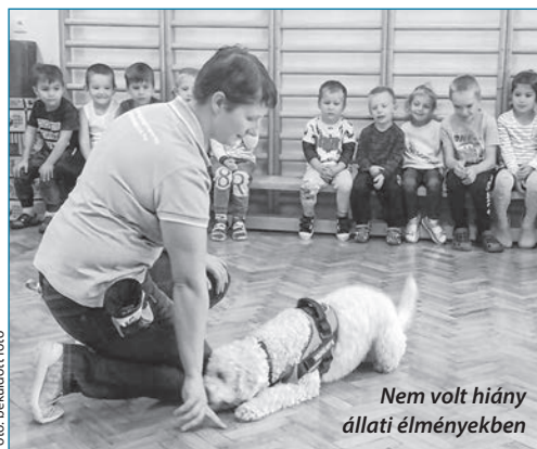
Nem volt hiány állati élményekben

A projekt időtartama alatt a szülőket bevonva gyűjtést rendeztek kutyamenhelyek számára. Az adományokat a gyerekek segítségével rakták az autókba. Az állatmenhelyek példaértékű támogatása hozzájárulhat ahhoz, hogy a gyerekek felelősségteljes, állatszerető felnőttekké váljanak.