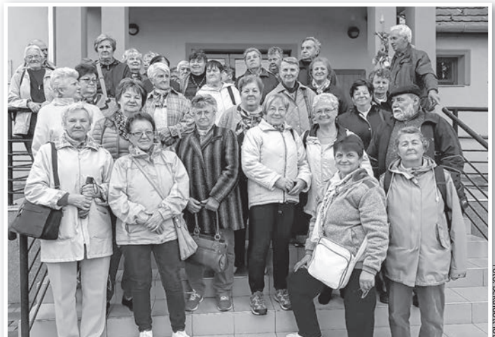
Szép napot töltöttek együtt Szátkán

Az ebédet a Trófea étteremben fogyasztották el, majd tó körüli sétára mentek. A kirándulás utolsó állomása Ortó János gazdaságának megtekintése volt. A családi gazdaság sajtókiállításával is foglalkozik, volt lehetőség kóstolással egybekötött sajtóvásárlásra is.