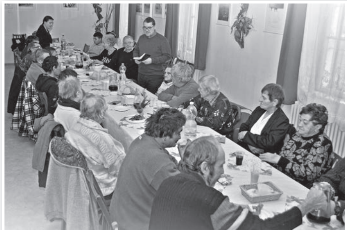
Karácsonyi szeretetvendégség a tolnai civil házban

A karitászt nem csak adni akar, néha kapnia is kell. Léleekben is. Ezt szolgálta az a január 5-i, szombat délutáni közös ünneplés, ahol ez alkalommal egymásnak is örülve – immár kifújva magukat – ök ülték, állták körül az ünnepi asztalt. (ká)