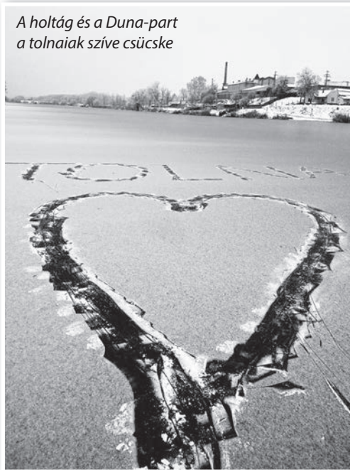
A holtág és a Duna-part a tolnaiak szíve csücske

hiányzott a közös bölcsesség, és csak utólag, a megvalósulás után kaptak szakszerű tájékoztatást a beruházásról. Pedig megítélése szerint ellenkező esetben talán jobban, okosabban is el lehetett volna költeni a pályázaton elnyert több, mint negyedmilliárdos támogatást.