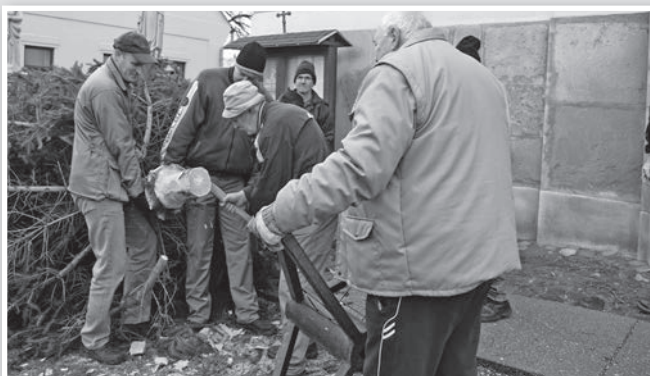
Sokan működtek közre a munkában

Köszönik továbbá az elmúlt évi támogatásokat Tolna Város Önkormányzatának, a Fastron Hungária Kft-nek, a Mözsi Mezőgazdasági Kft-nek, a Tolnatext Bt-nek és magánszemélyeknek.