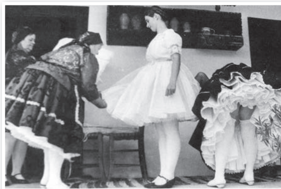
Menyasszony öltöztetés Bátán

film, egyharmadát a digitális korszakban töltötte. Számos elismerésben részesült, 1993-ban például, a 12 áldozatot követelő pörbölyi iskolabusz-baleset humánus bemutatásáért, „Az év sajtófotója” pályázaton II. díjat nyert. Sikeres sorozata volt a rácsvölgyi – tamási – cigánytelepről készített is, a hetvenes évek végén. A nyolcvanas évek elején duplaoldalas képriportjait közölte az Új Tükör, Keleti Éva szerkesztésében.