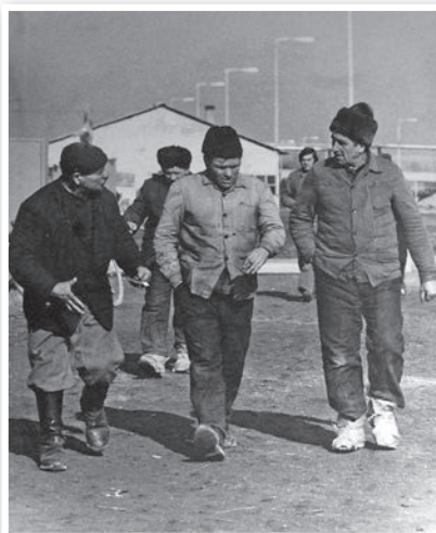
Az atomerőmű építői a hetvenes évek elején

Sokfelé járt, a föld alatt és a föld felett: fotózott uránbányászokat 1200 méteres mélységben, és