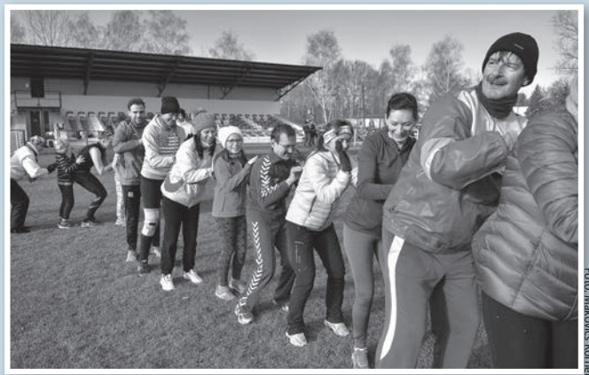
Vidám, társas bemelegítéssel hangoltak a futásra

A TOVÁBB-osok egy csoportja az óévbúcsúztató hagyományainak megfelelően a szilveszteri futás előtt egy másik mozgásos programon is részt vett: a december 30-i Zengő túrán, a Mecsekben. A Pécsváradról induló túraútvonalon ilyenkor az ország számos pontjáról sok százán vándorolnak fel a Mecsek csúcsára, hogy délben a Himnusz elnéklésével és pezsgős koccintással köszöntsek egymást a közelgő évzárás alkalmából.