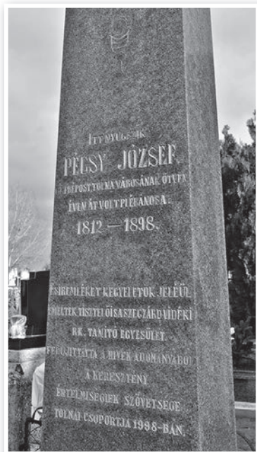
Pécsy József síremléke a tolnai temetőben

Pécsy József a szentségekkel ellátva, felkészülve a halálára, 86 évesen, 1898. május 1-jén hunyt