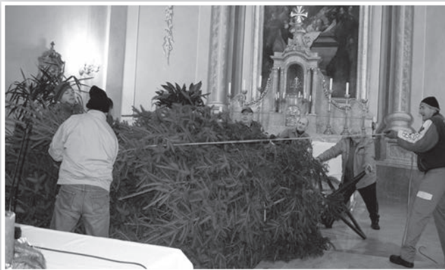
Fenyőállítás a tolnai templomban

tolnai templom ötméteres fenyőjét az önkéntes tűzoltók segítségével vágták ki. Elhelyezésében és díszítésében sokan közreműködtek, köztük az egyházközségi tanácsadó testület tagjai. -Wy-