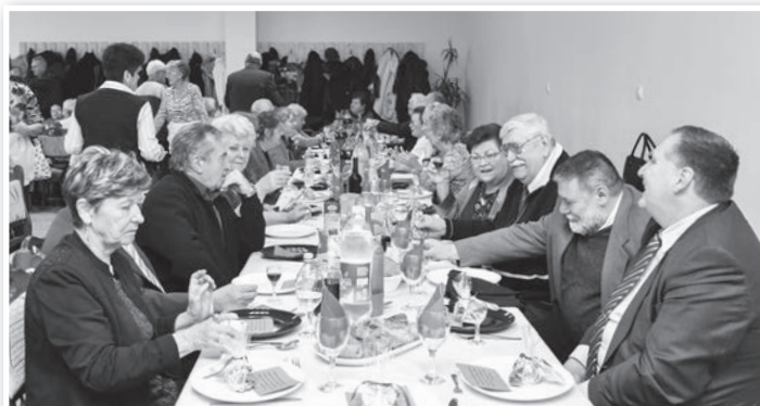
Ezúttal is remek volt a hangulat