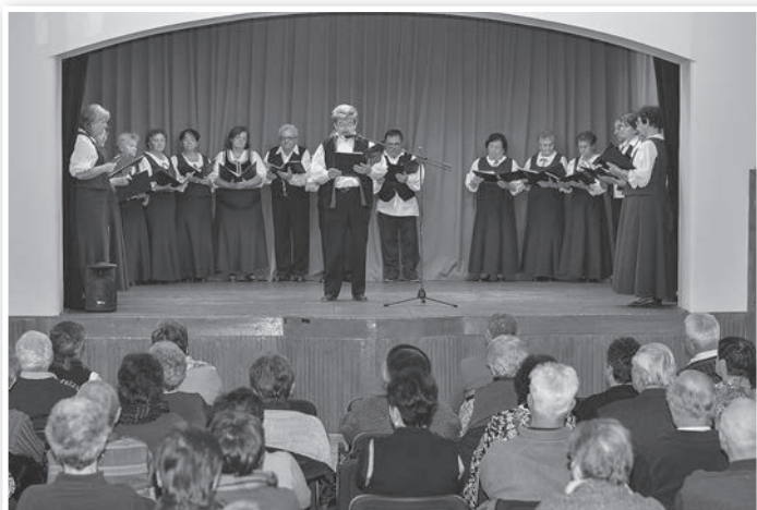
Öröme a református gyülekezet programján Mőzsön

a plébániaközösség rászorultjainak 200 darab, egyenként 8-9, (illetve kétszer 4 kg-os) ajándécsomag készült. Ez, hála a lakosság adakozó kedvének, több mint idáig bármikor a helyi karitászt életében. Mindezeket december 17-én és 18-án osztották ki a tolnai listán szereplő rászorultak között, amin túl Bogyiszlóra 12 csomag, Mőzsre 32, Fácánkertre és a tolnai külterületre 25 csomag jutott. (ká)