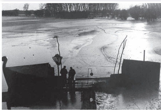
A tolnai bárka télen

itt született. A holtág, a bárka, a halászat, a gyárakban, üzemekben, térszékben folyó munka, a városi rendezvények, az épületek, a szobrok, mind-mind kedvelt fotótémái voltak. A hőskort a filmszalagok őrzik. A digitalizálásért nem lelkesedik, mert tart az adatvesztéstől. Képeit mindig gondosan archiválta. Közel fél évszázad történéseit örökölte meg. -W.G.-