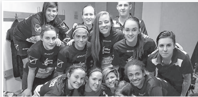
A Magyar Kupában volt oka örülni a csapatnak

Döntőhöz méltó küzdős, jó iramú mérkőzést játszottak a felek,