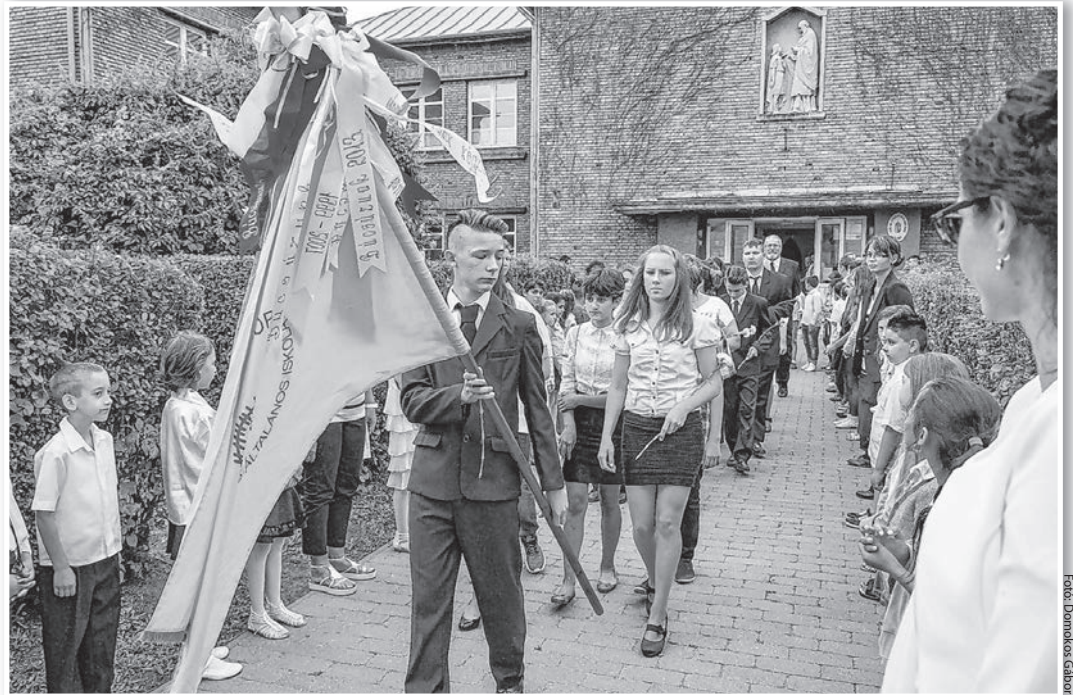
Ballagás a Szent Mór katolikus iskolában, 2018-ban. Idén minden diák elbúcsúzik a sulitól

Az iskolába jelenleg 85 diák jár a nyolc évfolyamon, közülük 27-en nem tolnai állandó lakcímmel rendelkeznek. A megyei kormányhivatal fogja kijelölni azt az iskolát, amelynek kötelező felvennie a diákokat, de természetesen más intézménybe is lehet jelentkezni.