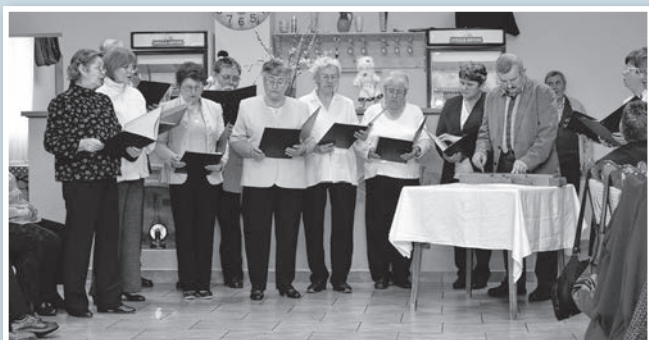
A baráti kör vegyeskara is műsort adott

Változatos programtervek az idei évre is