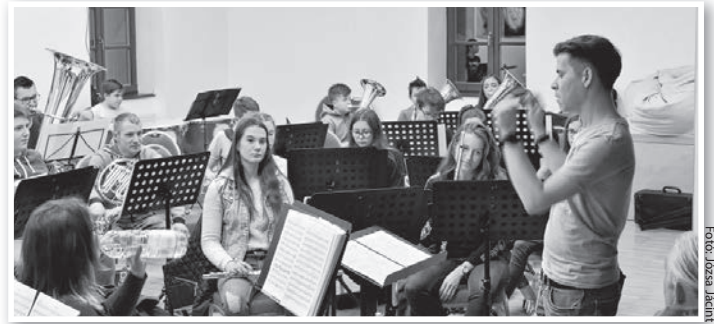
Az IFZ nyílt próbája a MAG-Házban

Rekordszámú nézőt várnak a március 30-i előadásra