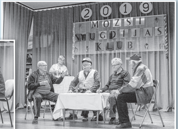
Kocsmai „bölcsesekben” sem volt hiány