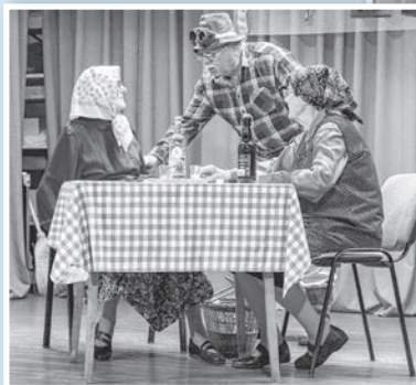
„Juliska és Mariska” jelenete

A konferanszié újra a klub legidősebb tagja, az idén 87 éves Laszlovszky Imre volt, aki nemcsak a műsor-számokat jelentette be, de egy-egy pikáns viccet is előadott. A jelenetek nagyrészt az évek óta megszokott helyzetekben, helyszíneken játszód-tak, de mind új, aktuális tartalommal került színre. A kocsmában kvaterkázó négy férfi egyikétől megtudhat-tuk például, hogy a fröccs igen káros, hiszen a víz még a mosógépet is tönkreteszi. Végül a feleségek is meg-érkeztek, akiket mulatozással egész-tek ki. (Folytatás a 8. oldalon.)