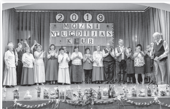
Színpadon az idei farsangi műsor összes közreműködője

Egy „fiatal” házaspár, akik tavaly ünnepelték az 52. házassági évfordulójukat, dalban mondták el egymásnak romantikus érzelmeiket. „Kimondhatatlan boldogság, hogy fogom a kezéd...” Majd kevésbé szívhez szóló érzésekről tudósított a WC VTV riporter, felidézve egy rendszerváltás-korabeli interjút az akkor még öregasszonyos szürke