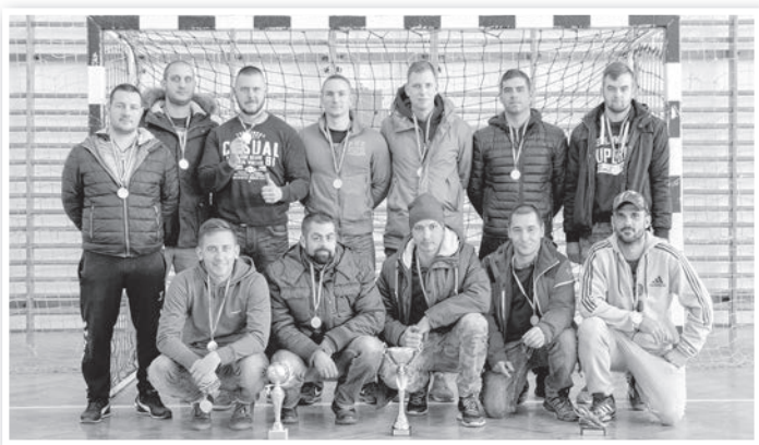
Az A liga győztese, a Kuban Krasnodar

Az A Ligához hasonlóan a Senior Ligában is a tavalyi bajnok nyert, szintén meggyőzőnek mondható fölényrel, bár ebben a csoportban