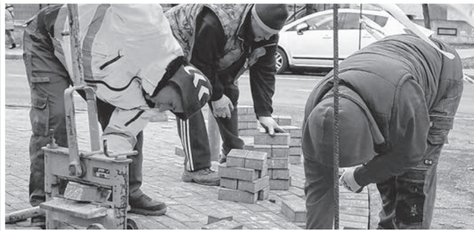
A járdaépítési program is folytatódhat

Négy önkormányzati intézmény (polgármesteri hivatal, intézmény-