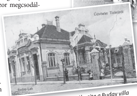
Egykori képeslap Tolnáról, rajta a Buday villa