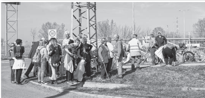
Szemétszedés előtti eligazítás a volt TESCO előtt