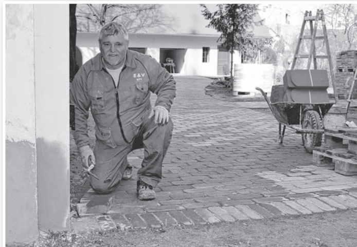
Az utolsó térékő is a helyére került