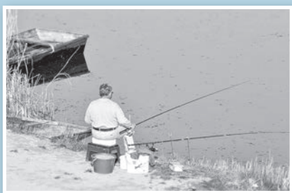
Horgász a Felső-holtágon

kezeli a Felső-holtágat. Tavaly három alkalommal összesen mintegy 102 mázsa háromnyaras pontyot, kb. 2 kilós átlagsúlyban helyeztek ki. 2018-ban 224 darab éves felnőtt jegyet, 12 ifjúsági, 92 gyermekjegyet, valamint 13 heti és 142 darab napi horgászjegyet adtak ki.