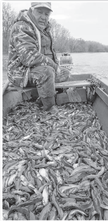
Idén akár egy tonnával gyéríthetik a törpeharcsa állományt az Alsó-holtágon

A Felső-Révhókony területét a Dynamic Kft. üzemelteti. A társaság beszámolója szerint 2018-ban az önkormányzat tulajdonában levő vízparti területeken megtörtént a part rendbetétele, horgászhelyeket alakítottak ki, szemeteszsákokat helyeztek ki, amelyek időközönként cserélnek. A Gemenc Zrt. tulajdonában lévő vízparti területeken horgász helyek kialakítására egyelőre nincs lehetőség. Az elmúlt évben előnevelt süllőből és csukából 1500-1500 darabot, kétnyaras pontyból 2 mázsát telepítettek.