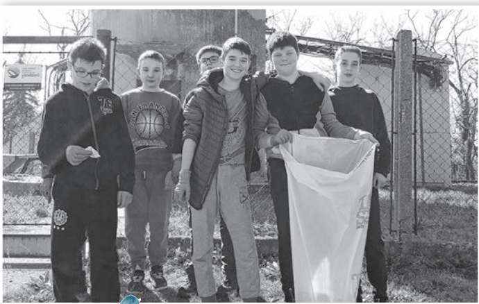
A gyerekek is aktívak voltak

mözsi iskolások tisztították meg Mözs egy részét a szeméttől. 22-én kilenc civil szervezet, továbbá a Széchenyi, a Wosinsky iskola és a gimnázium diákjai, valamint a Pitypang óvoda kisdedjei, szülei és az óvónők munkálkodtak a város hét körzetében. (Folytatás a 2. oldalon.)