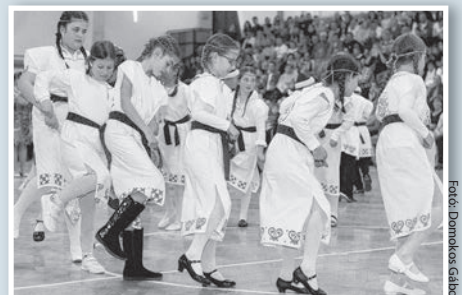
Az iskola minden osztálya fellépett a gálán

Az előadás iránt óriási volt az érdeklődés, a városi sportcsarnok lelátói és a küzdőtér egy része is zsúfolásig megtelt. Mindez érthető is volt, hiszen az iskola valamennyi osztálya fellépett a közel három órás gálán, amelyet – a kívülállók számára is jól érzékelhetően – rendkívül gondos és lelkes felkészülés előzött meg. (Folytatás a 8. oldalon.)