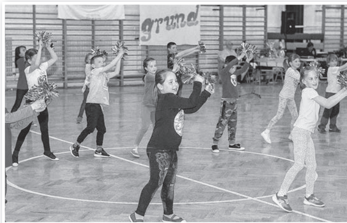
Élvezték a fellépést a szereplők

A hatalmas energiával, odaadással és láthatólag élvezettel előadott maratoni műsorfolyamat a Pál utcai fiúk musical változatának Mi vagyunk a grund dalával foglalták keretbe a rendezők. Az előadás különlegességét többek között az adta, hogy az iskola minden diákja, továbbá a pedagógusok és néhány szülő is közreműködött a közel harminc produkcióban. Az sem megszokott, hogy gyakorlatilag megállás nélkül, közel három órán át zajlott a műsorfolyam. A legtöbb szám táncos produkció volt, de elhangzottak versek, prózák és paródiák is. A végén a csarnok lekapcsolt világítása mellett fény- és árnyjátékon alapuló előadásokat is láthatott a közönség. Számos, kifejezetten ötletes, illetve magas színvonalon