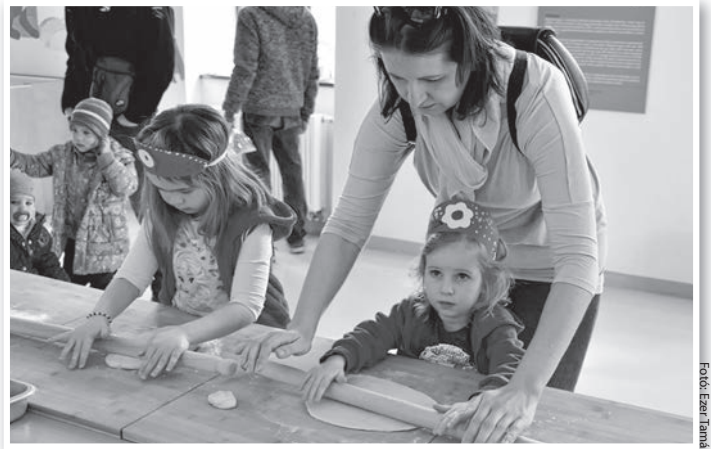
Készülnek a „forradalmi” kiflik a MAG-Házban

beszédet. Az ünnepi szónok feltette a kérdést: mit jelent ma a legnagyobb nemzeti ünnepünk? Sokak számára már csak külsőségekben jelenik meg, de néhány szóról – Nemzeti dal, Pilvax kávéház, Landerer nyomdája, Petőfi Sándor – minden magyar embernek 1848. március 15. jut eszébe, amikor egy maroknyi írástudó 12 pontban megfogalmazta a magyar nemzet kívánalmait. És ezzel elindí-