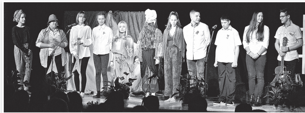
A gimnazisták a Szondi két apródját vitték színre