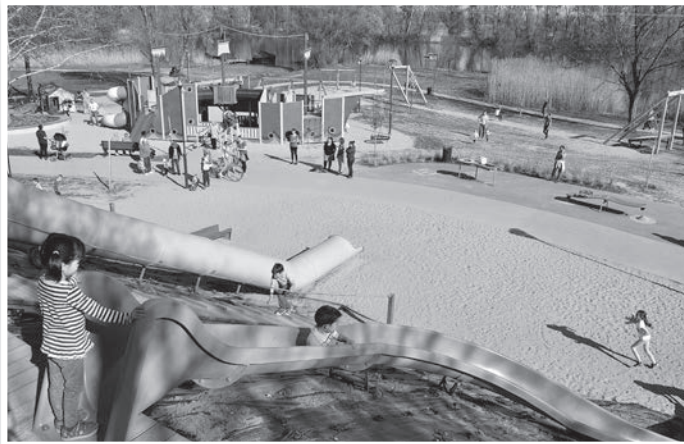
Népszerű a park, megóvása érdekében csak néhány alapvető szabályt kell betartani

A Duna-part természetesen továbbra is nyitott, bárki által, bárkikor látogatható. 27 darab szemetedény van a területen, a környe-