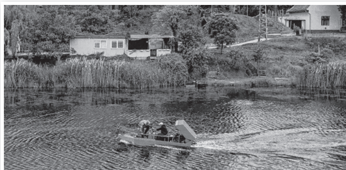
Munkában a hínárvágó gép a tolnai Északi-holtágon

A tervek szerint 2-3 év alatt már érzékelhető lesz a gép munkája, de csak akkor, ha évente többször, még a virágzás előtt tudnak kaszálni. A levágott hínárt viszont nem