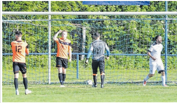
A Bátaszék ellen még sikerült nyerni, Kakasdon viszont meglepetésre kikapott a Tolna

nek kellett volna születnie, ám a Kakasd ezt másképp gondolta. 1-0 után Szili és Erdélyi találatával még fordított a VFC, onnan viszont zsinórban 4 kakasdi gól született. Az