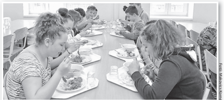
Az új iskolai ebédlő megfelel a mai elvárásoknak

kusan fogalmaz a szigorú táplálkozás-egészségügyi előírásoknak megfelelő menzai ételekről is.