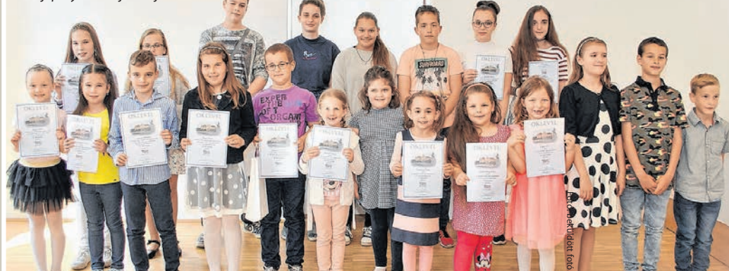
A rajzpályázat díjazottjai

Tolna városá nyilvánításának 30. évfordulója alkalmából gyermekrajz pályázatot hirdetett meg a a Tolnai Kulturális Központ és Könyvtár, bármilyen Tolnához kapcsolódó témakörben. 170 alkotás érkezett a felhívásra. A rajzokat Versegly Ferenc fazekas, a Népművészet Mestere és Laki Erzsébet festőművész zsűrizte. Az alkotásokból rendezett tárlat a város napja alkalmából nyílt meg, június 14-ig volt látható.