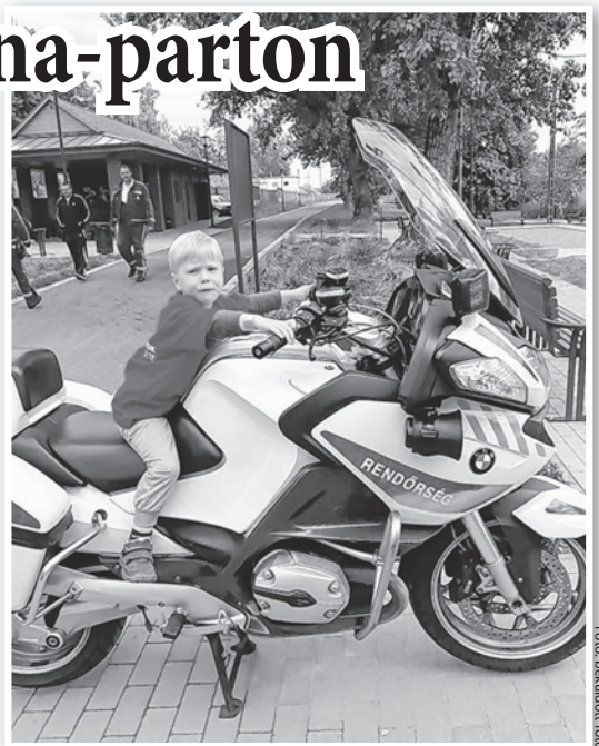
Rendőrmotorra is fel lehetett ülni

különböző bemutatókat tartsanak fiataloknak és idősebbeknek. Így lehetett például ujjlenyomatot készíteni, fémkereső detektorral „kincset” keresni, rendőrmotorra ülni, vagy rendőrautóba beszállni. A kicsit még hűvös időjárás miatt a habpart elmaradt, de volt helyette más izgalmas elfoglaltság, például lovaskocsizni is lehetett a városban. A programban szerepelt még zenés bemelegítés, családi sor- és váltóversenyek, ugrálóvár, csillámtetoválás, lufihajtogatás, kézműves foglalkozás is, szinte mindegyik valamilyen felajánlás révén. A családi nap mintegy száz résztvevője éhes sem maradt, ebédre pörköltet főztek, a gyerekek pedig ajándékot is hazavihettek.