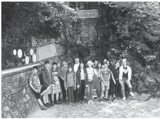
A 7. b osztály az Abaligeti Cseppkőbarlang előtt

sával kapcsolatban, A barlangtúra során megcsodálhatták a barlang belső terét. Ezután egy kb. 5 km-es gyalogtúra és szabadprogram következett.