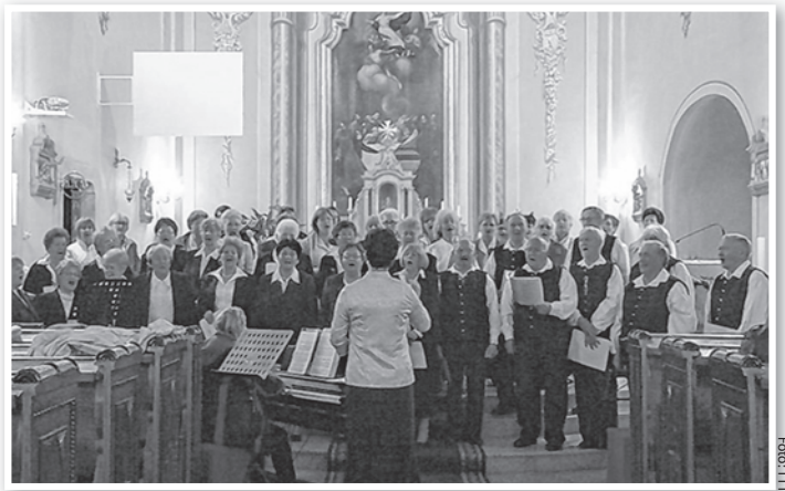
A tolnai és a palicsi kórus együtt is énekelt