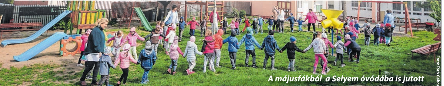
A májusfából a Selyem óvodába is jutott

Eddig a történet, amihez mi már csak annyit tennénk hozzá: az ügylet legnagyobb érdeme talán az, hogy mindez nem internetes virtuális játék volt, hanem igazi kaland, csapatmunka a sötét éjszakában, egy erdő szélén. Ami után mindezt még csákánnyal, ásóval és lapáttal be is kellett fejezni a lányos ház előtt. És amit dobogó szívvel – vajon ki hozza ezt? –nem okostelefonon, hanem a függöny mögül, az ablakból „lájkoltak” a hálás lányok. ká