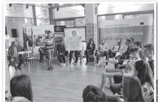
A gimnazisták jutalomként kapták a kirándulást

Csoportfoglalkozásra is sor került. A diákoknak méréseket kellett végezniük és feladatokat megoldaniuk. Vízmintákat gyűjtöttek, és kiértékeltek azokat. A továbbiakban pedig játékos