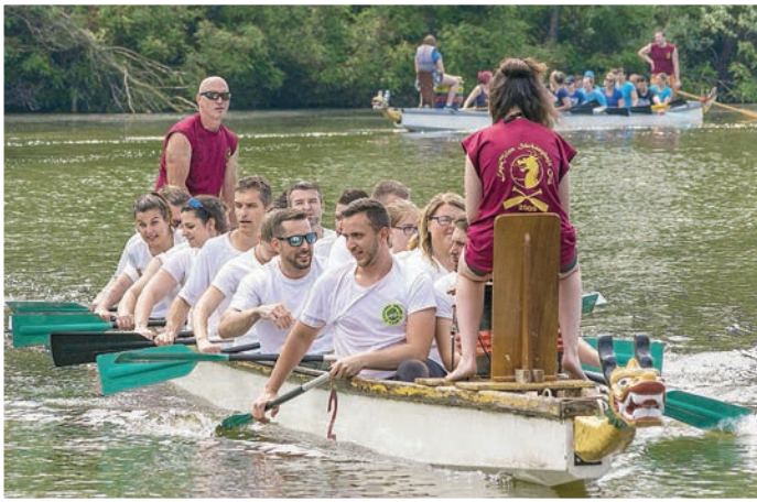
A Fastron Dragon Team nyerte a sárkányhajó versenyt