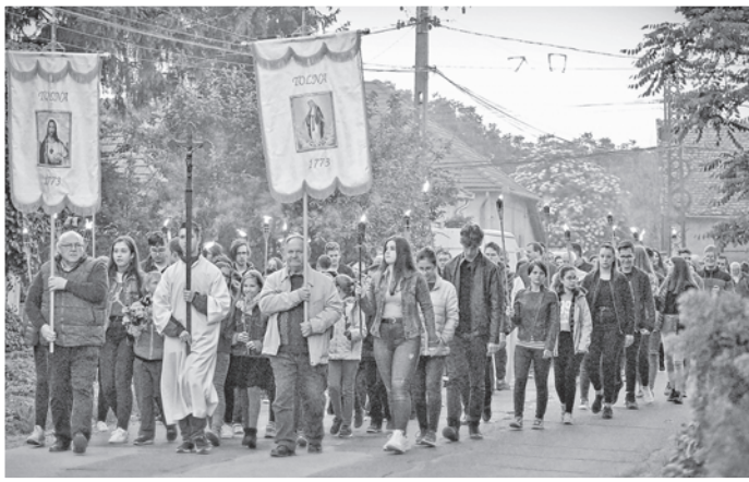
Vonul a fáklyás menet a Duna-part felé