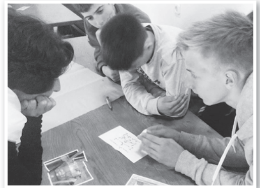
Csoportmunkában a 7. a osztályosok

Európai Parlamenti választásokra buzdító kisfilmet kellett forgatni, kiemelten az első választásokra készülő fiatalokra fókuszálva. A május 22-én lezajlott kiránduláson az Európai Bizottság Magyarországi Képviselétén egy színvonalas, interaktív ismertetővel kezdődött