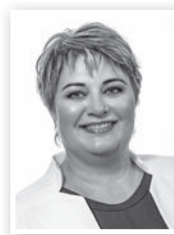
APPELSHOFFER ÁGNES (FIDESZ-KDNP)

13 éve a körzet képviselője, 5 éve Tolna polgármestere vagyok. Az elmúlt öt évben nagyobb hangsúlyt kaptak a város egészségét – iskolák, óvodák, uszoda, Duna-part, játszótér, civil házak, játszóterek – érintő fejlesztések, és sajnos kevesebb forrás jutott a körzetek csapadékvíz elvezetés- és útproblémáinak a javítására. A jövőben ezek megoldása is meg fog kezdődni. Folytatjuk a Deák Ferenc utca járdájának a felújítását is. Az önerős járdaépítés sikeres volt az elmúlt években, ezt a közös munkát a továbbiakban kiszélesítjük.