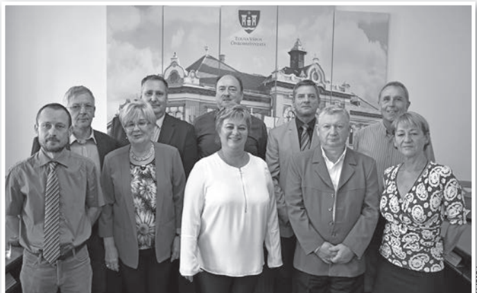
Az utolsó ülésen részt vett testületi tagok

■ Két újabb kérelem érkezett szennyvízcsatorna közműfejlesztések hozzájárulási díjának megállapí-