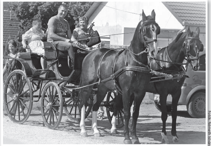
Szülinapi kívánságai közül a lovashintó is teljesült

Hát ebben a családban lett 40 éves Terike. És ha az lett, ezt most meg is szerette volna ünnepelni. – Lesz még ilyen szép kerek évfordulónk,