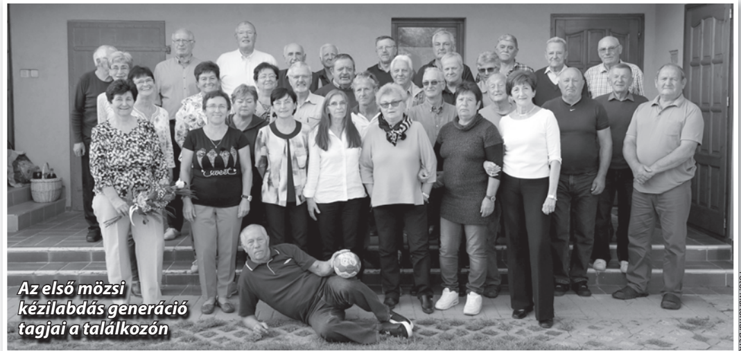
Az első mözsi kézilabdás generáció tagjai a találkozón

Nem csak a sportág szeretetét tanulták meg