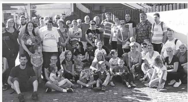
A csapat egy része Szentendrén

A tolnaiak az éjszakát a Papszigeti kempingben töltötték, a másnapi közös reggeli után szentendrei, majd budapesti városnézés szerepelt a programjukban. Hazafelé megálltak fagyizni a dunaföldvári cukrászdánál, ahol az idei ország tortáját is megkóstolták.