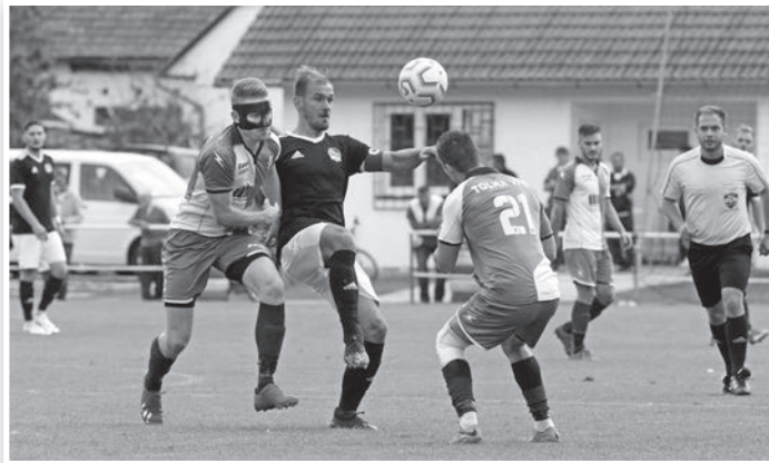
A tolnaiaknak nem sikerült legyűrniük a Kakasd együttesét

Kevesen gondolták, hogy a hatodik percben szerzett teveli találat eldönti a mérkőzést, az eredmény azonban ezután már nem változott. A tolnaiak – különösen a második féldőben – nagy nyomást helyeztek a hazai kapura, ám a