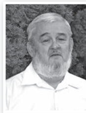
PÁSZTOR TAMÁS (Tolna Városért Egyesület, Mindenki Magyarországa Mozgalom támogatásával)

13 éve a körzet képviselője, 5 éve Tolna polgármestere vagyok. Az elmúlt öt évben nagyobb hangsúlyt kaptak a város egészségét – iskolák, óvodák, uszoda, Duna-part, játszótér, civil házak, játszóterek – érintő fejlesztések, és sajnos kevesebb forrás jutott a körzetek csapadékvíz elvezetés- és útproblémáinak a javítására. A jövőben ezek megoldása is meg fog kezdődni. Folytatjuk a Deák Ferenc utca járdájának a felújítását is. Az önerős járdaépítés sikeres volt az elmúlt években, ezt a közös munkát a továbbiakban kiszélesítjük.