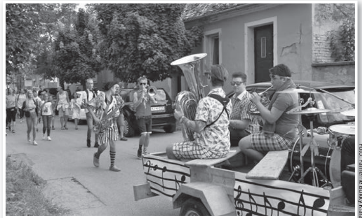
A Humen fiataljai is hozzájárultak a fesztivál sikeréhez

Az eső miatt nem csak a főzés, hanem a délutáni-esti programok is fedél alá, a Lovardába kényszerültek. Ez viszont egyáltalán nem jelentett problémát. Mi több, igazi fesztiváli forogtag zajlott a csarnokban, ahol a gyerekek és a nyugdíjasok is rendkívül jól érezték magukat. Egyebek mellett volt interaktív civil színház, kézműves sör- és borkóstoló, játékos célú kürtöskalács vásár, katonai toborzó, „Police Coffee”, ugrálóvár, arcfestés, smink- és frizurakészítés. Bemutakozott az Esőmanók Egyesület és a Magyar Női Unió.