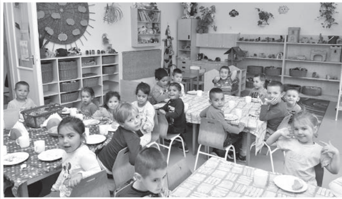
Aprajafalván is jó körülmények fogadják a kicsiket

Az Aprajafalva ovi épülete két éve külső szigetelést és tetőszigetelést kapott, valamint a nyílászárókat is kicserélték. Most, a második ütemben a gyerekek és a felnőttek vizesblokkjait újították fel és korszerűsítették.