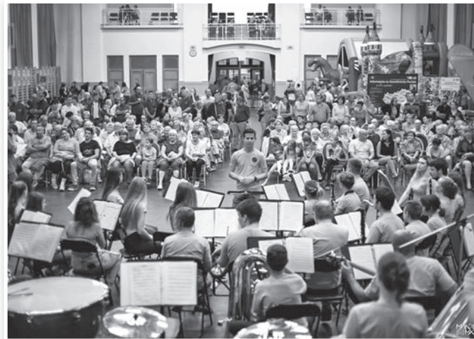
Fedél alatt is nagyszerű volt a hangulat

Ampervadászok gárdája, harmadik pedig a Másnaposok.