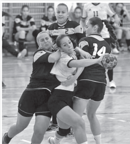
Tülerőben volt a PEAC a tolnai szezonnyitón