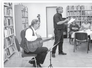
Nem volt hiány vidám pillanatokban sem

A címben foglalt idézet, amely Garay János: Szegzárdi bordalának (1846) első sorát zárja, senkit ne tévesszen meg, az elhangzott költe-