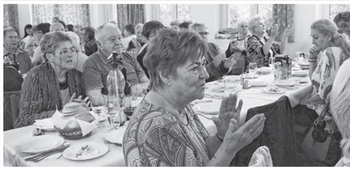
Az idei textiles találkozón közel hetvenen vettek részt

folyt. Munkásjáratok hozták az embereket a környező településekről. A rendszerváltáskor azonban szinte az egész magyar textilipar tönkrement. A Pamuttextil Művek nyolc gyáregységénél (négy fővárosi, négy vidéki) körülbelül öt-hatezer ember veszítette el állását. Legtovább a tolnai üzem húzta, ezt 1991-ben zárták be.