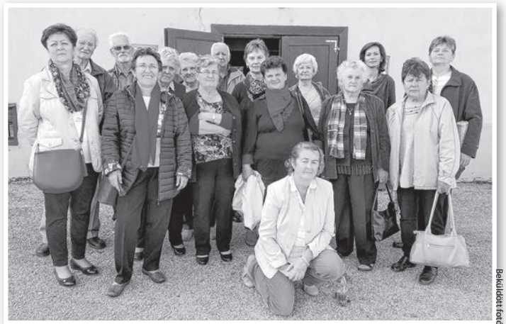
A mözsi német klub csapata a fellépés előtt

A program a Bethlen Gábor Alapkezelő Zrt Nemz-Cisz-19-0030 sz. támogatásából valósult meg.