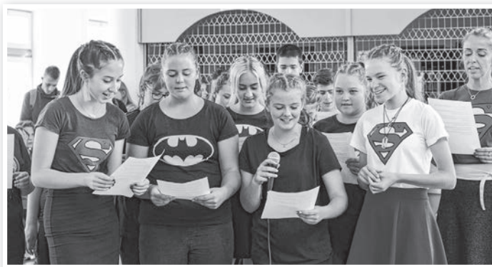
A szuperhősök a gimiben is odatették magukat

két osztály közötti verseny kinek a javára dől el. A 10 programpontról álló műsorban többek között az előre elkészített tánc és dicsőítő ének bemutatása szerepelt, de volt