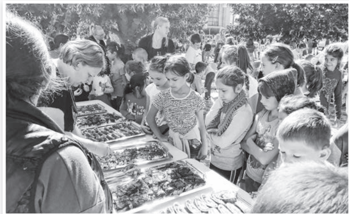
Sváb süteményeket kóstolnak az alsó tagozatos diákok

További információk az iskoláról az intézmény honlapján: tolnaigimi.hu