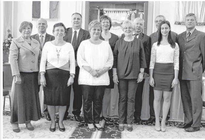
Az új képviselő-testület tagjai

nyéről is. A polgármester illetménye – a törvény által meghatározott összeg – havi bruttó 698 ezer forint, költségterítése ennek 15%-a, havi 104.700 forint. Az alpolgármester