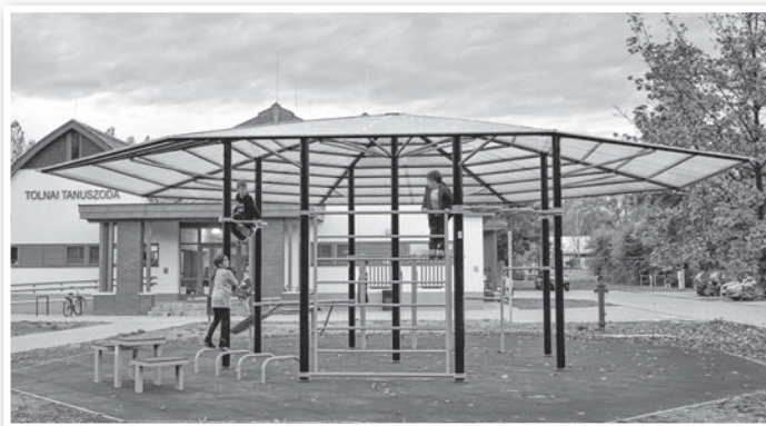
Minden korosztály használhatja a sportparkot

A létesítmény használatával kapcsolatos részletes útmutató, illetve edzésterv a város honlapján, a www.tolna.hu oldalon olvasható.