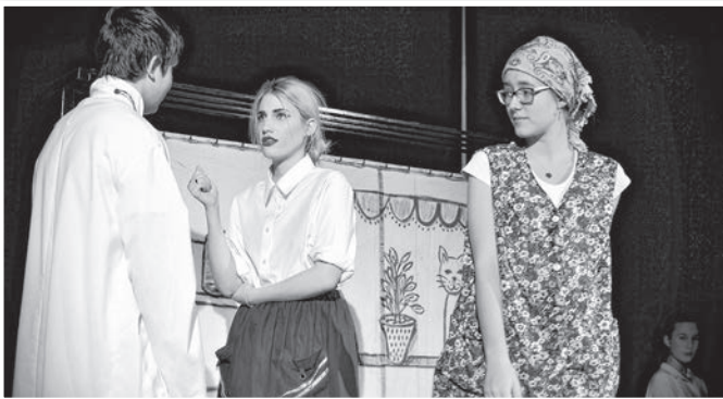
Részlet a diákok előadásából

Az ünnepség után a Hősök terén, az 56-os emlékműnél zajlott a koszorúzás, önkormányzati, állami, párt-, valamint civil szervezetek képviselőinek közreműködésével.