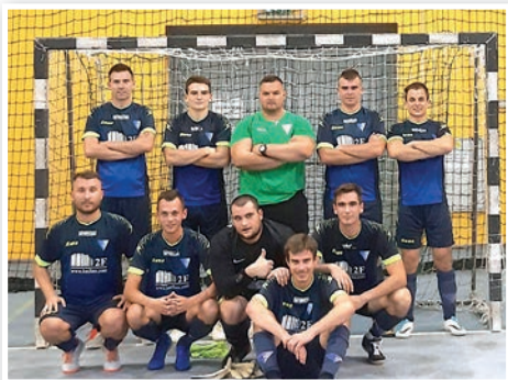
A Tolna VFC futsal csapata

A tolnaiak a harmadik pozícióból várhatják a tavaszt, 18 pontot gyűjtve, +22-es gólkülönbséggel.