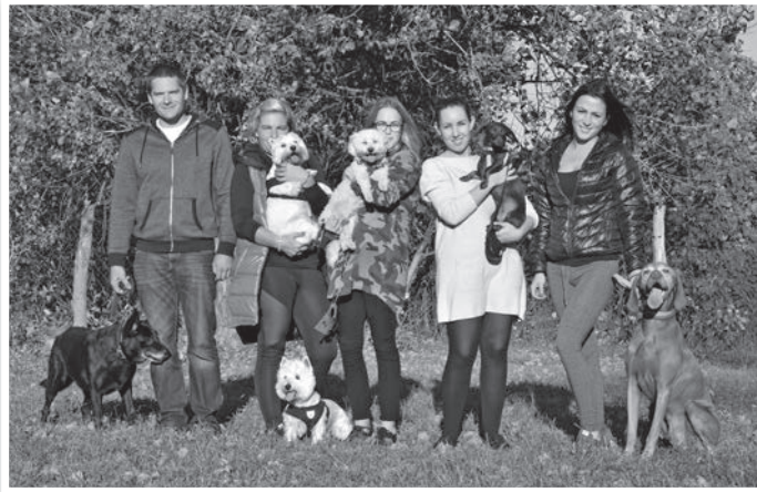
Már több mint száz állatot sikerült visszajuttatniuk a gazdájához

szer egyszerű: ha valaki, valahol felfigyel egy elkóborolt állatra, és erről értesít minket, mi rövid időn belül, saját chip olvasónkkal meg tudjuk nézni, hogy van-e chip az állatban. Ez azonban ekkor még csak egy kód, amiből, az ezzel a hatáskörrel rendelkező állatorvos segíti a házi kedvenct hazajutni. Ha ilyen nincs, akkor fotó készül