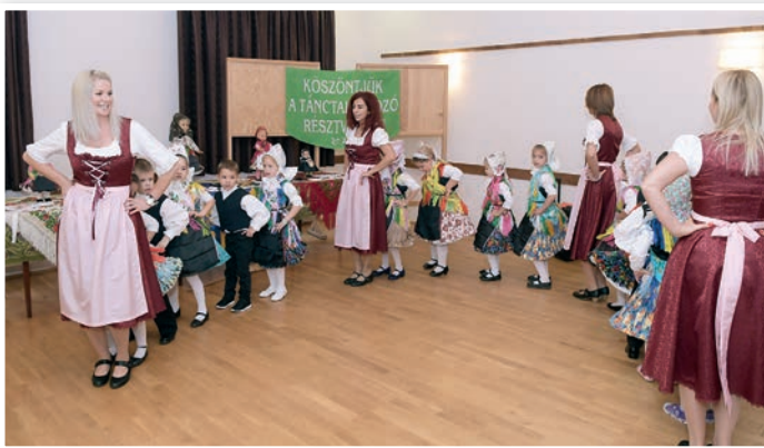
A mözsi óvodások színpompás, szívmengető produkciója

Itt azonban nem ért véget a mulatság, ezután kezdődött az évről évre megrendezett lámpás felvonulás, amiben mintegy kétszáz – gyerekek, felnőttek egyaránt – vett részt. A Szentháromság szobor megkerülése után az óvoda udvarába érkeztek, ahol libazsíros kenyérrel, teával és kaláccsal vendégelték meg őket. K.E.