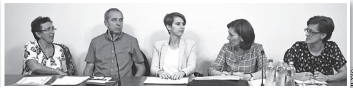
A német önkormányzat tagjai az alakuló ülésen

Az elképzelések között szerepel az is, hogy a nemzetiségi önkormányzat kitüntető díjat alapít. A „Németségért” elismerést három kategóriában (civil szervezet, diák, pedagógus) adnák át az arra méltó jelölteknek, minden évben, az őszi nemzetiségi napon.