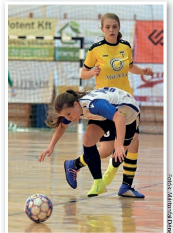
Bravúrponthoz mellett olykor botlás is jellemezte az idei őszt

A tolnaiak 9 forduló után a 4. helyen álltak a tabellán, 14 pontot szerezve, +6-os gólkülönbséggel.