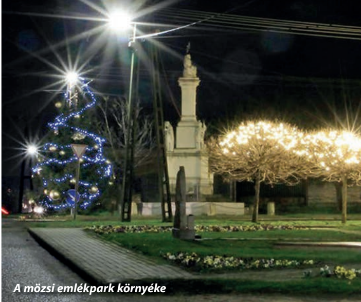
A mözsi emlékpark környéke