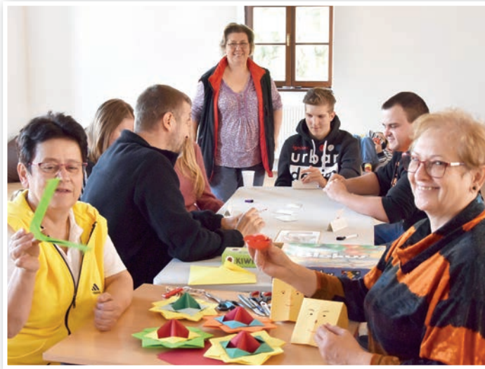
A közös munka és a játékok is jókedvre derítették a társaságot