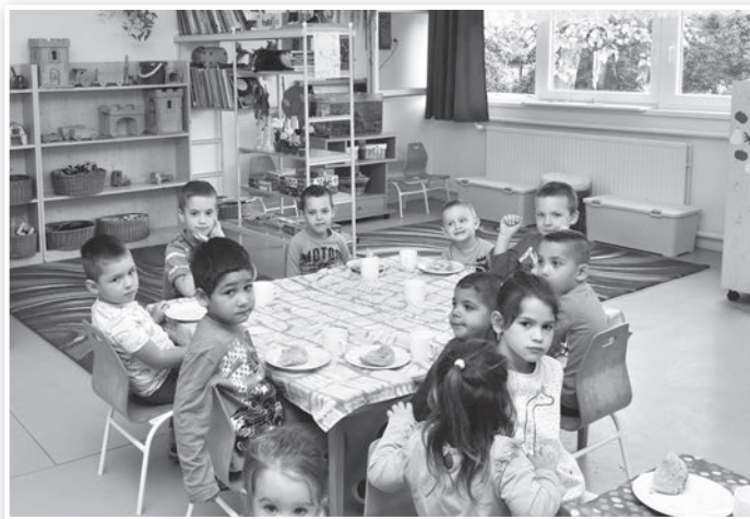
Tolnán az Aprajafalva óvoda felújításának második üteme is a JETA támogatásával valósult meg

térségi és települési szolgáltatási infrastruktúra-fejlesztésre irányuló projektek. A Miniszterelnökség pozitív döntése után tette közzé önkormányzatok számára kiírt pályázatát az alapítvány. Az első fordulóban a kuratóriumhoz 155 pályázat érkezett, amelyből 139