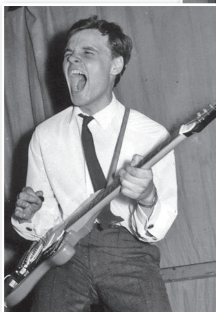
A Scampolo gitárosaként, a hatvanas évek elején

Először autószerelőként, majd karosszériásként dolgozott. De ebben a környezetben is sikerült megismerkednie zenészekkel.