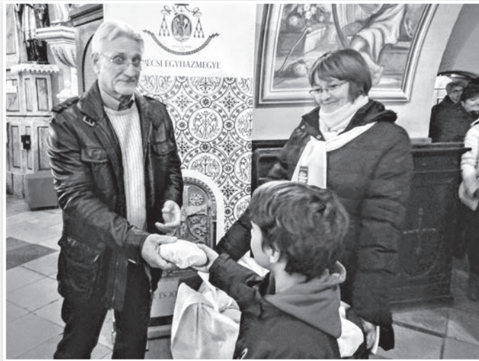
Az evangélium üzenete kicsiknek és nagyoknak is szól

A fenti evangéliumi részlet is elhangzott azon az ünnepi szentmisén, amit Szent Erzsébet ünnepe előtt pár nappal, november 16-án, szombaton este tartottak a tolnai templomban. És ami egyben, immár hagyományosan, a tolnai katolikus karitász csoport éves seregszemléje is. Az ünnepi istentiszteletet Ravasz Csaba plébános mutatta be a templom első padsoarait megtöltő önkéntes aktivisták előtt. Ez az alkalom szolgál ugyanis a már korábban felavatott tagok fogadalmátételének megújítására,