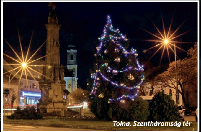
Tolna, Szentháromság tér