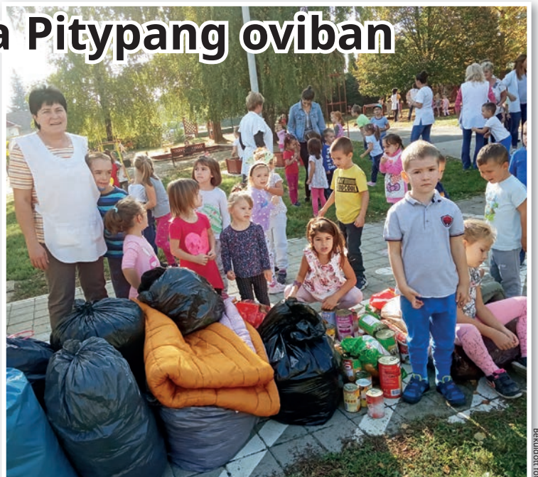
Sok adomány gyűlt össze az elárvult kutyák számára

Az állatok világnapjához kapcsolódó programként az óvónők A három kecskegida és a farkas című bábelőadással kedveskedtek a gyerekeknek. A témakör feldolgozásának lezárásaként az óvodások munkáiból kiállítást rendeztek.