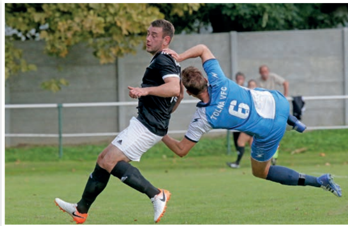
Eldölt: a bajnokság félidejében a 6. hely jutott a Tolnának

Továbbra is tart a Dombóvár elleni rossz széria. A vezetést – az utóbbi egymás elleni mérkőzésekhez hasonlóan – ismét a tolnaiaknak sikerült megszerezni, ám az utolsó 10 percben fordítottak a hazaiak. A győztes találat a 94. percben érkezett, ami után a játékevezető le is fújta a találkozót.