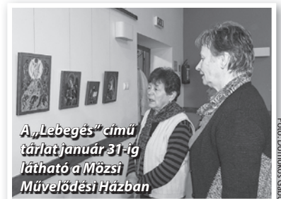
A „Lebegés” című tárlat január 31-ig látható a Mözsi Művelődési Házban