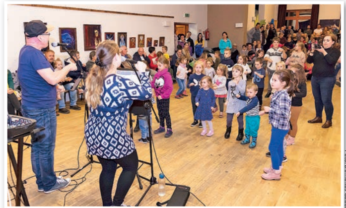
Jól sikerült a Márton-napi mulatság

Márton pap a ludak óljába bújt püspökké választása elől, a mözsi Zöldkert Óvoda viszont nem rejtette véka alá az immár huszadik Márton-napi rendezvényét.