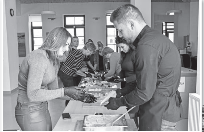
Készülnek a vegán desszertek

Nevelési tanácsok, csokikészítés, kóstoló, tánc, ismeretterjesztés