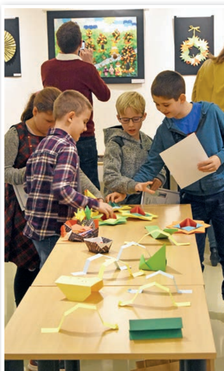
A kiállítás megnyitón a hajtogatott játékokat is ki lehetett próbálni

Mivel elég sokan gyűltek össze a hétvégén, nemcsak a társas-, de a társasági játékok is előkerültek, mint a „Csapkodó”, vagy a székfoglaló. Még néhány ezekhez hasonló játék is szolgált, hogy az origami hétvége résztvevői kilépjenek megszokott környezetükből, és lazítsanak. Emellett origami-figurákkal és -díszekkel is gazdagodtak.