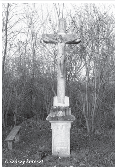
A Szászy kereszt