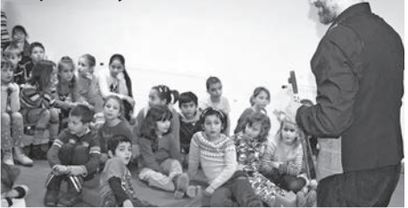
Tolnai gyerekek előtt is fellépett tavaly

1980-ban született Pécsen. Nagycsaládban nőtt fel, három nővére és egy bátyja van. A Nagy Lajos Gimnáziumban érettségizett 1998-ban. Azt követően a PTE magyar szakára járt, de nem fejezte be. Némi útkeresés után, 2004-ben a Bóbita Bábszínházban kezdett dolgozni, s közben, 2006-ban megszerezte a bábszínész végzettséget a Magyar Művelődési Intézetben. Tíz évet töltött a Bóbitánál, majd 2014-ben a szekszárdi Német Színházhoz szerződött. Ugyanabban az évben házasodott meg, feleségével Tolnára költözött; egy gyermekük van.