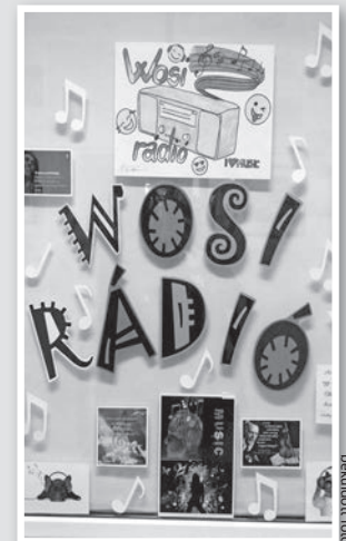
A „rádióstúdió” vidám külseje is elkészült

Ez volt az iskolarádió első adása. Azóta már hetente háromszor: hétfőn, szerdán és pénteken is – az első két szünetben – hallható műsor, amelynek készítésében a diákok is részt vesznek. Minden adást más-más osztály állít össze, amennyiben szükséges, tanári segítséggel. Az első szü-