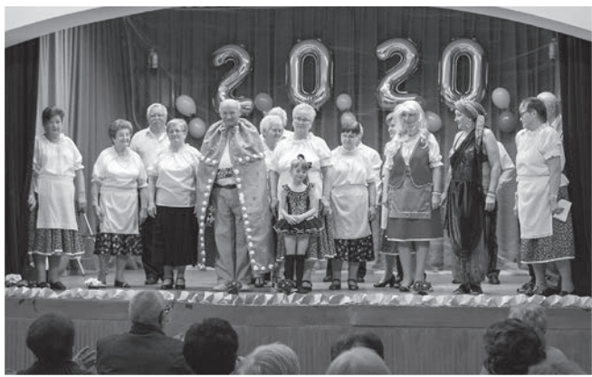
Ismét kitett magáért a társulat