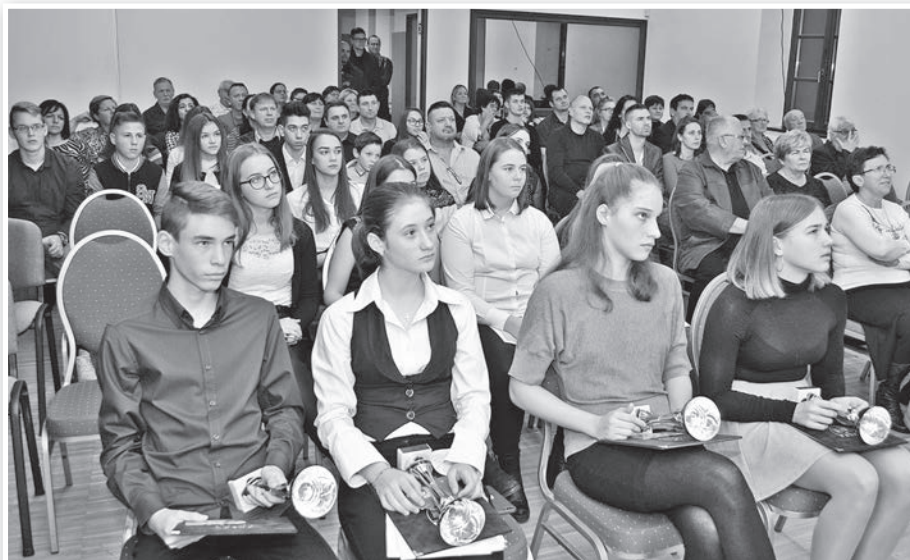
Sportolók, edzők, szülők a tavaly decemberi városi sportünnepeken

Februári ülésén elfogadta a képviselő-testület a város által kiemelten támogatott sportegyesületek 2019-es beszámolóját. Emellett döntöttek az idei sporttámogatásokról is. Eszerint idén 15 millió forint áll rendelkezésre a költségvetésben a helyi sport támogatására. Ez bő másfél milliával több, mint a korábbi években.