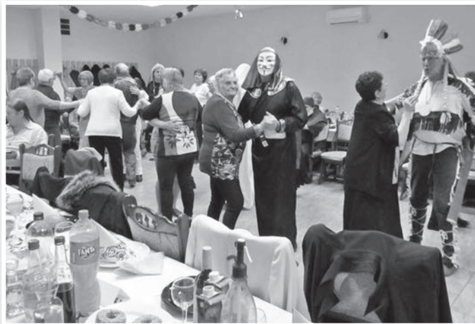
Tizenhatan öltöztek jelmezt

www.halotalapitvany.atw.hu Adószám: 18865543-1-17