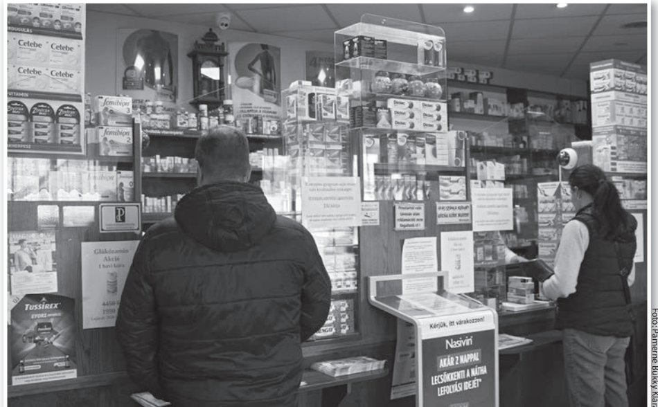
Februári életkép a Tilia Patikából