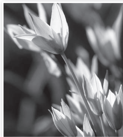
Korai törpetulipánok a Merczel kertben

Az idei március valószínűleg nem a forradalmi lendületről, a kirobbanó energiákról, az önfelédelt lelkesedésről lesz emlékezetes számunkra. Ám, ha jóval visszafogottabban is, az idei március is magán hordozta a koratavas gyönyörű, vagy meghökkentő jegyeit. Az alábbi fotók – Pámerné Bükky Klára és Czakó Balázs alkotásai – ezekből adnak némi ízelítőt.