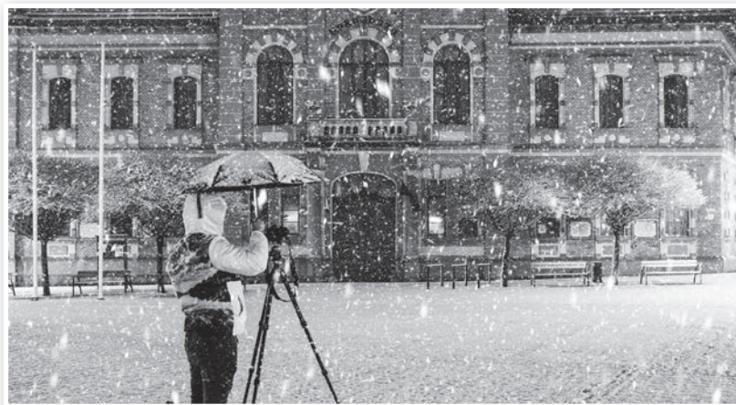
Erős havazás március 23-án kora este Tolnán (Hősök tere)