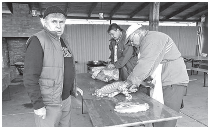
Sváb szokás szerint dolgozták fel a 160 kilós disznót

akik az idén tizennyolcadik alkalommal fogtak hozzá hagyományőrző disznóvágásukhoz. Az eseményre február 29-én került sor, a Napraforgó utcai Rohr vendégházban, ahol a nap eredményeit lemeózni, este negyvenen ültek asztalhoz. Az együttlételet megtisztelte jelenlétével Krémer György, a