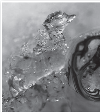
Kora tavaszi „jégmadár”