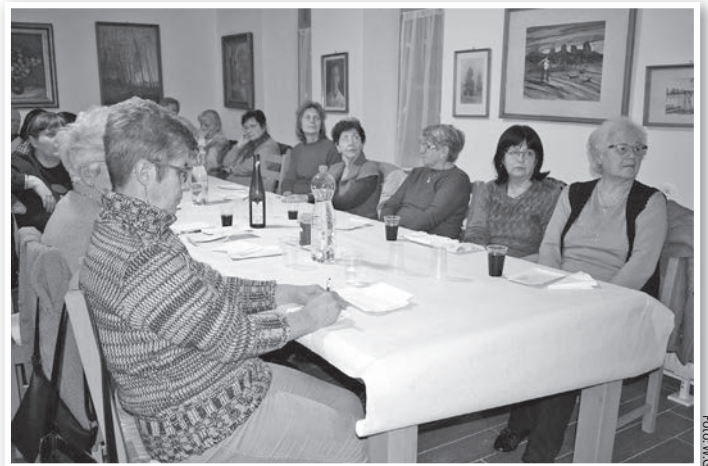
Az új tolnai civil házban zajlott a kögyűlés

A közgyűlés további részében tagsági kérdésekkel foglalkoztak. Az egybegyűlték szomorúan vették tudomásul néhány lelkes tagjuknak időközbeni elhalálását, illetve elköltözését, ugyanakkor örömmel üdvözölték azokat, akiket ezen a közgyűlésen emelt tagjaivá a szervezet. Ők ötven voltak: Fehér-