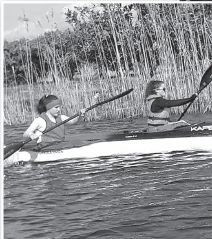
Kilométergyűjtés a Neretva-holtágon

Időközben a járvány elleni védekezés érdekében a tolnai polgármester március 16-tól elrendelte min-