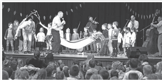
Interaktívan ismertették meg a népzene, a gyerekekkel