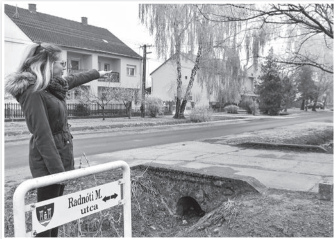
A Radnóti utca, amelynek egyik oldala Tolnához, a másik Mözshöz tartozik

Appelshoffer Ágnes polgármester a beérkezett visszajelzések alapján úgy látja: a helyzet egyértelmű, az érintettek igen nagy többsége nem támogatja a névváltoztatást. A lakosság véleménye pedig megegyezik a városvezetésével. Bízunk benne, hogy ez a téma immár végérvényesen lekerül a napirendről. Ő is felhívta a figyelmet arra, hogy az olykor felmerülő problémákat az irányítószámok pontos feltüntetésével, használatával el lehet kerülni.