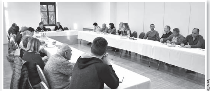
Közel húsz szervezet képviselői jelentek meg

A civil találkozón főként az immár sok éve, akár több évtizede működő, éltebb korú tagsággal