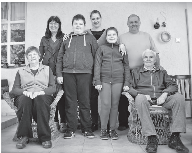
Négy generáció együtt