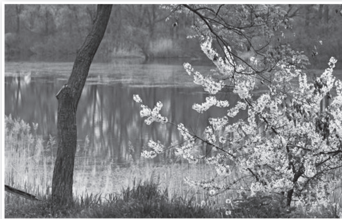
Virágzó fa a Duna-parton