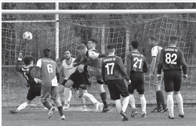
Fotó 2019 tavaszáról. Egy évvel ezelőtt nem kellett elhalasztani a Tolna-Kakasd meccset, akkor a VFC 3-2-re nyert

16 fordulót követően a tolnaiak a hatodik pozíciót foglalják el a tabellán. A Tolna VFC ez idáig 17 pontot gyűjtött, 31 rúgott és 25 kapott góllal.