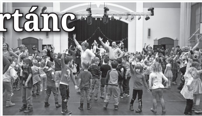
Táncos-zenés kavalkád a Lovardában

A „Tavaszi tündértánc” Tolna Város Önkormányzatának a „Helyi közösség-szervezési tevékenységek támogatása Tolnán” című projektjének TOP-7.1.1-16-H-041-2 azonosítószámú felhívásán elnyert támogatásból valósult meg.