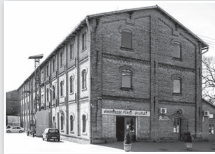
A gubóraktár ma élelmiszerboltként működik

Bezerédj Pál a selyemgyár mellé természetesen gubóraktárat is épített annak idején. Ilyen raktárból 18 épült a történelmi Magyarország területén. Ezekből egy maradt épségben és viszonylag a régi állapotában: a tolnai.