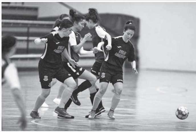
De hol a labda? – pillanatkép a Tolna-Mözs–Gyula mérkőzésről