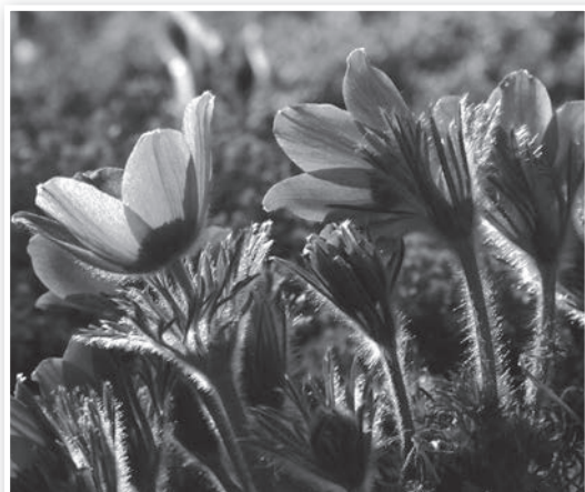
Kökörcsin a Merczel kertben