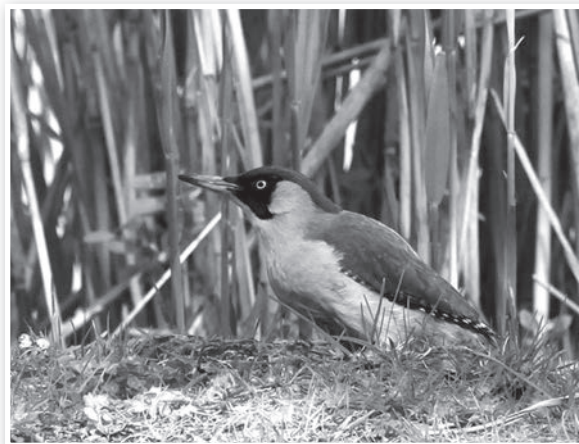
Zöldküllő a nádas előtt