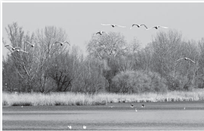
Magasan szálló hattyú csapat a tolnai Holt-Dunán