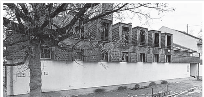
Eladó az egykori művelődési ház és könyvtár