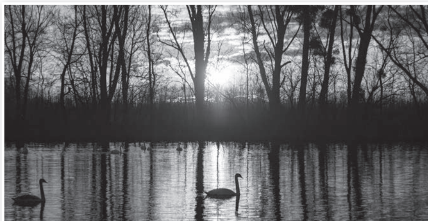
Hajnali hattyúk a tolnai holtágon