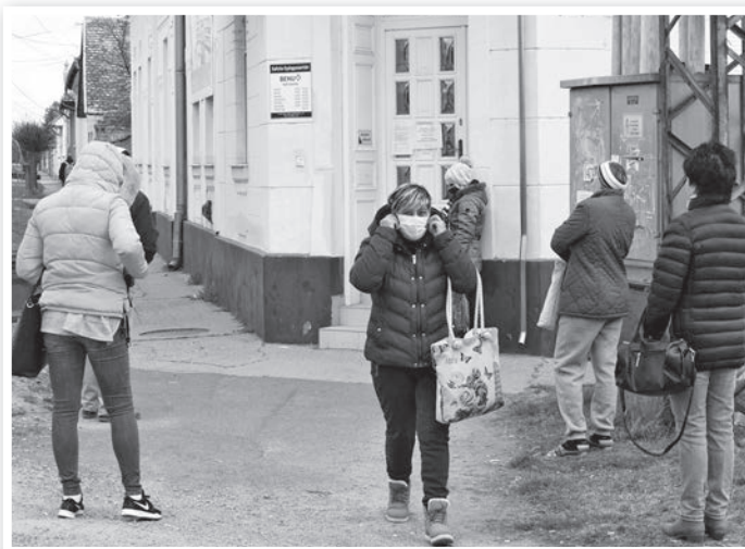
Sorban állás az egyik tolnai patikánál; csak akkor lehet bemenni, ha valaki kijött