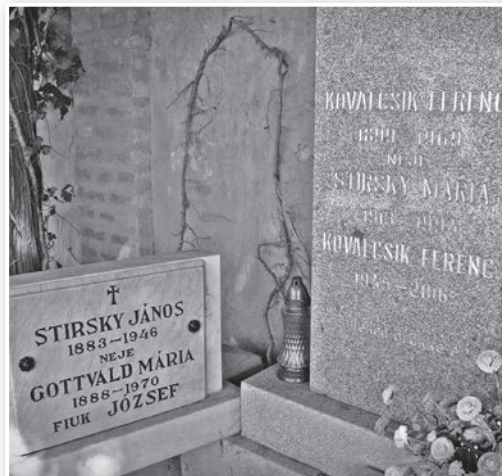
A családi síremlék a tolnai temetőben

– Édesapám kiváló vendéglátós volt – így Györgyi –, az ő keze alatt virágzott fel a hely. Itt minden a legkorszerűbb és a legmagasabb minőségű volt. Az első vendéglő volt Tolnában, ahol már nem jégveremből felhordott jéggel hűtöttek. Tolna legjobb cigányzenekara muzsikált itt, rendszeresek voltak a bálók és táncmulatságok. Hát ezt a