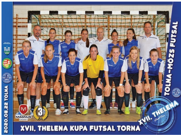
Tolna-Mözs csapatfotó az idei Thelena Kupáról