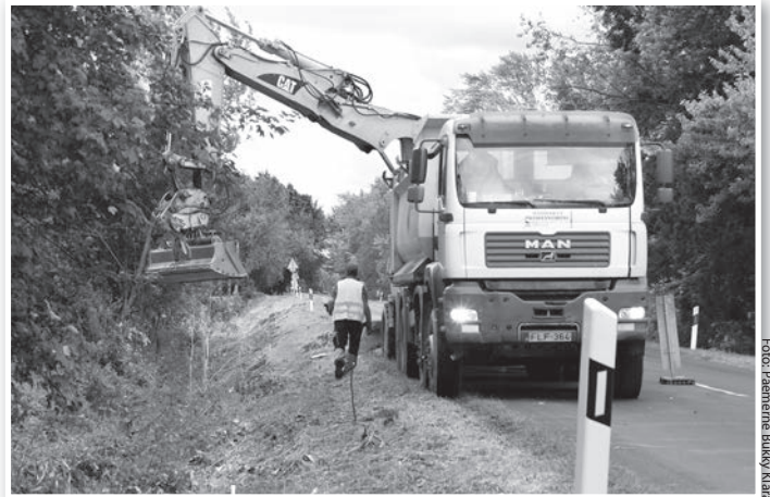
Alakítják a kerékpárút nyomvonalát Tolna és Fadd között

A 6,9 kilométeres bicikliút Tolna keleti határától indul Fadd felé, a közút jobb oldalán építendő féltől-tésen. A Fadd-Dombori kereszteződés után rátér a Bartal emlékmű felé vezető földútra, majd elérve a faddi holtágat, kétfelé ágazik: Faddot a Tokaj utcánál, Domborit a Donautica Hotelnél éri el.