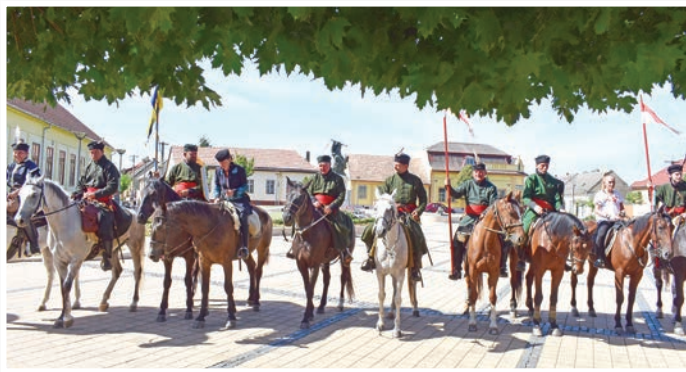
A lovas záródoklat résztvevői a Hősök terén