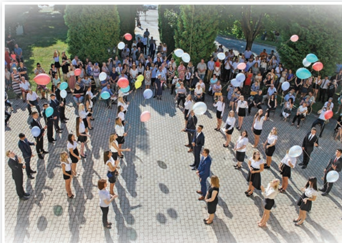
Az újtukra engedett léggömbök idén is a ballagás fontos szimbólumai voltak

Nándor adták elő gitárkísérettel A Pál utcai fiúk musicalből a Mi vagyunk a grund című számot,