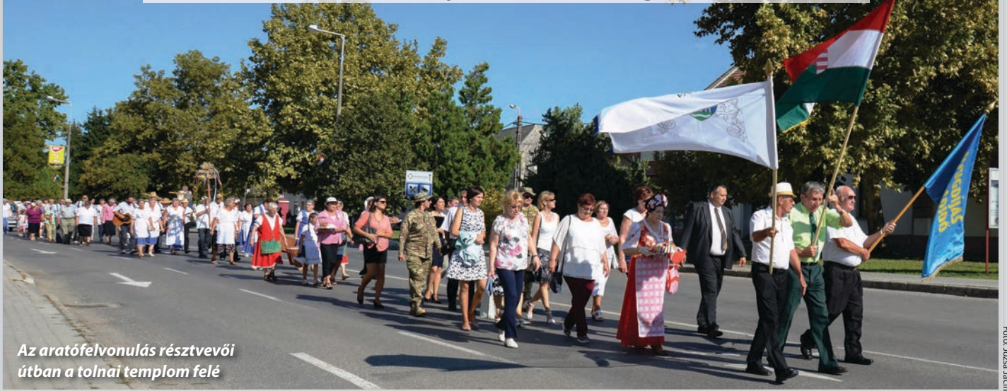
Az aratófelvonulás résztvevői útban a tolnai templom felé

Aratófelvonulás, kenyérszentelés augusztus 20-án