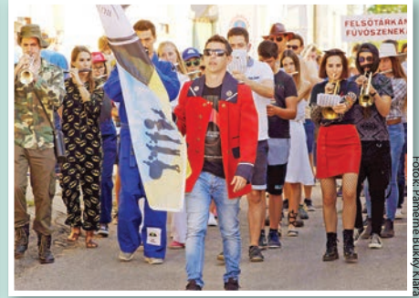
Indul a felvonulás a Duna-partról

Kivágták a rezet a Brass Vegas Fesztiválon