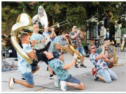
A BrassTime elvárásolta a közönséget