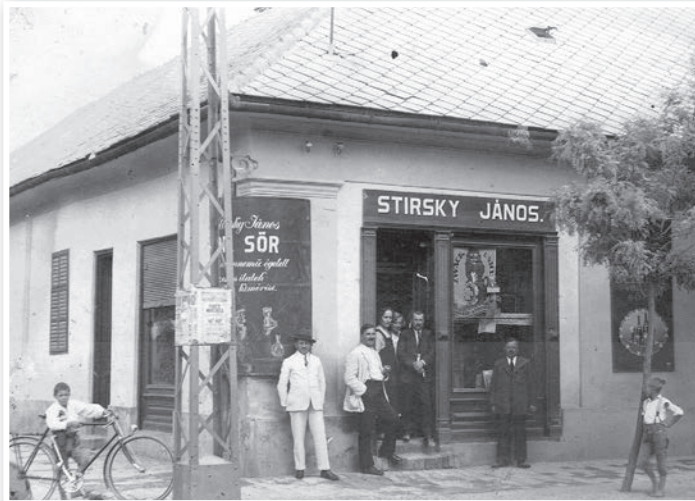
A vendéglő 100 évvel ezelőtt