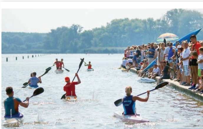
Óriási mezőny gyűlt össze a Vidékbajnokságra Domboriban

A Tolna VFC két forduló után a 8. helyen állt.