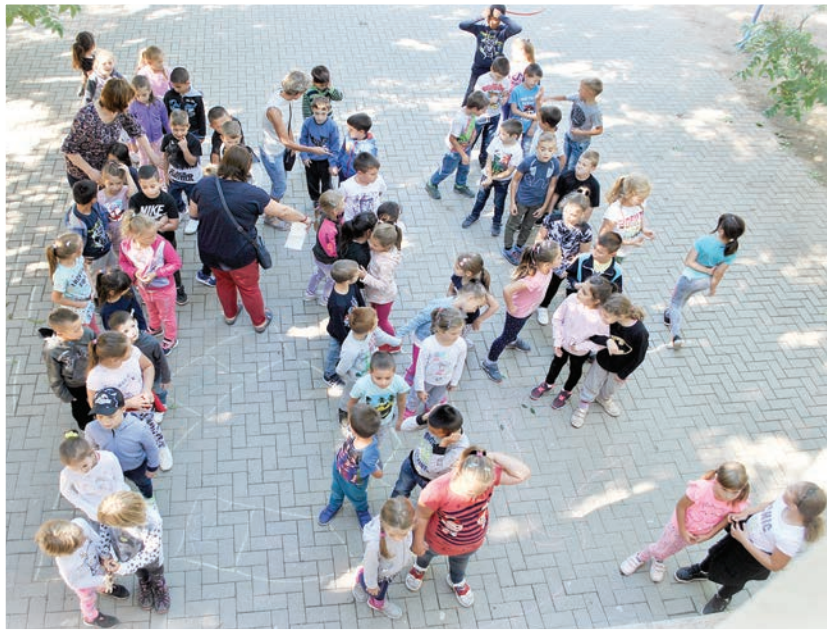
Újra birtokba vették a diákok a Széchenyi iskola alsó tagozatát is