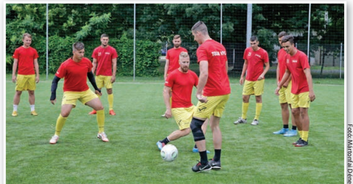
Egy kép a felkészülési időszakból: szorgalmasan edzett a gárda