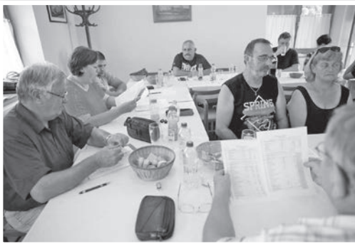
Vizsga után zajlott az idei polgárőr közgyűlés

A polgárőrök gyakorlatilag az összes városi rendezvény biztosításában részt vesznek és a gyerekek közlekedésbiztonsági képzésében is közreműködnek.