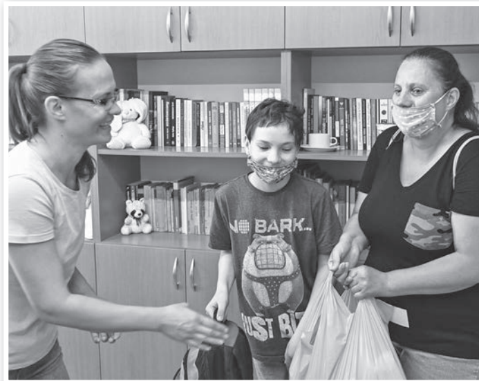
Jól jött a segítség sok családnak a tanévkészítés előtt

CSALÁDSEGÍTŐ KÖZPONT 7130 Tolna, Bajcsy-Zs. u. 96. Telefon: 74/443-825, 74/540-711