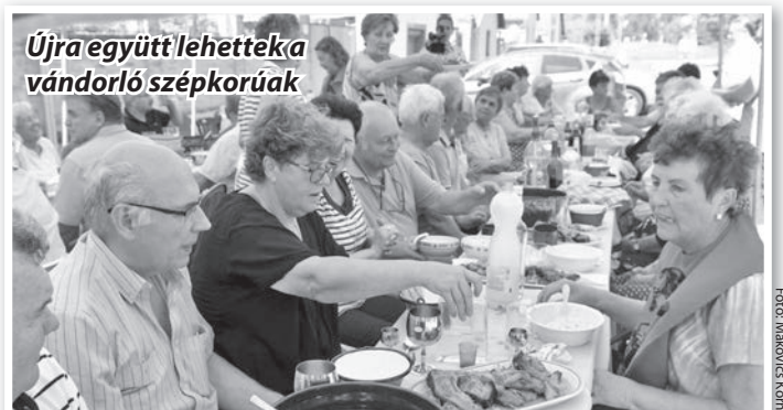
Újra együtt lehetnek a vándorló szépkorúak

vál”-ra. Három nagy bográcsban főtt a harminc kiló ponty. A zsűri ítélete szerint első lett a Dalos pacstírták, második a Jóbarátok és a Klumpások csapata holtversenyben. A legjobb lé viszont a három bogrács tartalmának vegyítéséből adódott, ezt fogyasztották el jóízűen a résztvevők. Volt még szülő- és névnap köszöntő, fellépett a baráti kör énekklubbja is. Szellemi vetélkedőben