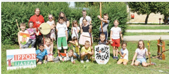
A táborokban népszerű foglalkozás volt az íjászat

Egy korábban ismert, ám feledésbe merült sportág jelent meg a tolnai sportélet palettáján. Az idei nyári táborok népszerű kiegészítő foglalkozása volt az íjászat, amelyről kiderült, sok fiatalnak a vérében van.