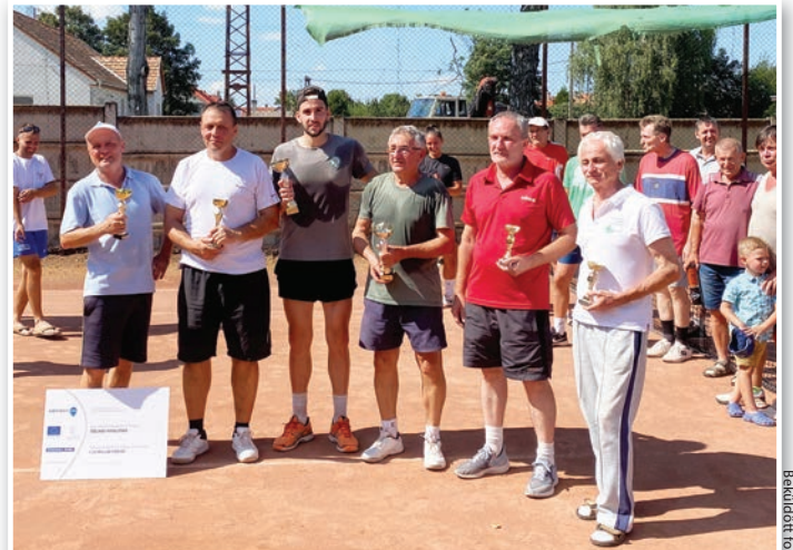
A torna első három helyezett párosa, középen a győztesek

A tolnai teniszélet változatlanul pezseg. Schalli Ádám érdeklődésünkre elmondta: tovább zajlanak a bajnokságok, három osztályban, plusz a párosok ligájában. A bajnoki küzdelmek október közepére fejeződnek be. Ezen kívül két páros tornát is rendeznek, még az ősz folyamán. Szeptember második felében a hagyományos Vereckei Balázs Emléktornára kerül sor, míg októberben egy szezonzáró páros versenyen mérhetik meg magukat a teniszbarátok.