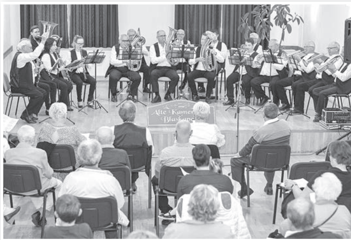
Örömmel hallgatta a közönség az Alte Kameraden Blaskapelle műsorát

Valóban élővé vált a régi hagyomány: immár hatodik alkalommal rendezett Herbstmusik néven Őszi fúvós térzenét Tolna Város Német Nemzetiségi Önkormányzata Szent Mihály-napjához (szeptember 29.) közeli időpontban.