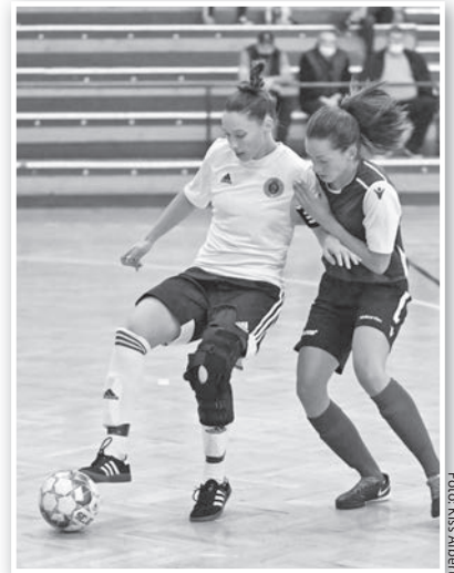
Nem bírt egymással a Tolna-Mözs és a TFSE a tolnai meccsen