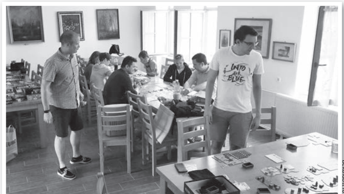
Tolnában, a civil házban zajlanak a klubtalálkozók

A szervezők szeretettel várnak minden érdeklődőt, életkortól függetlenül. (Elérhetőség jelenleg Facebook csoportként: Társasjáték Vár.) NZ