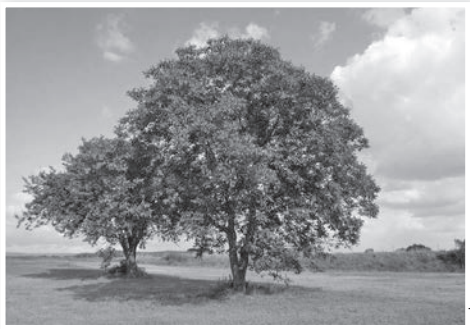
Viszonylag könnyen megvédhető a dió a kártevőtől

Szomorú látvány, hogy az amúgy egészségesnek látszó, töretlenül fejlődő, ép levelű fák ágai közt sokszor nincs egyetlen ép termés sem.