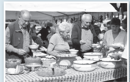
Hatféle lecsó készült, senki nem maradt éhesen