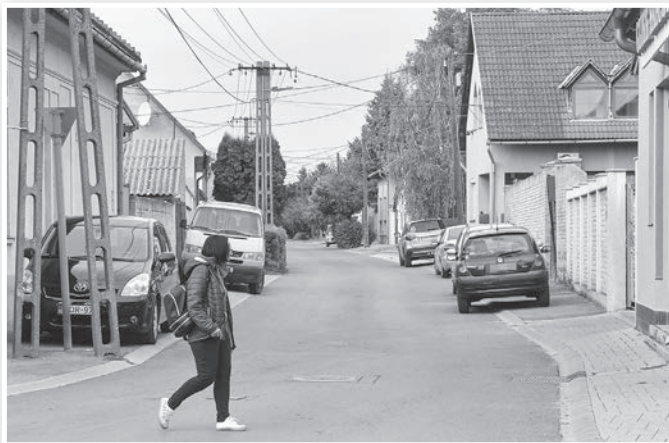
A Damjanich utca főút felőli végén is megállási korlátozást fognak bevezetni