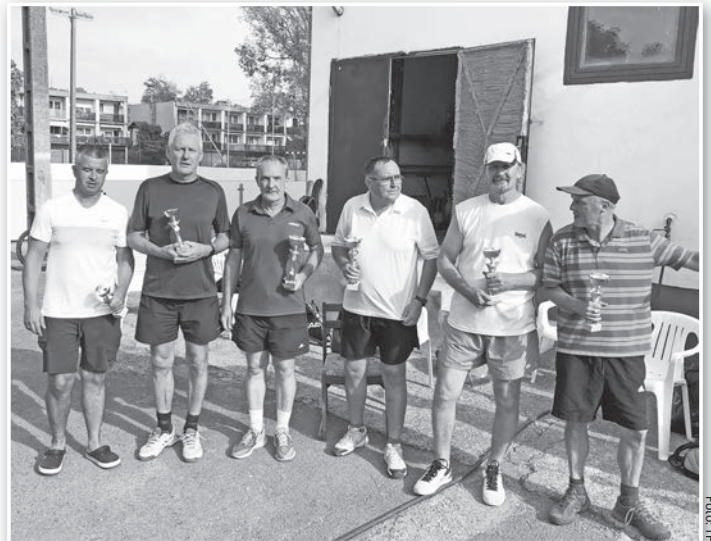
A három dobogós páros, középen a győztesek

Szeptemberben rendezték volna a serdülő országos bajnokságot, ám ez a verseny a járványhelyzet miatt elmaradt.