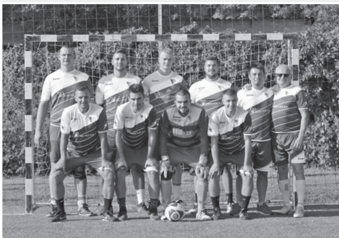
A vendéglátók győztes csapata