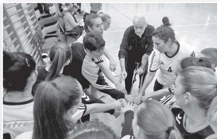
Az időkérés sem használt a Veszprém elleni meccsen