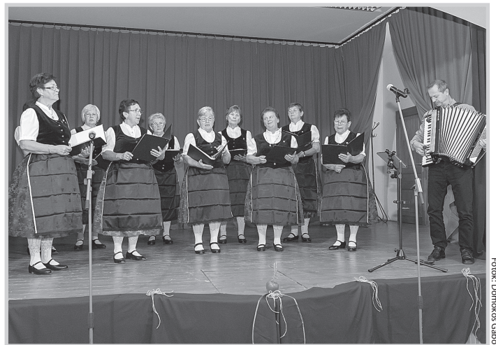
A díjazott Mözsi Német Nemzetiségi Klub énekkara is fellépett a nemzetiségi napon

A műsor zárásaként a tolnai német önkormány-