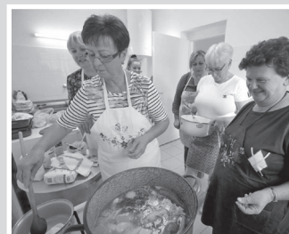
Fő a mözsi húsléves a Heinek Ottó Közösségi Házban

(„Pederszil pri”), Torma szósz („Krépráj”), meggyzósz és kitoló fánkot („Schpritz-krepl”) készítettek.