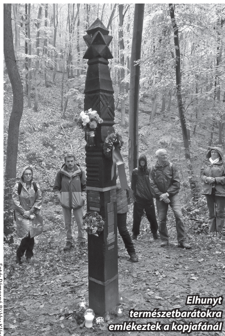
Elhunyt természetbarátokra emlékeztek a kopjafánál