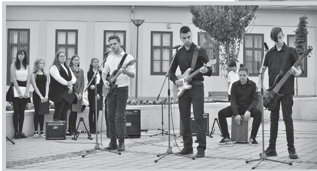
A gimnazisták zenés műsort adtak