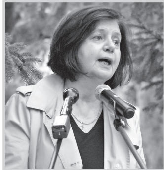
Novothné Bán Erzsébet mondott beszédet

Az 1848-49-es forradalom és szabadságharc leverése után az osztrákok által kivégzett vértanúkra emlékeztek október 6-án Tolnában, a Szent István téren.