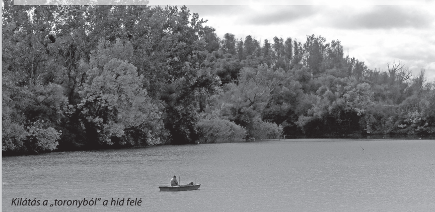
Kilátás a „toronyból” a híd felé