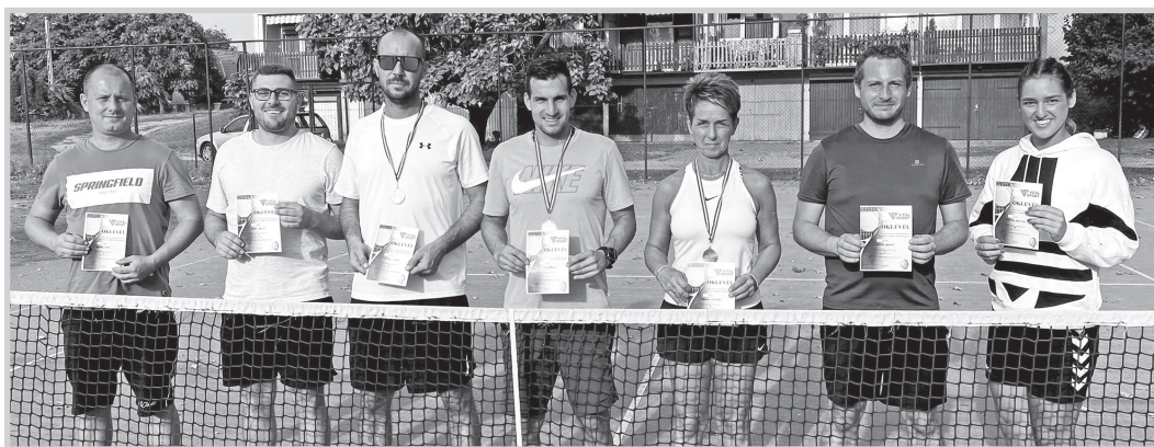
A torna résztvevői, középen a dobogós helyezettek