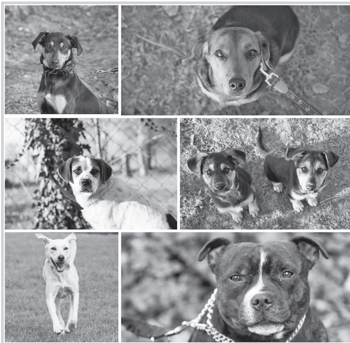
A kutya nagyon sok örömet jelent, főleg, ha hozzánk illőt választunk

tés, élősködők elleni védelem), és nagyobb helyre van szüksége (lakásban, udvaron, autóban). A nyaralás vagy az állatorvosi vizsgálat is nehezebben oldható meg vele. A nagyméretű fajták kölykei nagyon gyorsan nőnek, sokszor előbb elérik a felnőttkori súlyu-