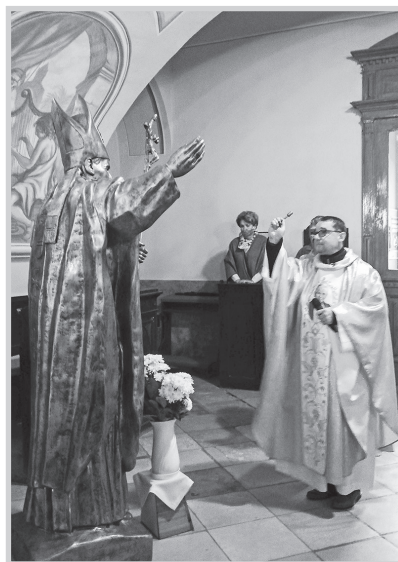
Ravaszcaba plébános végezte az ünnepi aktust

tulajdonába. Vele együtt egy másik pápaszobrot, egy kisebbit is avattak e napon, ami később a plébániára kerül majd.