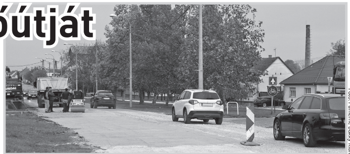
Egyes szakaszokon a teljes pályaszerkezetet kicserélik

magába foglalja Tolna város teljes belterületi szakaszát. A felújítás során megerősítik a burkolatot, jellemzően egy réteg aszfaltot építenek be. Ez előtt elvégzik a burkolati hibák javítását is. Padkát építenek, egy méter szélességben. Tolna területén a szegélyek átépítését is elvégzik. A bejárókat, útsatlakozásokat zúzottkővel vagy aszfalttal emelik szintre. A megfelelő vízelvezetés érdekében új árkok, áttereszek épülnek, a meglévő árkokat, áttereszeket pedig tisztítják, profilozzák. Egyes szakaszokon, ahol az indokolt (ilyen az Újtelepen, az üzletház közelében levő útszakasz is) a