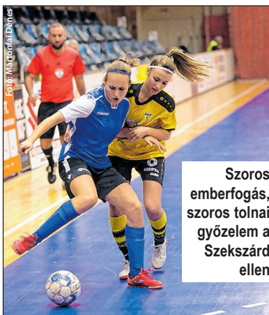
Szoros emberfogás, szoros tolnai győzelem a Szekszárd ellen