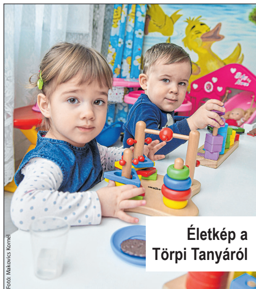
Életkép a Törpi Tanyáról