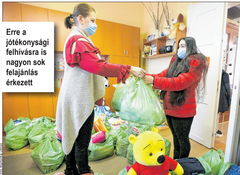
Erre a jótékonyági felhívásra is nagyon sok felajánlás érkezett

A kettes számú pályázatot ágapritógép beszerzésére nyújtották be. A berendezést az intézmények faaprítékkal történő fűtésének biztosítására kívánják beszerezni. Erre a projektre 7,05 millió forint támogatást remél a város a JETA-tól, 10 százalék önerő, mintegy 780 ezer forint vállalása mellett.