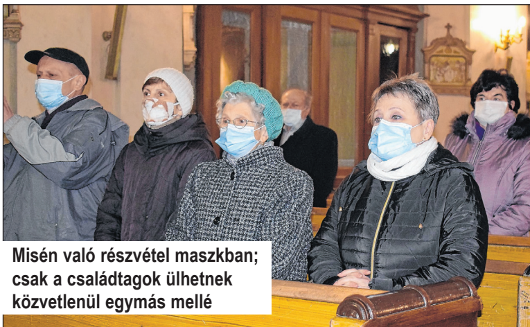
Misén való részvétel maszkban; csak a családtagok ülhetnek közvetlenül egymás mellé