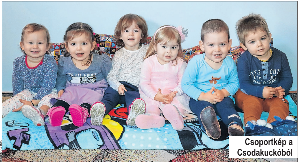
Csoportkép a Csodakuckóból

Jelenleg négy intézményben huszonhat kiseddel foglalkoznak