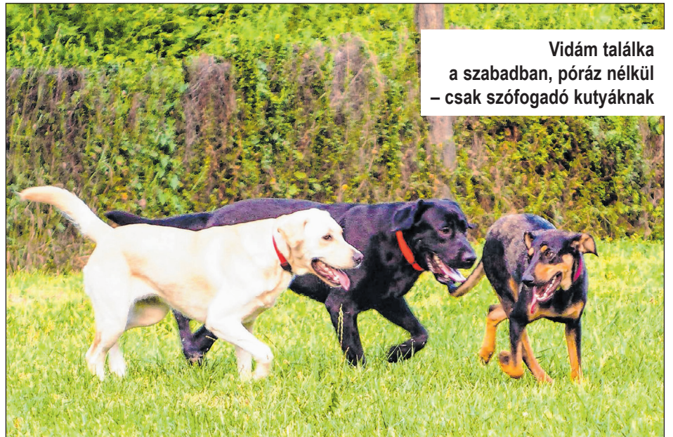
Vidám találka a szabadban, póráz nélkül – csak szófogadó kutyáknak

Városban és azon kívül is egyaránt fontos, hogy a kutyánk jól látható legyen. Sötétben rendkívül veszélyes