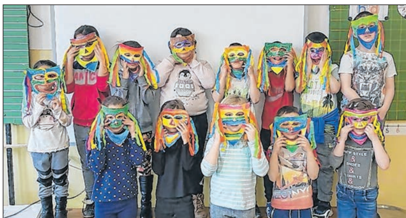
A műszi iskola 1. osztályosai