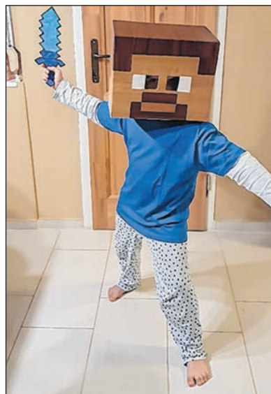
Nagy Bendegúz, 1. osztályos Minecraft-álarca