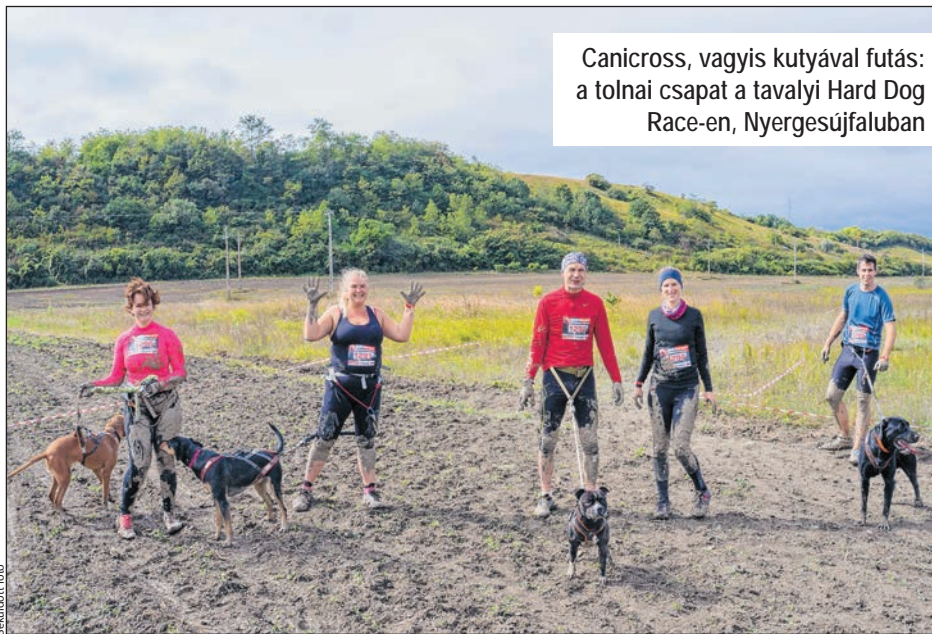
Canicross, vagyis kutyával futás: a tolnai csapat a tavalyi Hard Dog Race-en, Nyergesújfaluban

Logikai játékok: számos logikai játékkal találkozhatunk az állatboltok kínálatában, amelyek kis rekeszeibe jutalomfalatokat rejthetők, és a kutya különféle elemek lenyomásával, elto-