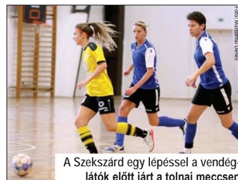
A Szekszárd egy lépéssel a vendéglátók előtt járt a tolnai meccsen

Egy nappal a megyei rangadó előtt az Astra–Budaörs mérkőzésen az