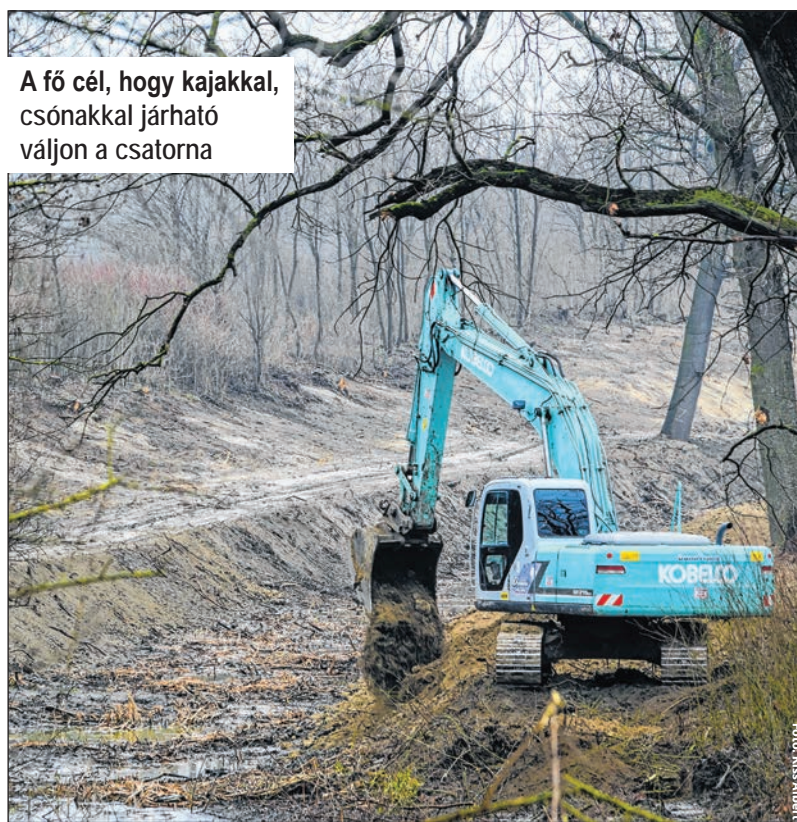
A fő cél, hogy kajakkal, csónakkal járható váljon a csatorna

A távolabbi cél az, hogy a vízitúrázókat Domborítól (a Duna szomszédságából) egészen a Sióig el tudjanak jutni a vízen. Ehhez – egy későbbi újabb pályá-