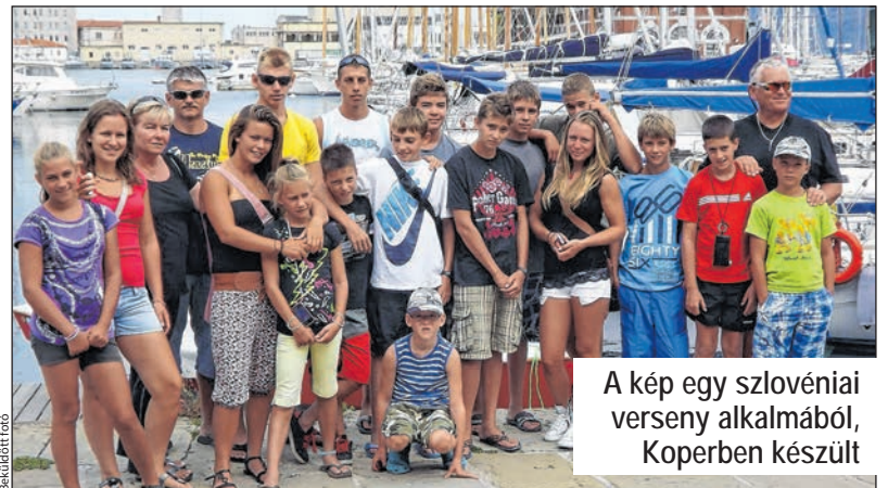
A kép egy szlovéniai verseny alkalmából, Koperben készült