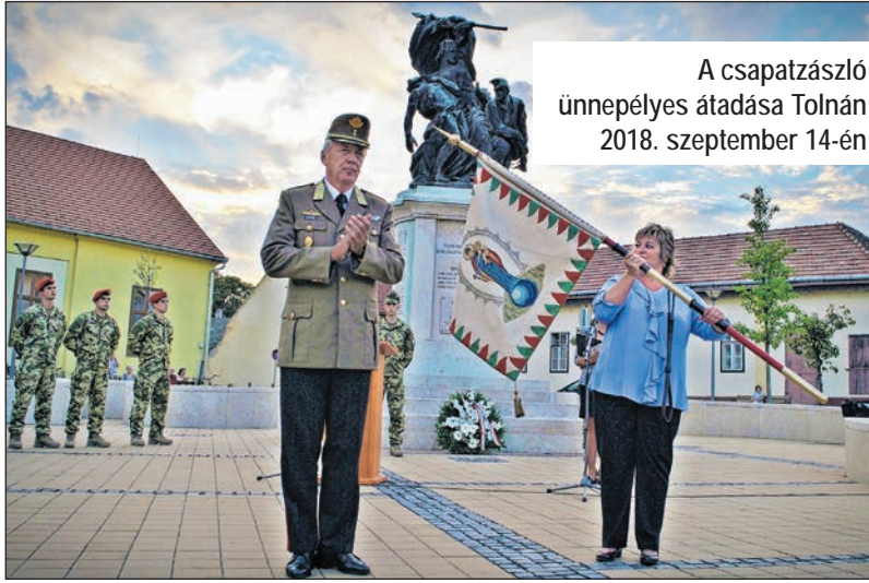
A csapatzászló ünnepélyes átadása Tolnán 2018. szeptember 14-én