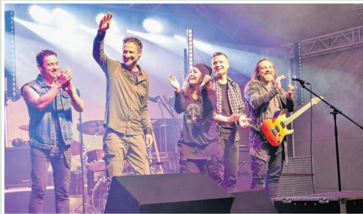
A Zanzibár nagyon élvezte a tolnai fellépést