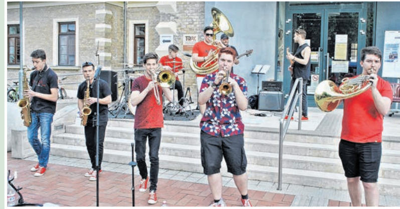
A Humen utcazenekar feldobta a délutánt