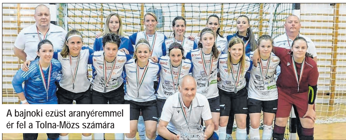
A bajnoki ezüst aranyéremmel ér fel a Tolna-Mözs számára

– Ezen a mérkőzésen érezhető volt a játékkonk, hogy nincs több hibázási lehetőségünk. Az eddigiekhez képest tompábbak voltunk, sok hibával játszottunk, de még így is végig meccsben tudtunk lenni. Mindezek ellenére nagyon büszke vagyok a lányokra, hatalmas eredményt értünk el. Igaz,