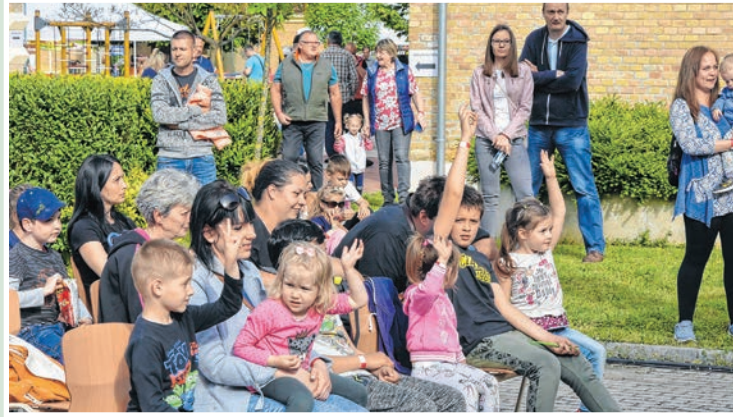
Az időjárás is kedvezett, nem rontotta el a szabadtéri rendezvényt