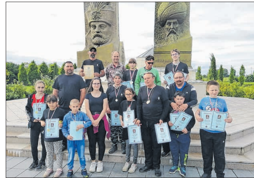
Az ipponos csapat a szigetvári verseny után

Május elsején elkezdődött a Baranya Íjásza versenysorozat, amelynek szezonnyitó versenyét idén is a Siklósi Apró Paták Lovas és Sport Egyesülete rendezte. Az Ippon Karate és Íjász Klub versenyzői 6 érmmel zárták a versenyt.