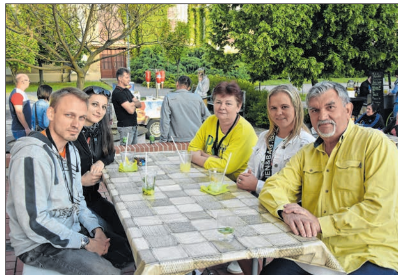
A kórtélok is hozzájárultak a jó hangulathoz

azok számára, akik mindent elkövetek azért, hogy ezt a kritikus helyzetet minél kevesebb veszteséggel át lehessen vészelni.