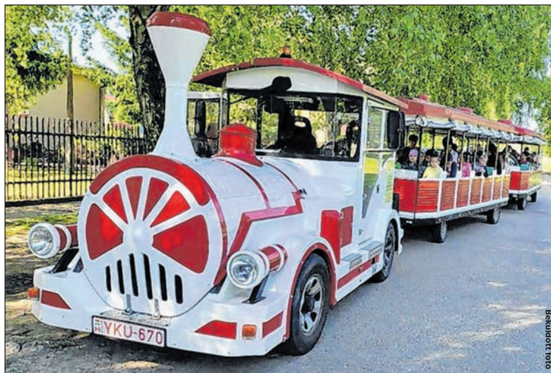
A városnéző kisvonat különleges élményt jelentett a kicsiknek

A gyerekek ötféle technikával ismerkedhettek meg: festhettek tójtartóból kialakított gombát, készíthettek nyakláncot színezés után zsugorítható fóliából, fűztek borkarkötőt, levendulás illatszást