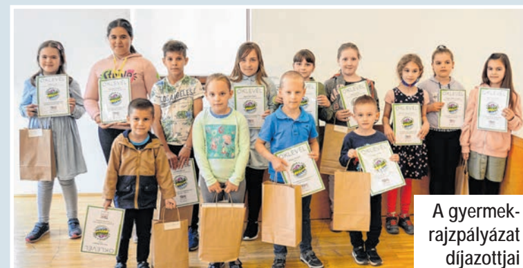
A gyerekrajzpályázat díjazottjai

A programokkal kapcsolatban a 74/540-035; 74/540-036-os számokon lehet érdeklődni.