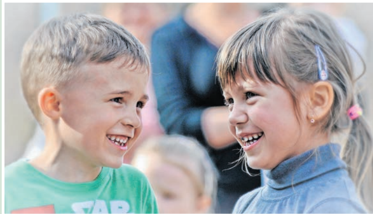
Láthatóan ők is jól érezték magukat