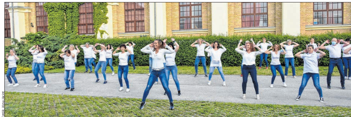
A Jerusalema tánc az összefogásról és a reményről szól

Az este szabadtéri videoklip-vetítéssel zárult, a jó hangulatot a végig üzemelő koktélbár is támogatta.