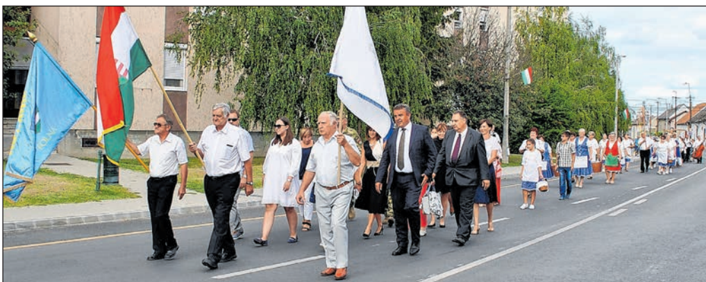
Az aratófelvonulás résztvevői a Deák Ferenc utcában

Ezután a polgármester és a honatya megszegette az új kenyeret, amit – némi bor és pálinka kíséretében – a szabadidő klub tagjai kínáltak a közönségnek, a Bogyiszlói Zenekar zenei aláfestésével.