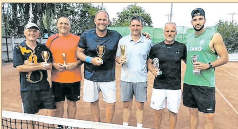
Balról jobbra a bronz-, az arany- és az ezüstérmes páros