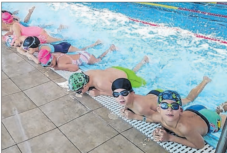
Élvezték a vizet a gyerekek a tanuszodában

A tábor a TOP-7.1.1-16-H-ESZA-2019-00944 Tolnai Vitalitás pályázat segítségével valósulhatott meg. A szervezők bíznak abban, hogy szeptembertől megkezdhetik úszástanfolyamaikat, melyre sok szeretettel várják a meglévő és leendő úszni vágyó fiatalokat.