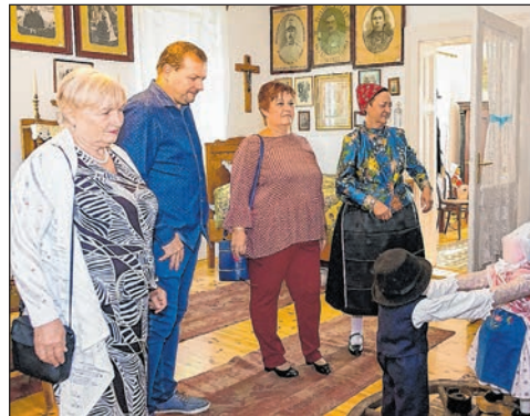
A „Heimatumuseum” újraavatójával kezdődött a hivatalos program

Az elnök és a polgármester köszöntője után a program zenés produkciókkal folytatódott. Felléptek a tolnai Eötvös utcai iskola diákjai, a Tolnai Német Nemzetiségi Baráti Kör énekkara, a szekszárdi Mondschein Kórus Egyesület, a mórággyi Drittel Sextett és a mőzsi klub énekkara. A jubileum vacsorával és bállal zárult.