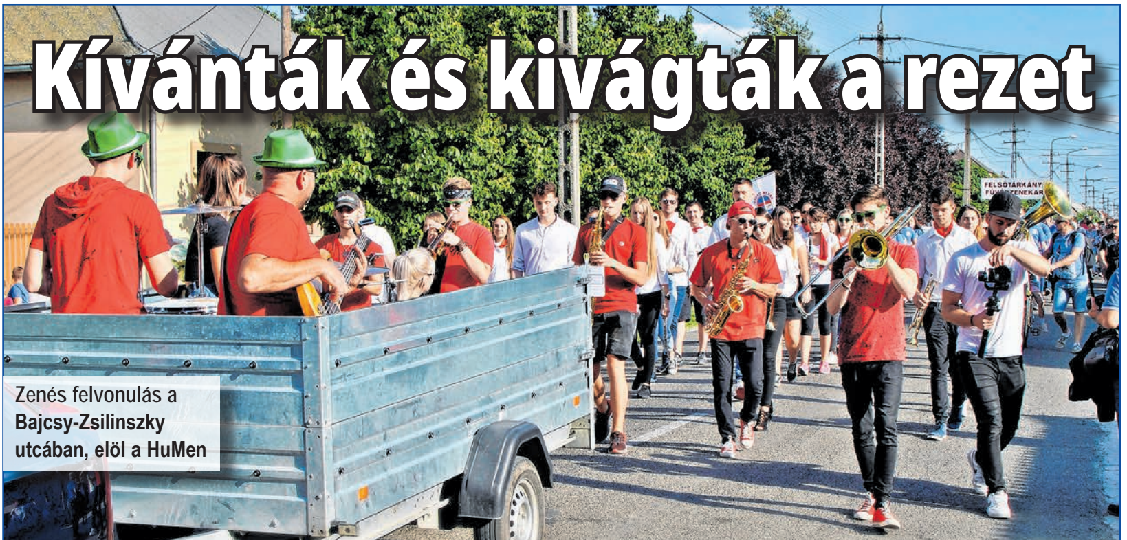
Zenés felvonulás a Bajcsy-Zsilinszky utcában, elől a HuMen