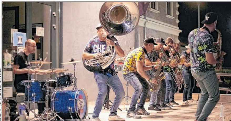
A BrassTime óriási bulit csinált

Az idei Brass Vegas Fesztivál a TOP-7.1.1-16.H-ESZA-2019-00977 számú pályázat támogatása révén valósult meg. További támogatók voltak: Tolna Város Önkormányzata, Tolnai Kulturális Központ és Könyvtár, Alisca Bau Zrt., Tarr Kft., Tolnajtáj TV.