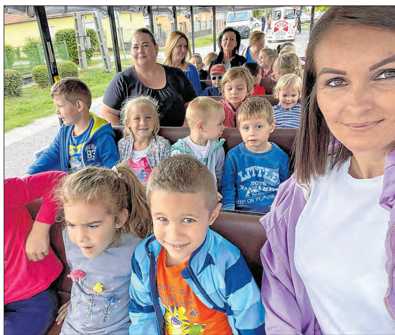
Nagy élmény volt a városi kisvonatozás is