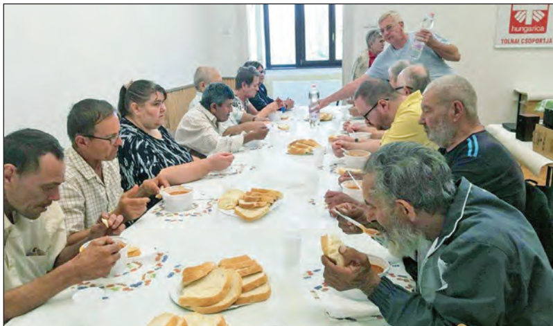
A templomlátogatás után az ebéd következett