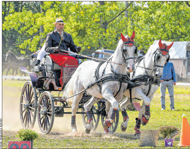
Szép lovakban, fogatokban most sem volt hiány