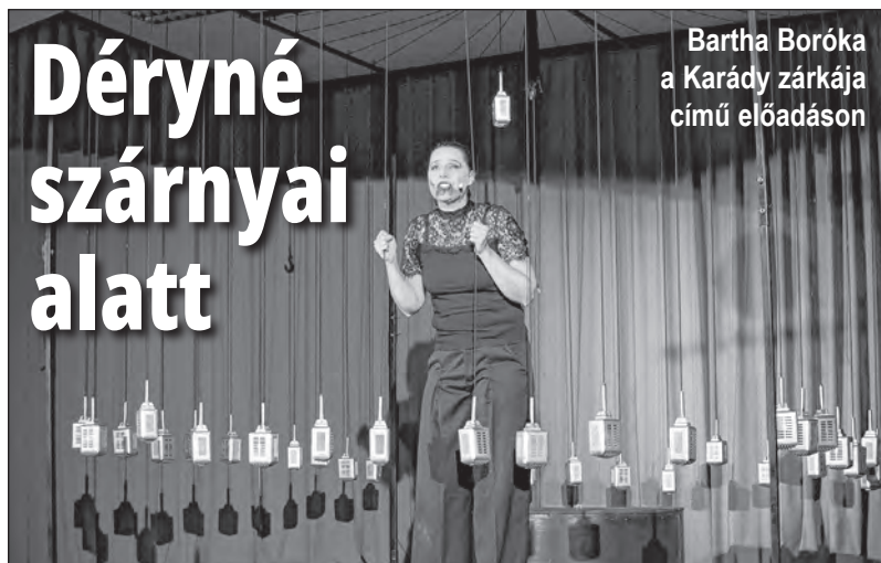
Bartha Boróka a Karády zárkájában című előadáson

A programokról érdeklődhet a 74/540-117-es telefonszámon.