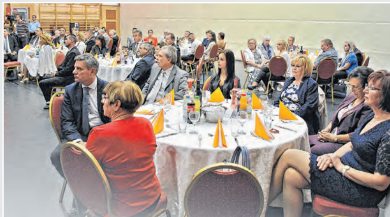
A díjátadó közönsége, előterében a testület néhány tagja