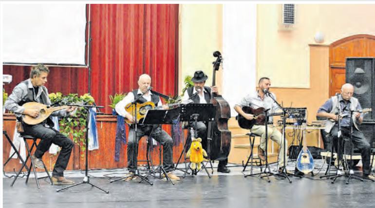
A Medinai Tamburazenekar is nagy tetszést aratott