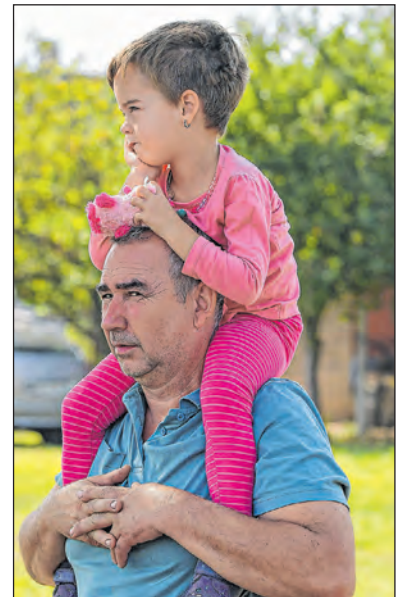
A gyerekeknek is tetszett a lovasprogram