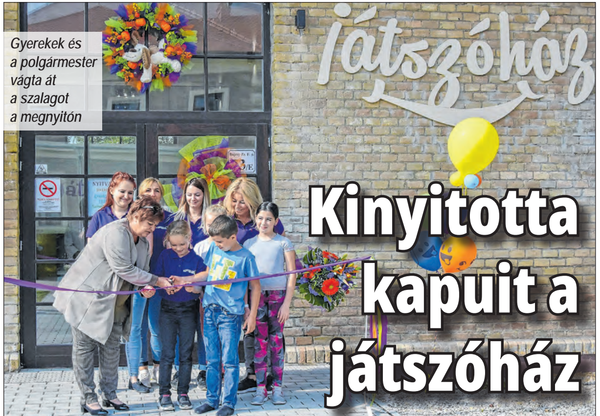
Gyerekek és a polgármester vágta át a szalagot a megnyitón

Megkönnyítette a döntésüket az is, hogy a játszóház modern, nagyméretű, remekül felszerelt, a cégüknek „csak” üzemeltetnie kell ezt a helyi létesítményt. Az önkormányzattal és a