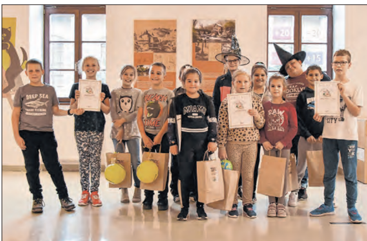
A vetélkedő díjazott diákjai