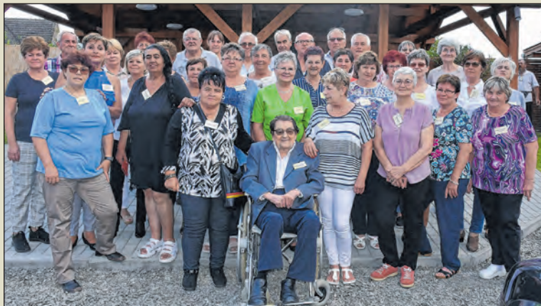
Az 50+1 éves osztálytalálkozó résztvevői