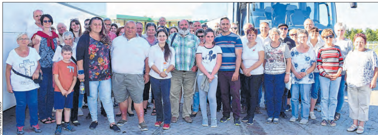
A népes tolnai csoport Ferenc pápa szeptember 12-i budapesti látogatásán

tak. Akik pedig azt hitték, hogy a pápa lesz majd az aktuálpolitika szintjére, azok is csalódtak, míg mások fellélegeztek ettől. Nem lánogolt, nem ostorozott, nem mozgósított. A szeretetről beszélt. Ami olyan – ahogy fogalmazott – mint egy folyó, és ami annak örül, ha híd van rajta. Hidak. Sok, minél több. Ennek forrásánál ihattak a résztvevők. Egy 86 éves, sokat megélt ember poharából, amelynek vize mélyről jövő, hűvös, de csillogóan tiszta. ká