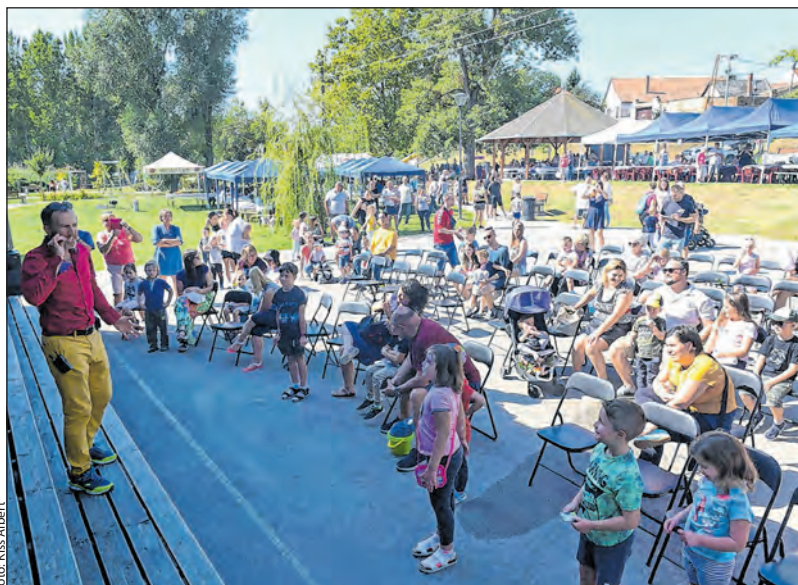
A Csurgó zenekar koncertje zárta a délelőtti programot