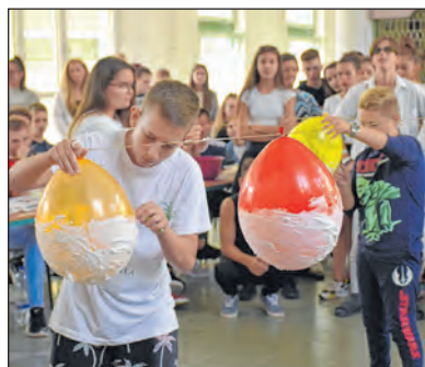
Lufiborotválásban is megmérkőztek a gólyák

A nemes vetélkedőt idén a hetedikesek nyerték, nagyon szoros versenyben, hiszen egy ponttal maradtak csak le a kilencedikesek. Mindkét csapat fergeteges táncot mutatott be, és az