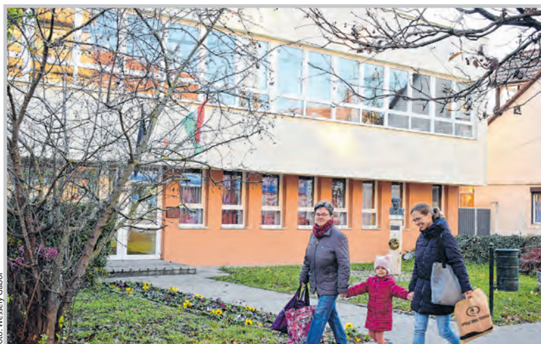
A Széchenyi iskolát három napra be kellett zárni