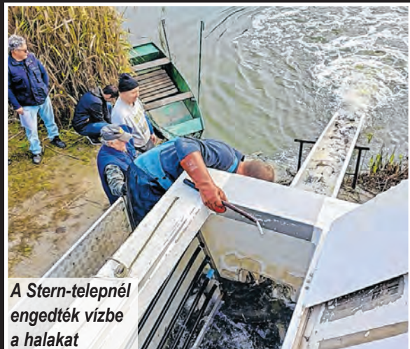
A Stern-telepnél engedték vízbe a halakat

Az egyesület halgazdálkodási tervének megfelelően 3 mázsa kétnyaras compó, 10 mázsa kétnyaras dévérkeszeg, 10 mázsa kétnyaras ponty került a vízbe. Ezen felül 10 mázsa háromnyaras, fogható méretű pontyot is telepítettek. Háromnyaras pontyból egyébként az egész év során összesen 11,5 tonnányit helyeztek ki az egyesület.