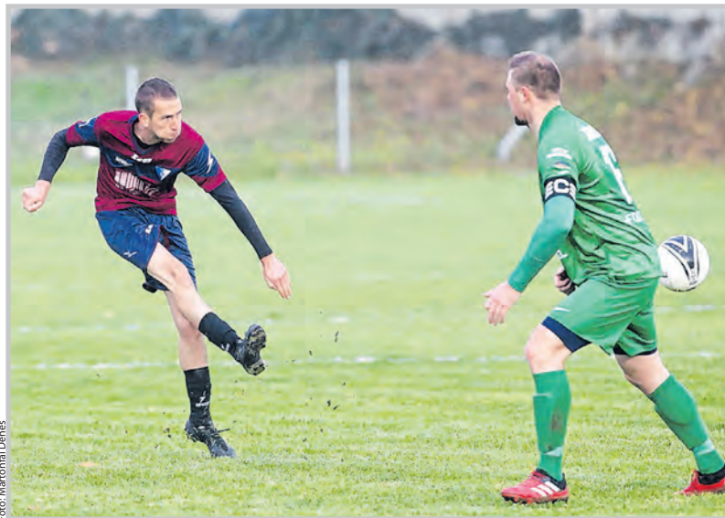
Baros Andráséknak a Nagymányok elleni meccsen nem sikerült betalálniuk

Rangadóval zárult az őszi szezon a megyei másodosztályban. A kilenc forduló után száz százalékos Tolna a tavalyi bajnok Nagymányokhoz látogatott. A hazaiak játéka már az első pár percben látszódtott, hogy kontratámadásokra rendezkednek be.