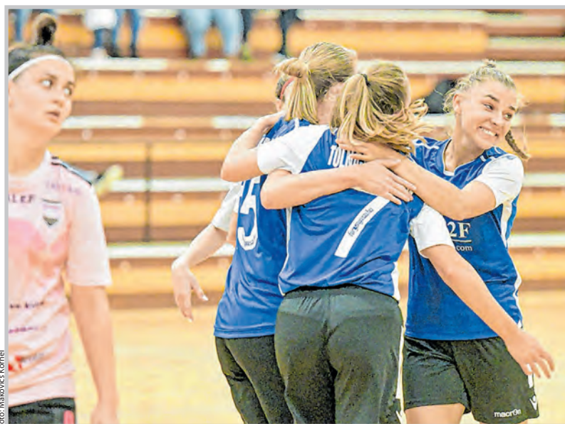
Tolnai gólöröm az Astra elleni mérkőzésen