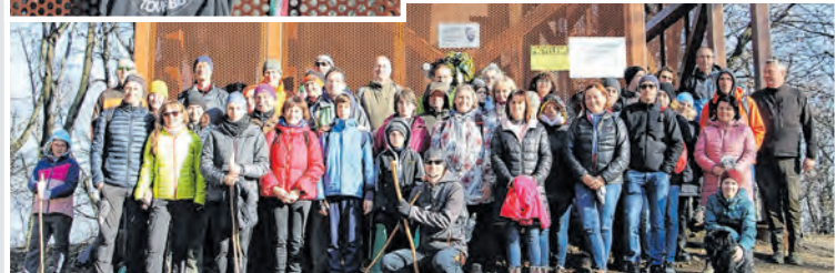
Családtagok, TOVÁBB-osok, egykori tanítványok az emléktáblánál