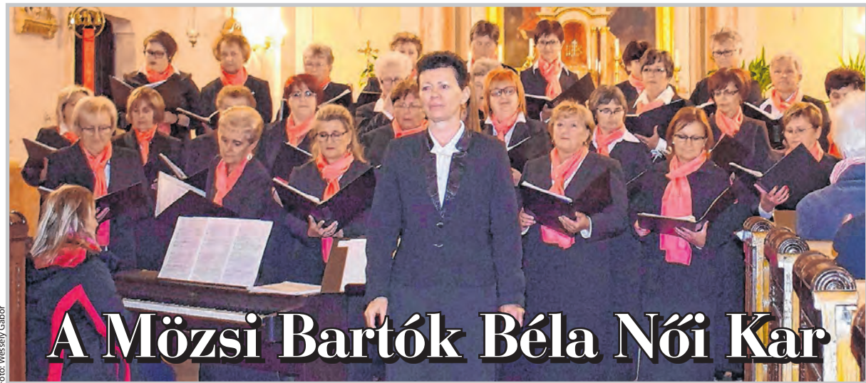
A Mőzsi Bartók Béla Női Kar

A Mőzsi Bartók Béla Női Kar 1972-től Mőzs és Tolna meghatározó művészeti csoportja. 1996 óta működnek egyesületi formában. Tagjai az élet különböző területén dolgozó hölgyek, akik nagyon szeretnek énekelni. A létszám mindig változó volt, az évek során cserélődtek a tagok. Mégis, maga a kórus él és működik, legutóbb a tolnai katolikus templom Erzsébet-miséjén énekeltek. Fennállásuk mintegy 50 éve alatt nem csak településükön belül örvendeztették meg műsorukkal a zeneértő közönséget; Európa 11 országában jártak és vitték hírét a