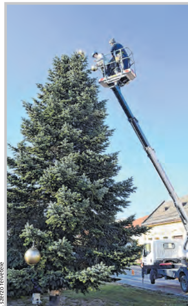
A fenyőt emelőkosaras autóval díszítették

Adventkor kezdődik a keresztény világban az új egyházi év. A koszorúra négy gyertyát helyeznek, hétről-hétre egytel többet gyújtanak meg, a várakozás jegyében. Hit, remény, öröm és szeretet. S mikor mind a négy gyertya ég, elérkezik a karácsony, a Megváltó megszületésének ünnepe. Wessely