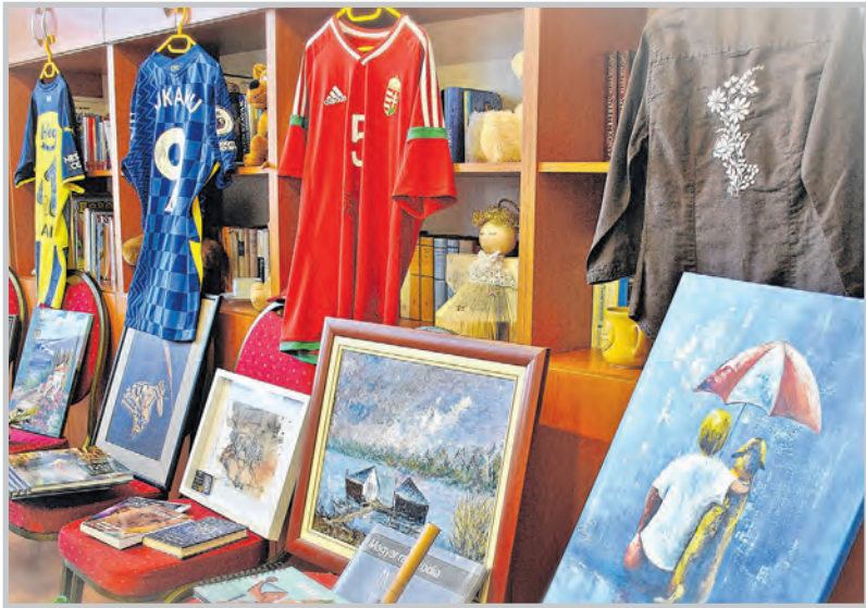
Néhány tárgy az árverésre bocsátott rengeteg közül