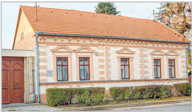
Egy szép példa épületfelújításra: a református imaház Tolnán

A belváros és szűkebb környezete, továbbá Mözs központja településképi szempontból meghatározó terület, amelyen belül az épületek megjelenésére, anyaghasználatára, színvilágára szigorúbb előírások vonatkoznak, mint ezen területeken kívül eső városrészekre. Fontos tudni, hogy az előírások nem pusztán a helyi egyedi védelem alatt álló épületekre vonatkoznak. A településképi szempontból meghatározó területek térképi lehatárolását az ábra szemlélteti.