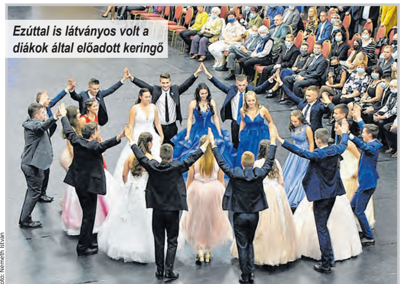
Ezúttal is látványos volt a diákok által előadott keringő