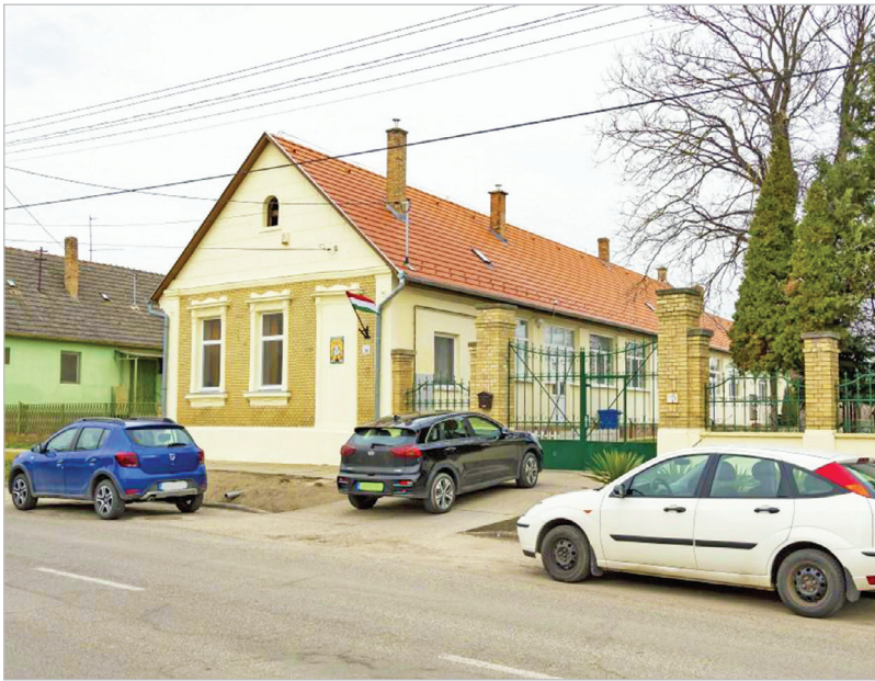
A mözsi Zöldkert óvoda előtt is gondot jelent a parkolás

ezek terveit szintén is elkészítették. A téma tárgyalása során az ülésen szóba került, hogy a Selyem Óvoda előtt is gondot okoz a megállás, várakozás. Berta Zoltán alpolgármester elmondta, hogy az ezzel a kérdéssel foglalkozó önkormányzati munkacsoport javaslatai között szerepel a Tolnatext Bt. előtti tér több pontján parkolóhelyek létesítése, ami megoldást jelenthetne a gyerekeiket autóval szállító szülőknek.