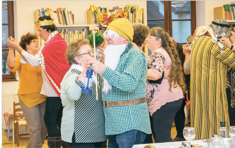
Sokan öltöttek jelmezt a vándorlók farsangi bálján

A vigadalom késő délután kezdődött a jelmezes zenés felvonulással. Farsang alkalmából 24 csoporttag öltött álruhát, amelynek rejtekében többek között Piroska, a Flintstone család és egy arab házaspár is tiszteletét tette az összejövetelen. Fő műsorszámként a Grimm testvérek híres Hófehérke meséje is meglevenedett egyedi feldolgozásban, hiszen a főszereplő ez esetben a megszokott bájos és törekeny külső helyett meglehetősen határozott, férfias vonásokkal rendelkezett. Természetesen a humoros jelenetből nem hiányozhatott a hét törpe, a boszorkány, a vadász és a herceg sem.