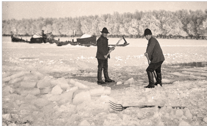
Jeget vágó halászok a tolnai holtágon

Sok Garay utcai háznak volt hátsó kapuja a Duna felé, nem volt úgy beépítve a Magaspart, mint most. Jó pár lépcső, lejáró is vezet itt a házak között