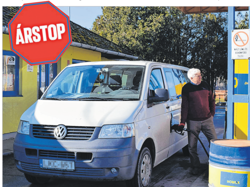
Kisforgalmú a bogyzslói benzinkút is, de az ott élők számára fontos

ezen együttes összege a fix eladási ár közelében van, akkor kereskedelmi haszonról nemigen beszélhetünk.