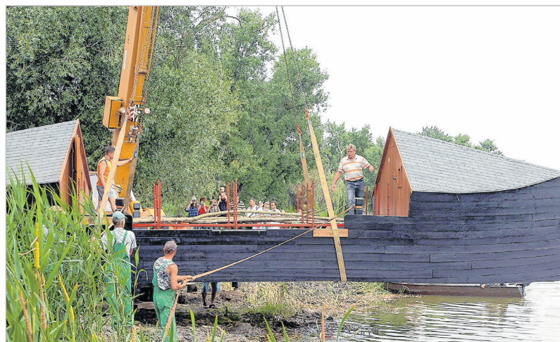
Az új bárka vízre helyezése 2009-ben

emberek, hatalmas nyüzsgés, hangzavar és pezsgés.