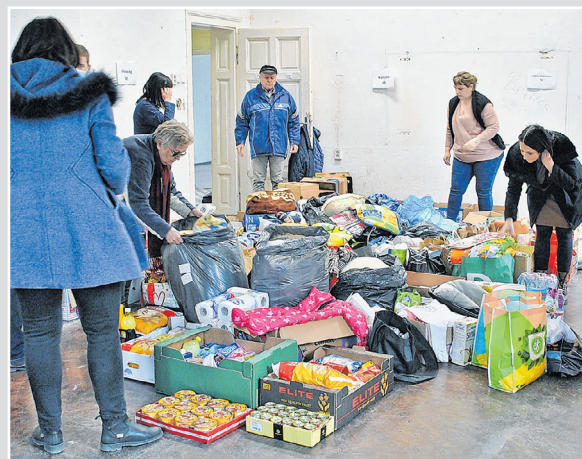
Rendszerezik az adományokat a Szent Imre utcai volt iskolaépületben

A beérkező adományokat a Pécsi Egyházmegyei Katolikus Karitászon keresztül juttatják el a rászorulóknak.