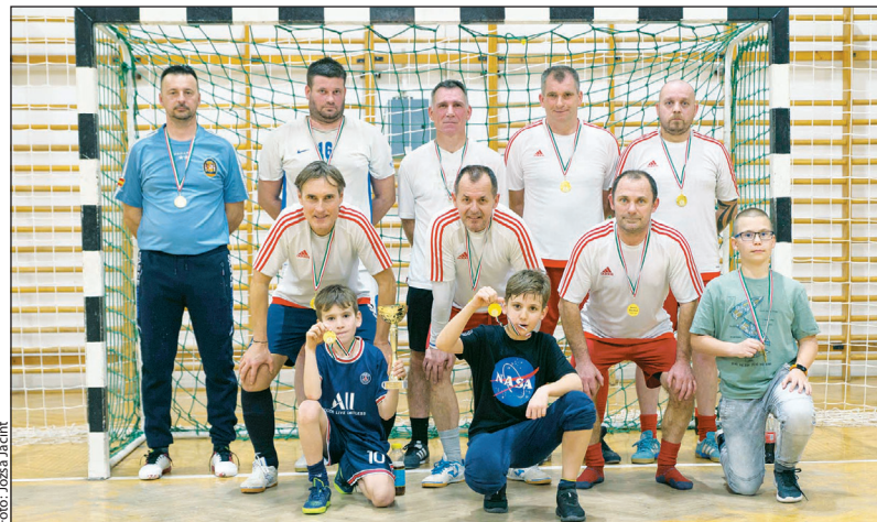
Az Old Brothers csapata a február 16-i utolsó bajnoki és a díjátadó után