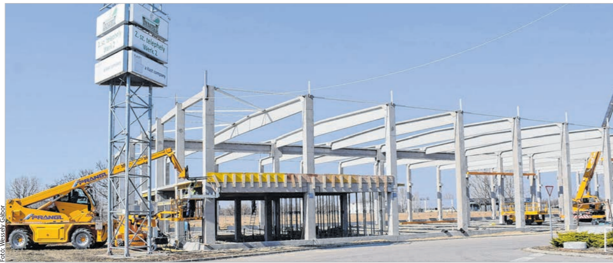
Épül az új üzemcsarnok a II. számú telephelyen, a volt Tesco területén

– A járvány mennyiben akadályozta a termelést, alapanyag-beszerezést, értékesítést?