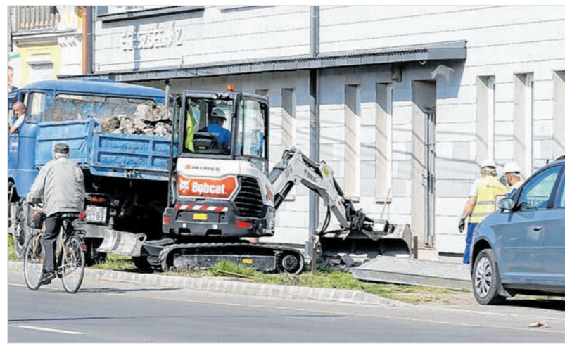
Bontják a régi járdát a tolnai Egészségház előtt

Az Út a jövőbe program befejezésével sem áll le a közlekedési infrastruktúra fejlesztése. Tervezik a Napraforgó utcai útépitést, illetve a Gém utca meghosszabbítását a 6-os útig.