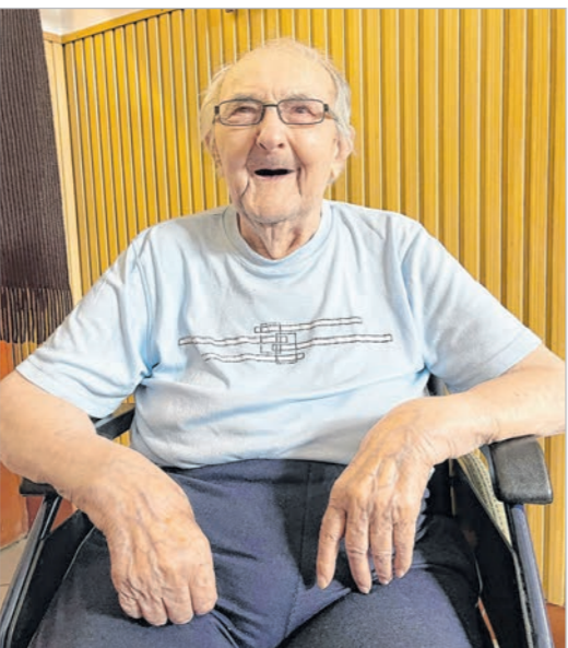
Pista bácsi meg akarja érni a százat