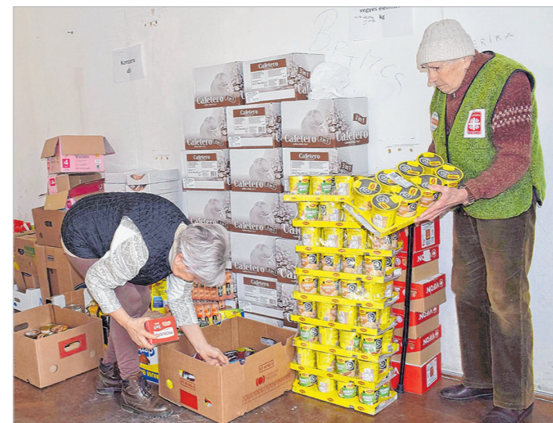
Adományok szortírozása a tolnai gyűjtőponton

Tolnán március 1-jén kezdtek ezt a munkát, s két hétre rá szállították el az első transzportot a baranyai megyeszékhelyre. Azóta már egy újabb kisteherautónyi rakomány összeállt. Banános dobozokba és zsákba pakolnak. Az első fuvarral 46 doboz és 15 zsákot vittek el: tartós élelmiszert – bébiételet is –, ásványvizet, üdítő italt, ruhaneműt, fekvőhelynek alkalmas szivacsot, plédet, párnát, ágyneműt, tisztálkodó szereket. Március végére így alakultak az adatok: 88 doboz, 22 zsák, összesen közel húsz mázsa adomány.