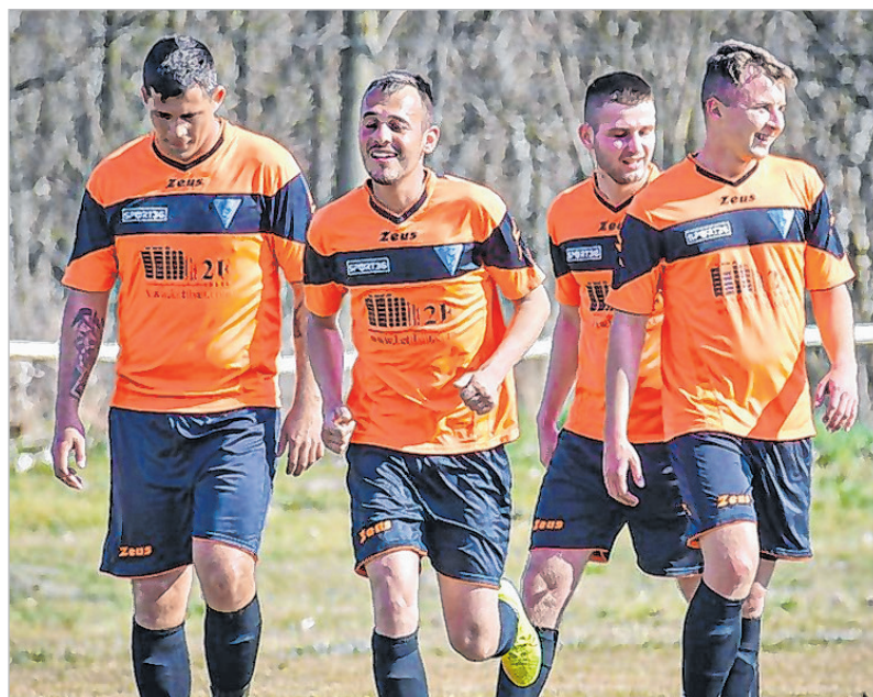
Hatször örülhetett gólnak a tolnai csapat a Bonyhád-Börzsöny elleni meccsen

A Tolna VFC 13 mérkőzés után 36 ponttal a tabella élén állt, 6 pont előnnyel a nagy rivális Nagymányok előtt, amely csapat egy meccsel kevesebbet játszott.