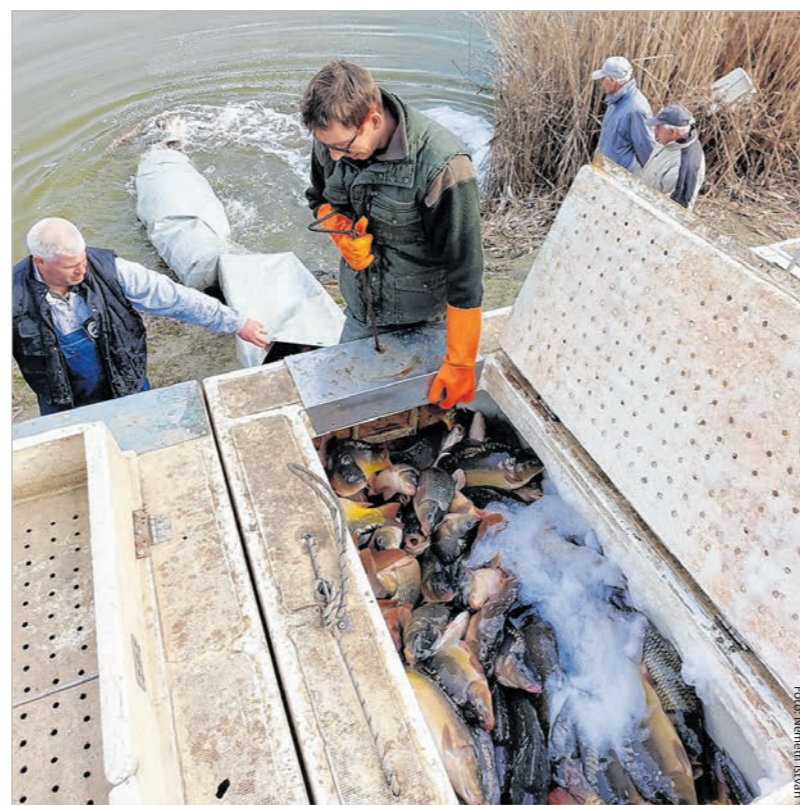
Március 20-án negyven mázsa háromnyaras ponty került a Felső-holtágba

nek még, a további, a mostanihoz hasonló mennyiségű háromnyaras ponty utánpótlás mellett. Amennyiben sikerül pályázati támogatást szerezniük, ezeken felül további haltelepítés is várható.