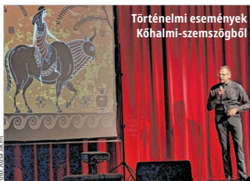
Történelmi események Kóhalmi-szemszögből