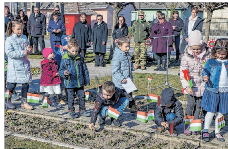
Mőzsön az óvodások működtek közre az ünnepségen

A Mőzsi Emlékparkban március 14-én rendezett ünnepség a Zöldkert óvodások énekével kezdődött. A kicsik nemzeti színű papírvirágokat és zászlókat is letűzték a szabadságharcban elesettek emlékműve köré. A gyerekek műsora után Appelszoffer