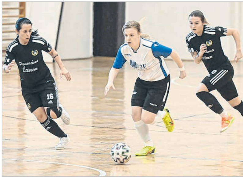
Hiába támadott többet a fehér-kék mezes Tolna-Mözs, a Debrecen nyerte a második meccset is

A bajnoki bronzéremért folyó küzdelemben az Astrával meccsel a Tolna-Mözs, április 23-án és 30-án. A tolna-mözsi lányok idegenben