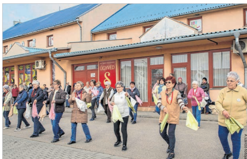
A Spar parkolóban zajlott a nőnap műsor

és koreográfus ötletét a város hölgyeit köszöntő műsort illetően. A fellépés kedvéért hat összeállítást tanult be a csoport, de a nézők és a csapat tagjainak lelkesedése egy ráadást is eredményezett. Bár a hőmérséklet nem éppen az aktuális évszakot idézte, a szereplők a „Tavaszi szél vizet áraszt” kezdetű dallal igyekeztek előcsalogatni a ki-keletet. Az ismert dallamhoz tartozó táncot vidám színekben pompázó kendők is kiegészítették, így a színes kavalkádnak köszönhetően, ha az időjárást nem is, legalább a közönséget sikerült tavaszi hangulatba hozni. J.J.