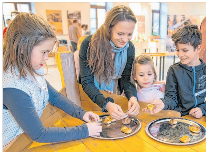
Ünnepi kiflidíszítés a MAG-Házban rendezett gyermekprogramon

A gyerekeknek a MAG-Házban rendeztek programot