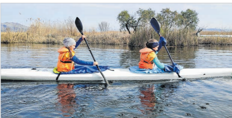
Jó körülmények között készülhettek a tolnai fiatalok

Horvátországi edzőtáborozáson vettek részt március 11-től 20-ig a Tolnai Kajak-Kenu SE sportolói.