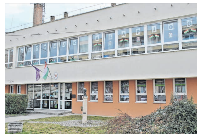
„A sztrájk alapjog”. A Széchenyi iskola ablakaiban ez a felirat volt olvasható március 16-án

Folk György szerint azonban nem csupán anyagi kérdésekről van szó. Úgy véli, a jelenlegi közoktatás száz sebből vérzik, (tananyag, tantervek, tanárok és diákok túlterheltsége), emiatt sürgős átalakításokra lenne szükség. Meglátása szerint azonban addig nem tudnak elérni változást, amíg a szülők, diákok, pedagógusok együtt nem mozdulnak meg a jövő ifjúsága érdekében. Mert a kérdés nagyon is időszerű: ki fog itt a jövőben tanítani?