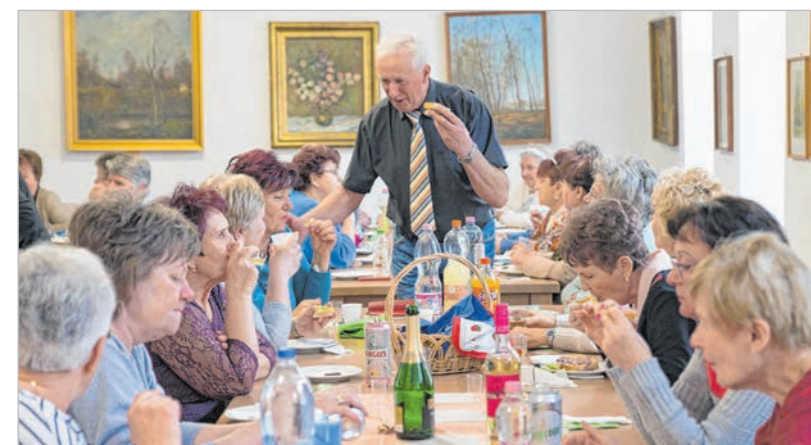
Jól sikerült az első nőnap buli, a jövőben is megrendeznék

A meghívóban foglaltak szerint fő fogásként zsíros kenyér került az asztalra különböző ízvariációkban, azonban a jeles napra való tekintettel a meglepetés sem maradt el, amely végül a desszert formájában érkezett meg. A csoport vezetősége különleges cukrászsüteménnyel ked-