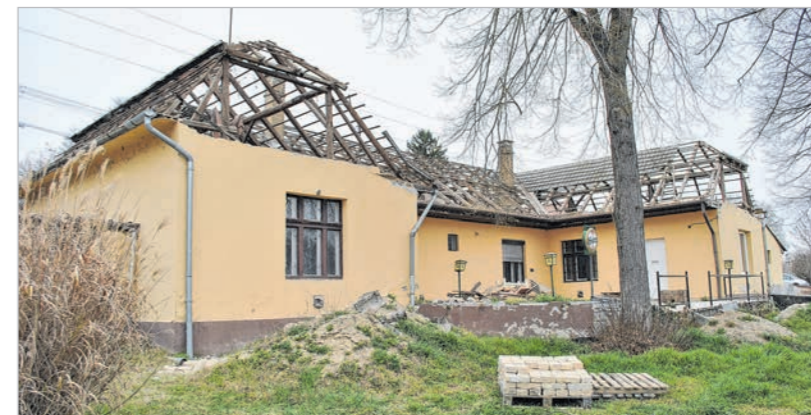
Megkezdődött az egykori Gödör presszó épületének bontása. Helyén panzió épül