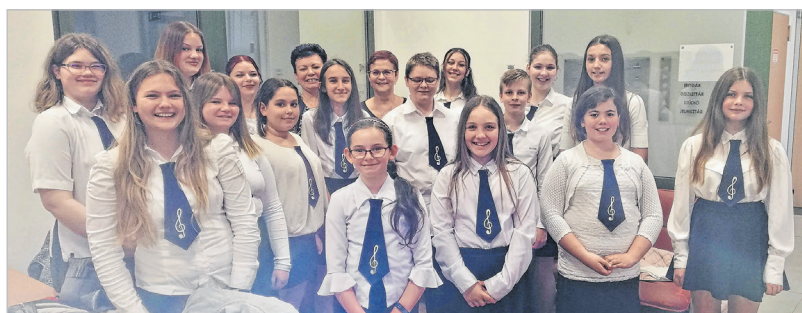
A tolnai zeneiskola kórusa a szekszárdi Babits kulturális központban

A rendezvényt támogatta Tolna Város Német Önkormányzata, valamint a Bethlen Gábor Alapkezelő Zrt, a NKUL-KP-1-2022/2-000241 számú pályázat keretében.