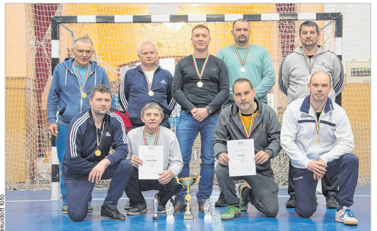
A tornagyőztes Favorit csapata