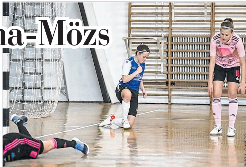
Padlón az ellenfél az Astra elleni tolnai meccsen.