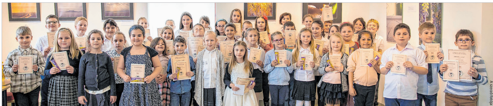
Korábban még soha nem vettek részt ennyien a versmondó versenyen