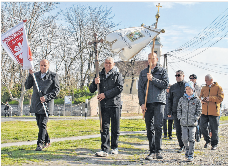
Indul a menet a kápolnától

Így volt ez az idei csípős hajnal utáni, de később napsütésesre váltott húsvéthétfői délelőttön, magasra tar-tott kereszt alatt és templomi zászlók után vonulva. Az ősi útvonalon.