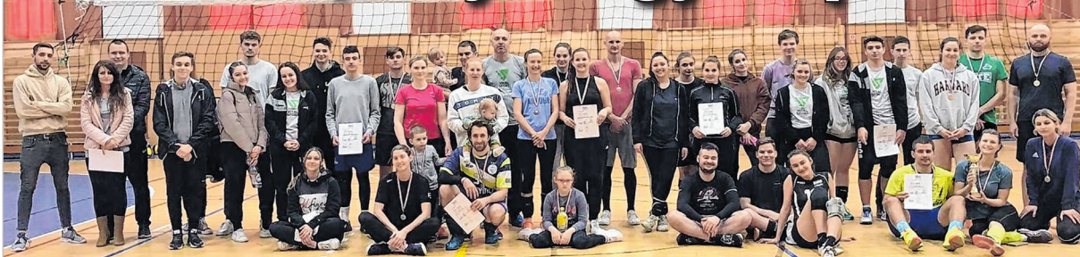
A Bezerédj Pál röplabda torna résztvevői

Négy településről érkeztek a röplabdázni szerető fiatalok a tolnai kulturális központ által rendezett hagyományos amatőr mix röplabda tornára.