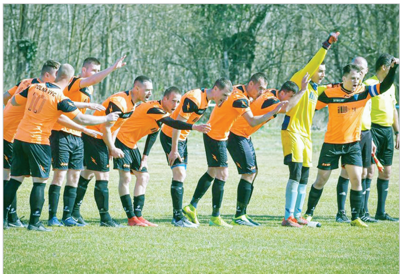
A Tolna VFC tovább küzd a bajnoki címért