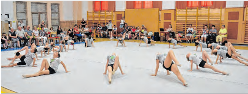
Nagy közönségsikert aratott a tolnai gála

A második gáláját rendezte a Vitál Sport és Szabadidő Egyesület ritmikus gimnasztika szakosztálya június 4-én, a Lovardában.