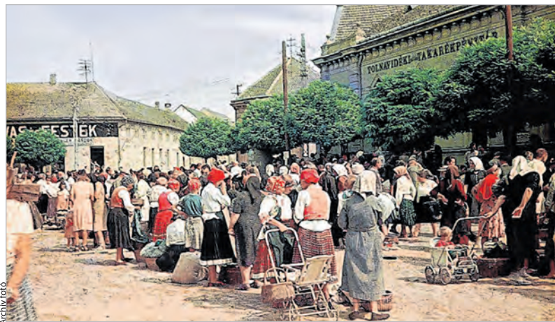
Az 1950-es évekig a Szentháromság téren tartották a heti piacokat

(Az adományozási lehetőségekről később adunk tájékoztatást.) Link Judit