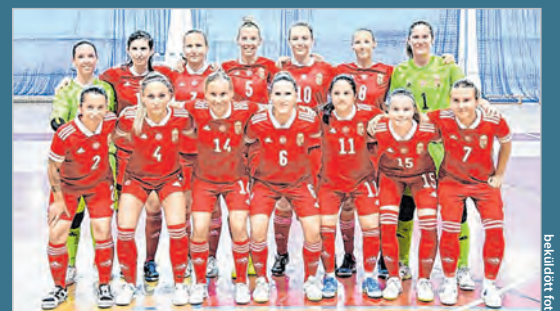
A magyar női futsal válogatott a horvátországi tornán

Negyedik lett a tolna-mőzsi játékosokkal is felálló magyar női futsal válogatott az Európa-bajnokság négyes döntőjében.