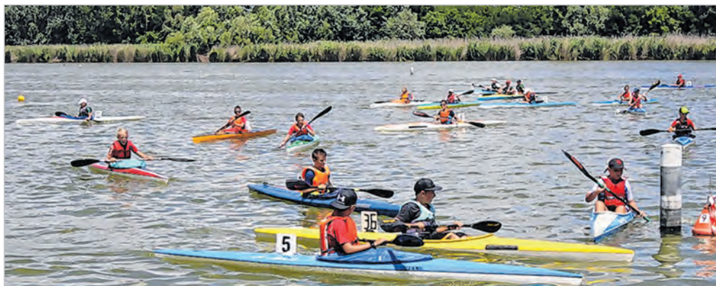
A Magyar Kupa döntőjén hetvennégy klub vett részt, köztük a tolnai

Az országos Magyar Kupa döntőjét szintén Domboriban rendezték, június utolsó hétfőjén. A versenyen hetvennégy klub versenyzői mérték össze tudásukat. A tolnai indulók ezúttal nem szereztek dobogós helyezést.