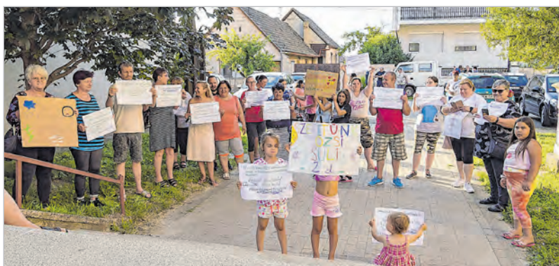
Az iskola előtt csendes demonstráció zajlott a bezárás ellen

A mözsi felső tagozat ezzel együtt 2011 szeptemberétől megszűnt. Időközben az állam az iskolák fenntartását, majd az üzemeltetését is átvette az önkormányzatoktól. A mostani iskolabezárás tehát már állami döntés.