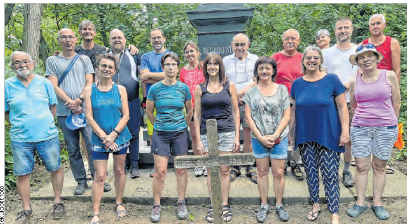
Az emléktúra résztvevői a Bezerédj-síremléknél

Mikszáth Kálmán is nagyra tartotta Bezerédj Pált