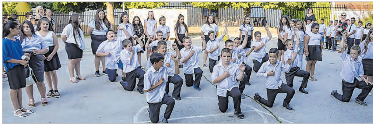
Így búcsúztak a mözsi diákok iskolájuktól az évszárón

Az igazgató elmondta, hogy az iskolabezárás 62 mözsi gyermeket érint. A hét beiratott mözsi elsős a Széchenyi iskola elsős osztályába kerül. A mözsi 2., 3., 4. osztályosok a Széchenyi és az Eötvös utcai alsós osztályokban folytatják. A mostani mözsi negyedikesek a Bartók utcai (Wosinsky) iskolában kezdik meg a felső tagozatot. Így a Bartók utcai iskolában három 5. osztály indul szeptemberben, a Széchenyiben egy. Mivel a Bartókban ennyi osztálynak nincs elég hely, átmenetileg egy konténer tanteremben is zajlik majd oktatás. Ezzel a megoldással nem kell igénybe venni (előtte pedig felújítani) Tolnán az üresen álló Szent Imre utcai iskolaépületet.