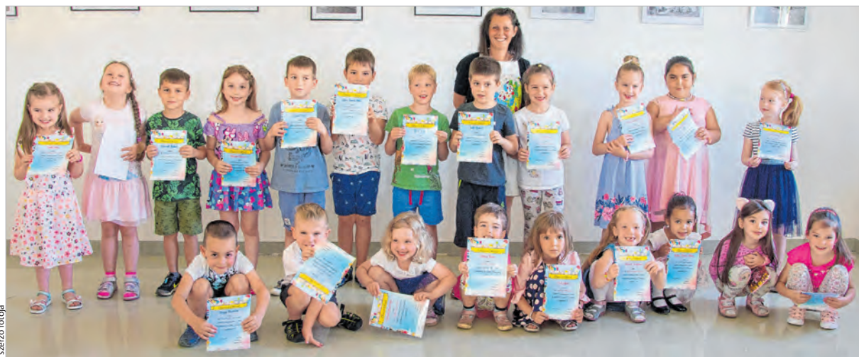
Harmincegy óvodás alkotása került fel a MAG-Ház folyosógalériájának falára

let is átvehettek. Noha a szakkör tagjainak jó része a szeptembert már az iskolapadban kezdi, a Csingilingi Barkácsműhely a jövőben is szeretettel várja a kis tehetségeket. J.J.