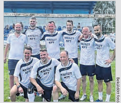
A tornagyőztes Kriszt Kft. csapata

A díjátadón ezúttal is közreműködtek az elhunyt kapus gyermekei.