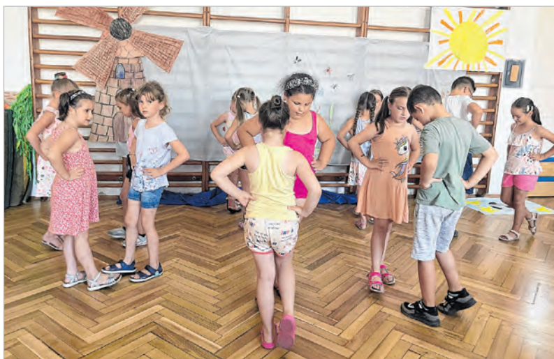
Pillanatkép a gyerekek zenés-táncos műsorából

A rövid táncos-dalos összeállítás legeredetibb mozzanata az a Josef Michaelis által lejegyzett mese volt, ami a halak, a békák és az ember kapcsolatáról szólt. Hogy meddig tudtak beszélni a halak és a békák? Addig, amíg világszerte útjukon nem találkoztak az emberrel, azzal is egy molnárlegény képében, aki kőzójuk zúdított egy malomkövet.