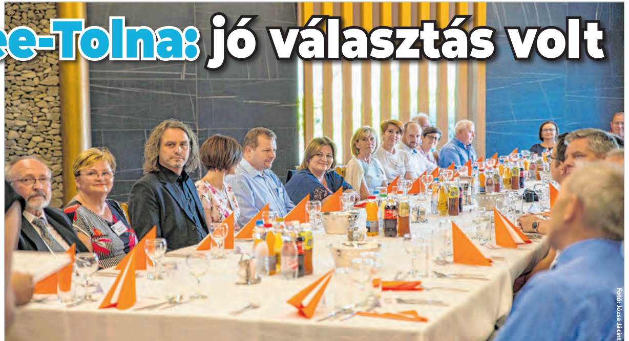
Az ünnepi testületi ülés néhány tolnai és stutensee-i résztvevője az eseményen

A bő három évtizedes partnerséget szombaton kora este ünnepi tes-