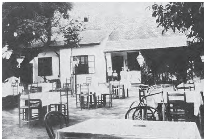
A Fehér Ló szálloda kerthelyisége 1908-ban