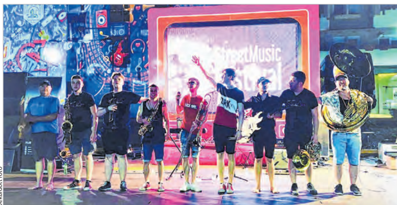
A HuMen a szatmárnémeti utcazenei fesztiválon

A mi zenénk inkább utcazene, szabadtéri koncerteket adunk, főleg nyáron, Magyarországon nagyon sokfelé hívnak minket. Év közben a zenéket írjuk, készülünk a következő szezorra. Idén már sok fellépésünk volt, annak ellenére, hogy ötven most érettségiztünk. A szekszárdi KSC hazai pályás meccsein is végig mi játszottunk. Már jelen vagyunk a különböző platformokon, Youtube-on, Spotify-on. Az a célunk, hogy az általunk játszott zenéket stúdió minőségben feltöltsük, hogy a koncertszervezők megtaláljanak minket és a közönségünk is hallgathassa a koncertanyagokat – magyarázza a tolnai gitáros.