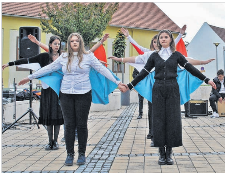
A gimnázium diák színjátszói adtak műsort a Hősök terén