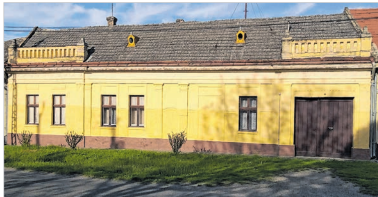
A Müller ház ma. Egykor középen volt a kocsmajátó