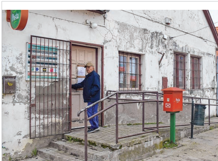
A mözsi posta november 11-ig tartott nyitva