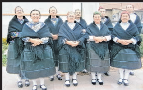
A möksi kórus a városládai rendezvényen

A fesztiválon a résztvevő Magyarországi Kormány és a Bethlen Gábor Alapkezelő Zrt. támogatta. A pályázati azonosító szám: NCIV-KP-1-2022/1-000160.