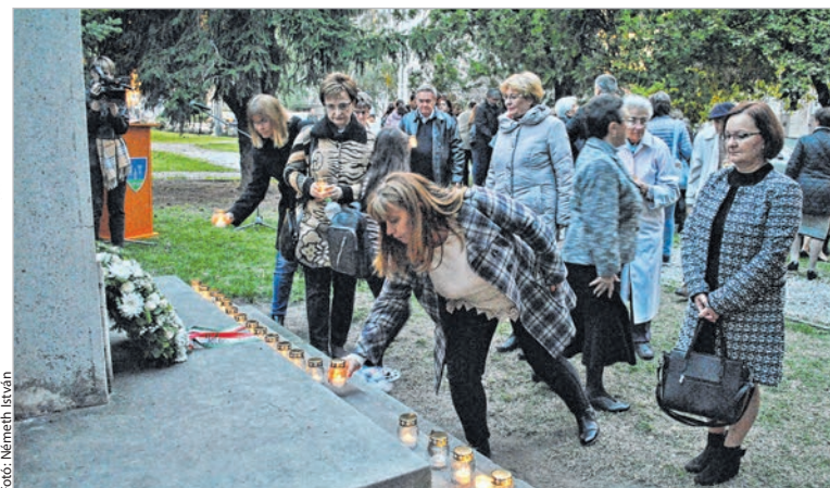
A megemlékezés végén valamennyi résztvevő mécses gyújtott