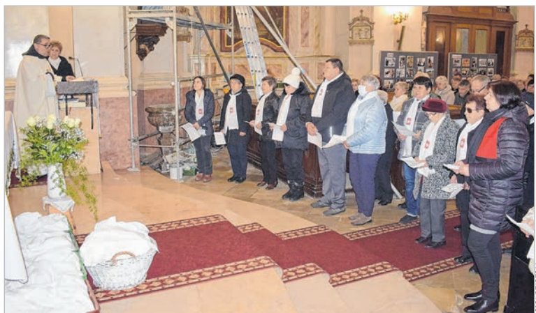
Megújították fogadalmukat a karitászosok

A mözsi kórus jótékonysági koncertet adott a mise keretein belül. A befolyt pénzből a karitászcsoport a város szegény sorsú lakóit támogatja majd. (További pénzadományokat a templomban található perselyükbe várnak.)