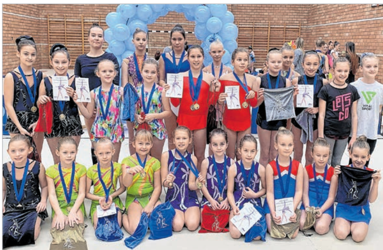
A Vítal sportolói a Barátság RG fesztiválon

Az RG szakosztály következő időszakára a jövő év megalapozásáról, új koreográfiák készítéséről szól. Remélik, hogy az edzéslehetőségek is adottak lesznek, hogy eredményesen tudjanak készülni a 2023-as évre.