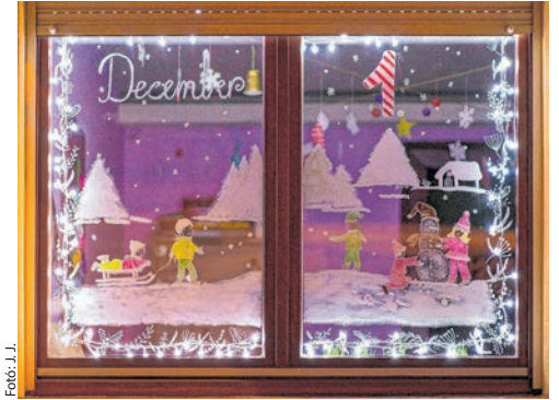
Egy tavalyi ablakdísz, december elsejéről

zés lehetőségét, amelyre 35 háztartás jelentkezett. Bernadett szerint az akció népszerűségének egyik titka, hogy a díszítők között egy kis egészséges versengés is folyik, a közönség számára pedig jó alkalmat kínál a helyszínek felkeresése egy téli sétára vagy közös barangolásra a városban. Az aktuális szá-