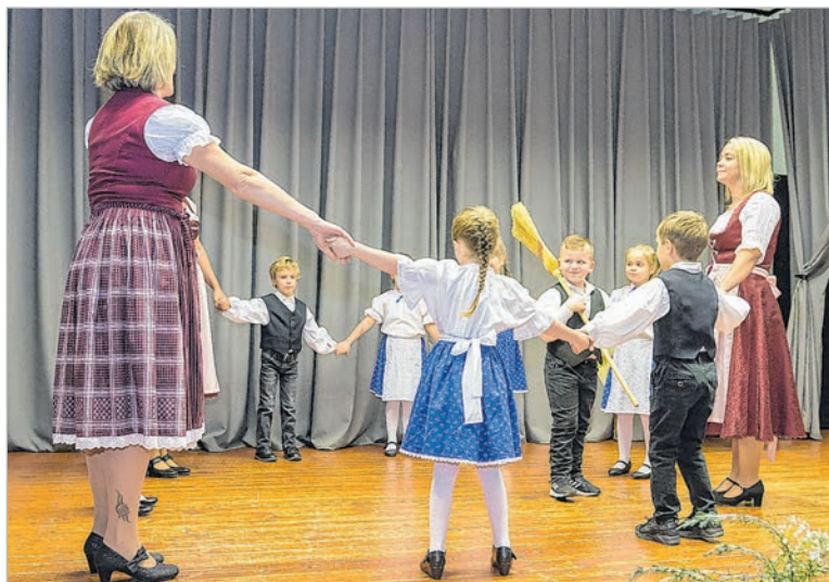
A mözsi óvodások is szívet melengető műsort adtak

Mözsön rendezték az idei nemzetiségi napot