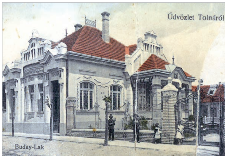
A Buday-villa egy korabeli képeslapon