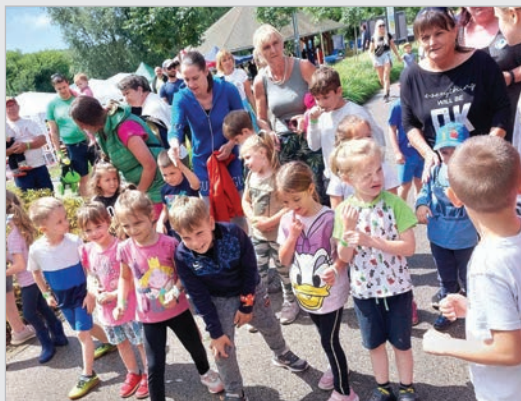
Sokféle vidám program várt a résztvevőkre