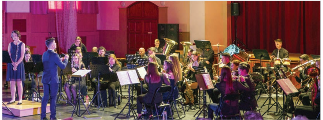
Komoly zenei tudást igénylő darabok hangzottak el