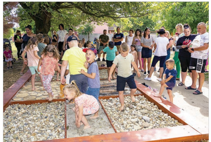
Örömmel próbálták ki a gyerekek a taposóösvényt

rűen gyermekük talpnyomával díszített gipszlenyomatot adtak át. Az avatáson elhangzott, hogy hasonló taposóösvényeket a város többi óvodáiban is érdemes lenne kialakítani.