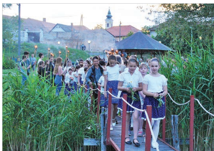
A bárkáról eresztették a vízbe a megszentelt virágokat, koszorúkat

A szentmise végén a plébános úr megáldotta az intézmények,