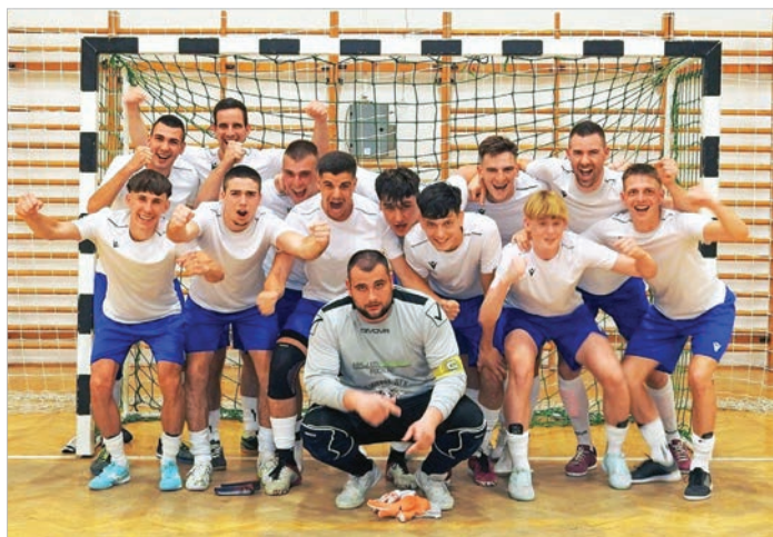
Ősztől egy osztállyal feljebb rúgják a bőrt (Beküldött fotó)

FÉRFI FUTSAL, OSZTÁLYOZÓ Az NB III-as férfi futsal bajnokság délnyugati csoportját veretlenül megnyerő Tolna-Mözsi Futsal SE az osztályozó akadályait is sikeresen vette, így ősztől már az NB II-ben játszhat a csapat.