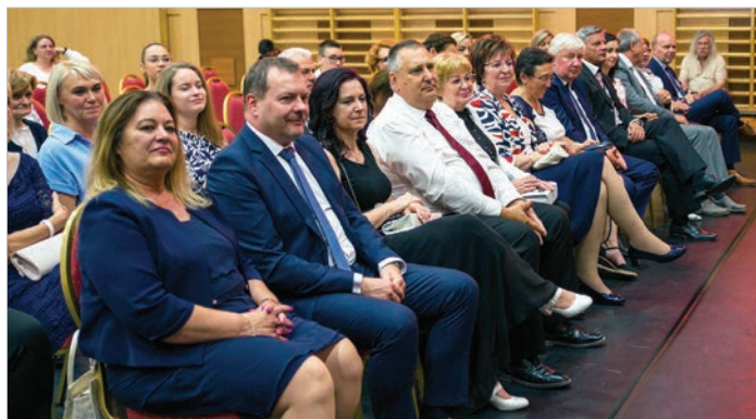
A város vezetői és vendégek az ünnepi testületi ülésen

A városvezető az idei kitüntetések átadása előtt mondott beszédében megemlékezett az elmúlt évek néhány fontos beruházásáról, megjegyezve, hogy a település polgárai büszkéek lehet-