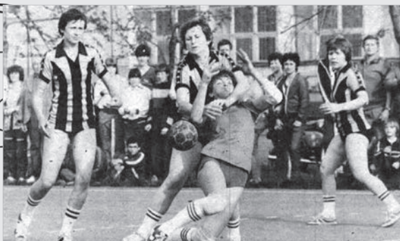
Népújságos fotó egy női NB II-es meccsről, 1983-ból