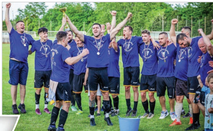
Két év után újra bajnoki címet ünnepelte a VFC