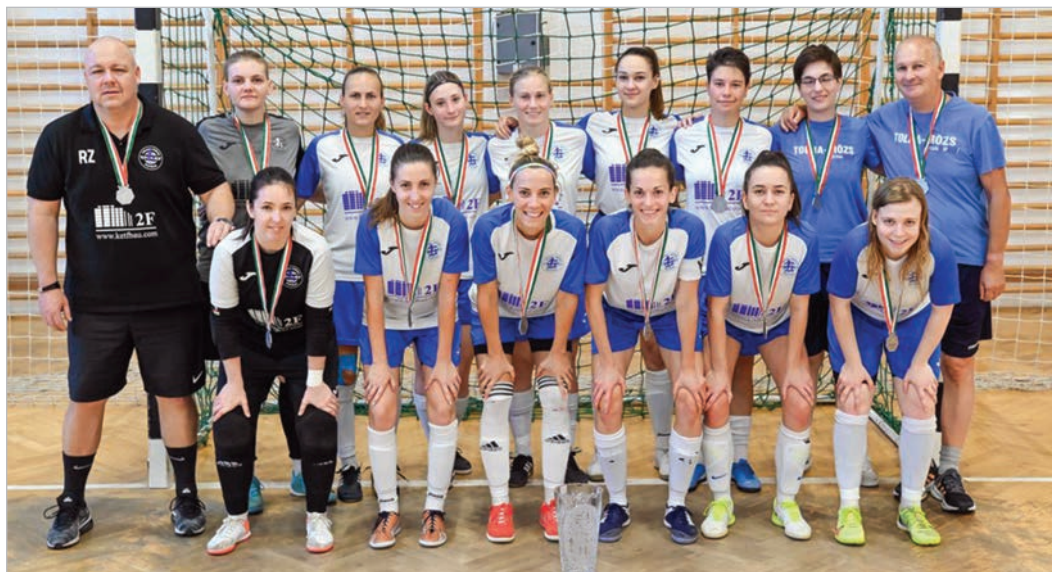
A bajnoki ezüstnek is méltán örülhetett a csapat