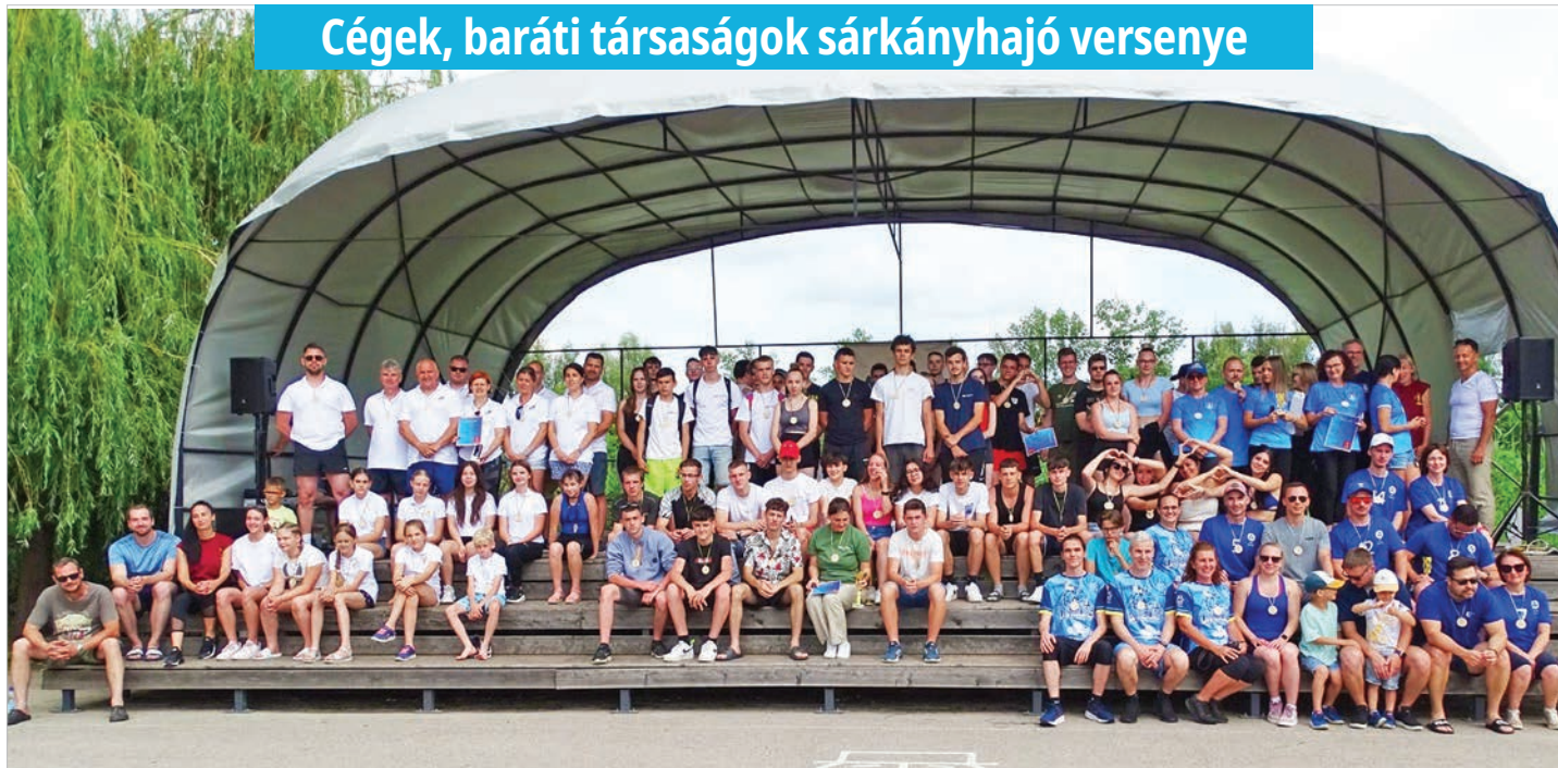
A LapáTolna Nap résztvevői a tolnai Duna-parton, a vízisínpadnál (Beküldött fotó)

Cégek, baráti társaságok sárkányhajó versenye