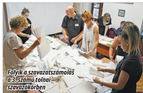
Folyik a szavazatszámolás a 3. számú tolnai szavazókörben

Lenge Petra (TVE) 46,37% Guld Csaba (FIDESZ) 46,22% Virányi Mihály (Mi Hazánk) 7,4%