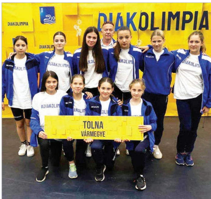
A Wosinsky iskola országos 3. helyezett labdarúgó csapata