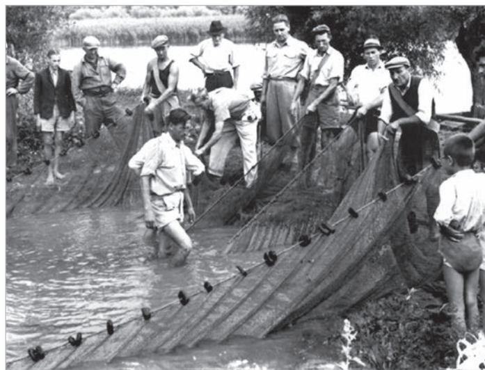
Ivadék-lehalászás az egykori Halbiológia egyik tavn

Tudtad, hogy a vizen élők védőszentjének, vagyis a hajósok, révészek, hajóácsok, vízimolnárok patrónusának, Nepomuki Szent Jánosnak feltehetőleg sehol nincs annyi közterületen álló szobra, mint Tolnán? Vagyis összesen hét. Ebből egy áll a polgármesteri hivatal sarkán, a piac bejáratánál;