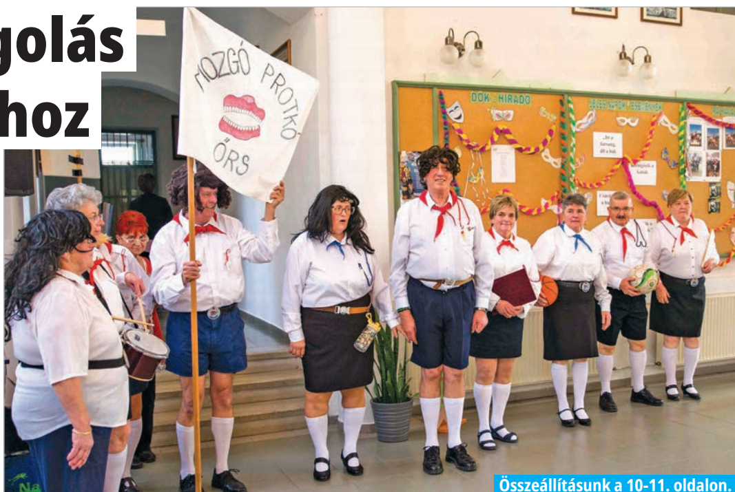
Összeállításunk a 10-11. oldalon.

Feszültségekkel, szorongásokkal teli világunkban különösen meg kell becsülni az önfeléd, vidám perceket, órákat. Szerencsére ez utóbbiakból nem volt hiány az idei farsangon a városban sem. Több multság is zajlott, amelyen idősek és fiatalok egyaránt jól érezték magukat, bizonyítván, hogy a farsangolás sincs korhoz kötve.