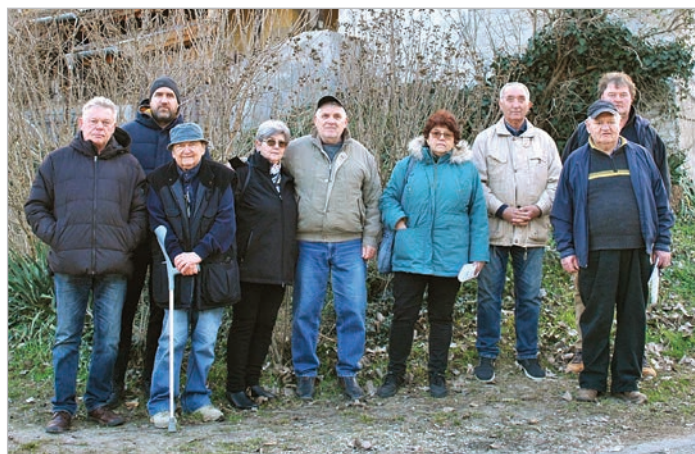
Lelkes tolnaiak, akik a hajós emlékmű ügyében találkoztak a Stern-telepen (Fotó: Németh István)

a Domboriba vivő kerékpárút legelejeére helyezi. Ekkor még egy kőből rakott falban gondolkodott, lehetőleg terméskőből, a telekhatárhoz igazítva. Ez hordozta volna a horgonyt.