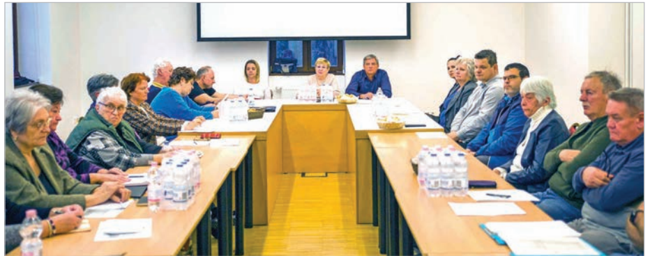
A találkozón húsz társadalmi szervezet képviseltette magát

Civil majális és elszármazottak találkozója lesz májusban