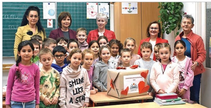
A könyvcsomag átadása az első osztályban

örömmel forgatják az új köteteket. (Új alatt használt, de jó állapotú könyvek értendők, olyanok, amelyek pl. hagyatékából