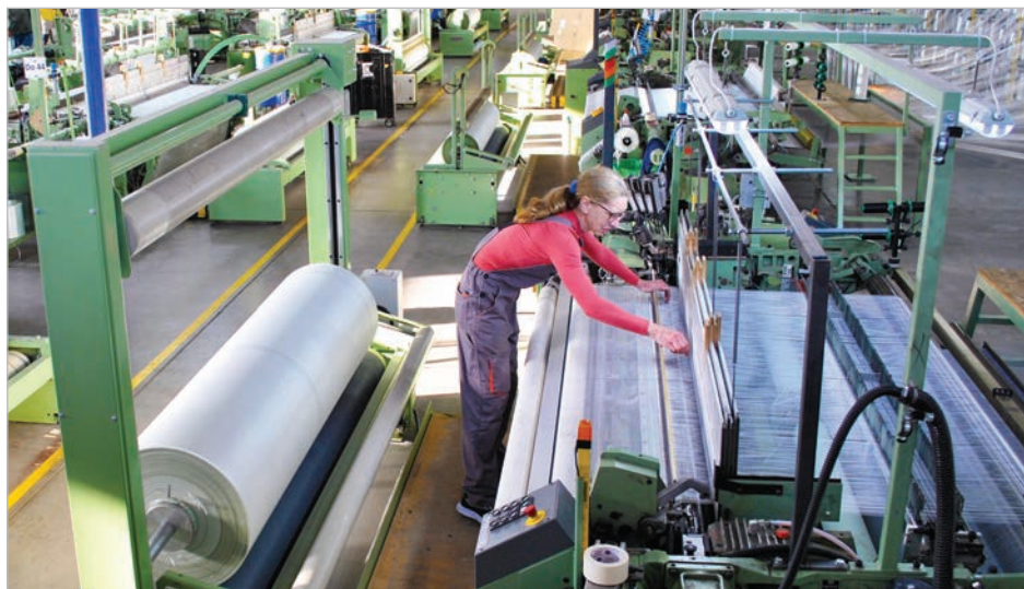
A Tolnatext Bt. árbevétele tavaly némileg csökkent, de a dolgozói létszám nem változott

A lemezmezmunkálással foglalkozó üzemrészben azonban folyamatos a létszámfelvétel. Kézenfekvő lenne, ha az egyik