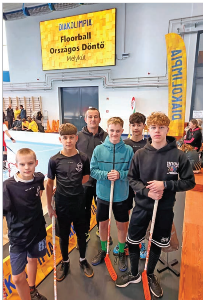
Az ország legjobb nyolc iskolai csapata között a wosinskys fiúk

Az országos fináléban aztán egy győzelmet szintén aratott a még kevés rutinnal rendelkező, betegség, illetve sérülés miatt megfogyatkozott tolnai gárda, és a vesztes meccsek is csak az utolsó pillanatokban dőltek el az ellenfél javára. Így a Wosinsky gárdája az országos 8. helyet sze-