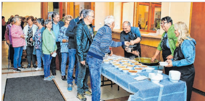
A sárkányhajósok az egész társaságnak főztek

Eredetileg a tolnai Duna partjára tervezték az eseményt, de az égiek közbeszóltak, egész napos kiadós eső áztatta a tolnai földet, a gazdálkodók nagy boldogságára. Ezért valójában senki sem mérgeződött az időjárás miatt, a civil majális a Lovardában bonyolították le. Egy kis átszervezésre azért szükség volt, a krumplinokli főző verseny elmaradt, de nem maradtak „krumbi-erenokli” nélkül a lelkes tolnai