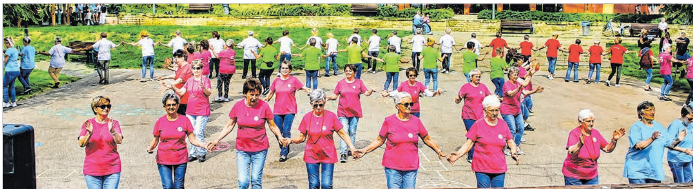
Nyolc településről érkeztek örömtáncosok a tolnaiak által rendezett találkozóra