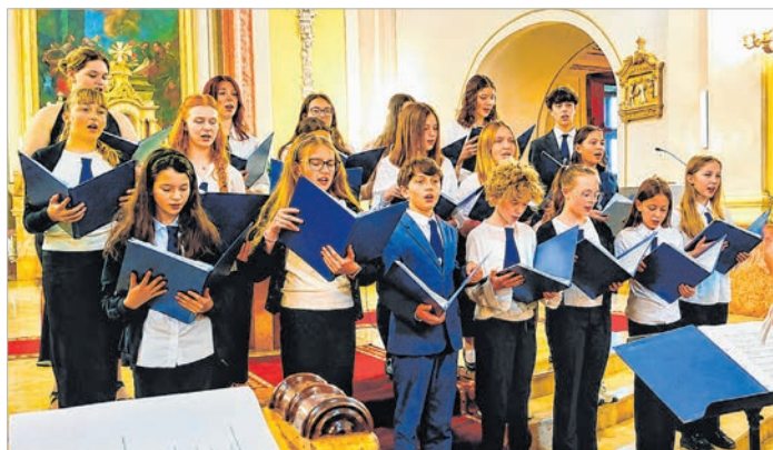
A Fusz János Zeneiskola kórusa énekel elsőként