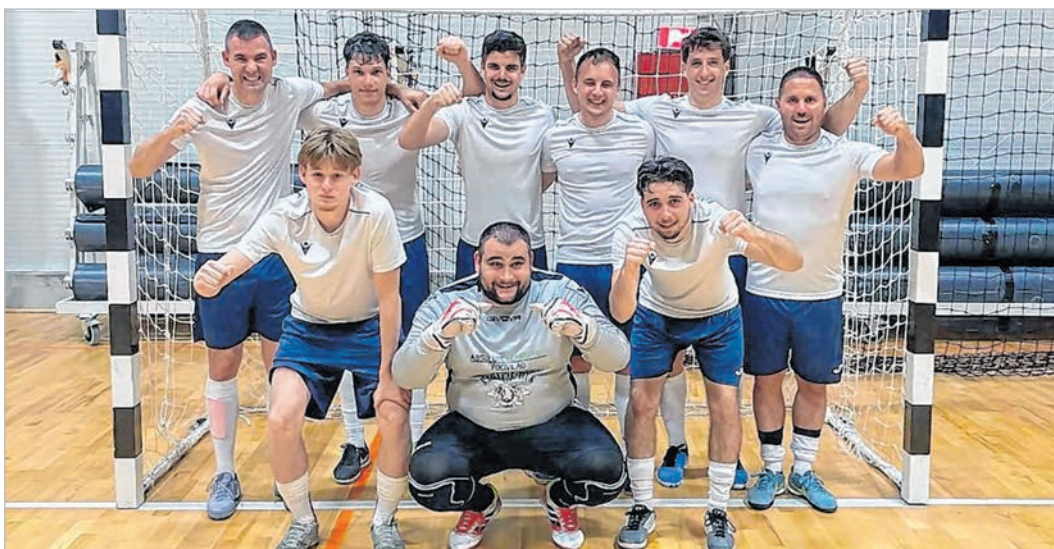
Meleg volt a helyzet, de kivívták a jogot az NB II-es indulásra