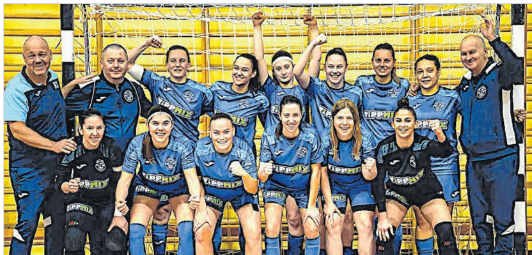
Ez a fotó a Magyar Kupa négyes döntőjébe jutás után készült a csapatról