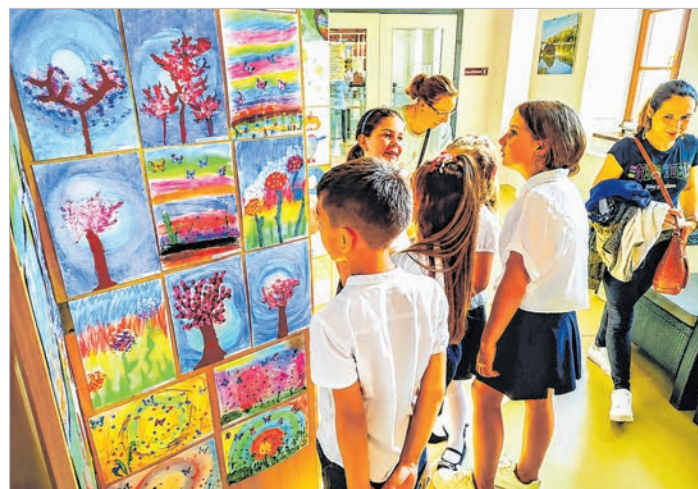
Rajzórakon, rajzsakkörön készültek a kiállított alkotások