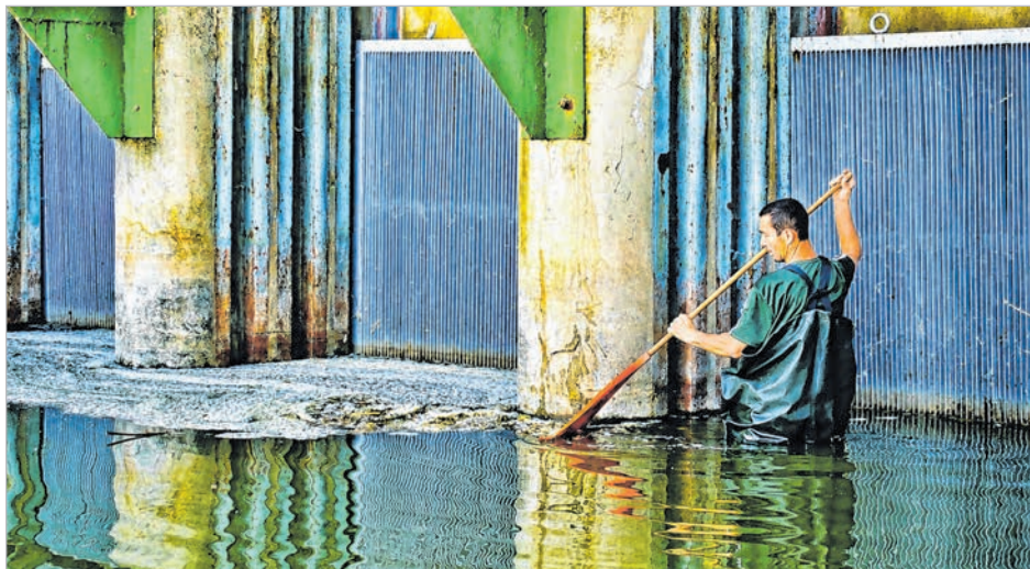
A Thelena Kft. munkatársai végzik a Mádi-Kovács-zsilip halrácsainak takarítását

A vízpótlás kezdetén a tolnai holtág vízszintje 440 centiméter volt, a vízpótlást – ami lapzártakor még tartott – 470 centiméter körüli szintig tervezte a vízügy.