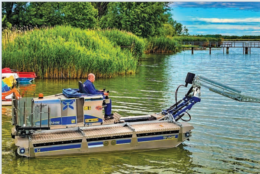
A nádvágógép próbaüzeme a dombori holtágon

Megállapodást köt a Versenyképes Járások Program keretében beszerzett nádvágógép használatáról a három tulajdonos önkormányzat, Tolna, Fadd és Bogyszló. A tolnai részről május 28-án elfogadott megállapodás alapján a közvetlen üzemeltetési költségeket (üzemanyag, kenőanyag stb.) az az önkormányzat viseli, amelyik éppen használta a gépet, míg a fenntartási költségeket (biztosítás, amortizációs javítások stb.) egyenlő arányban biztosítják a felek. A több mint százmillió forintért megvásárolt, hínárvágásra is alkalmas berendezést Tolnán, a Thelena Kft. telephelyén tárolják.