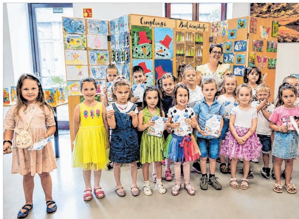
A Csingiling barkácsolóműhely legjobban sikerült darabjait állították ki