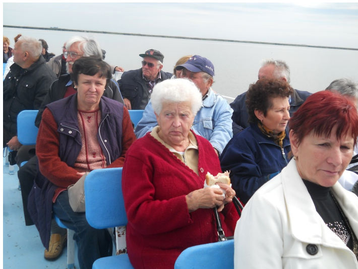
Sétahajókázás a Fertő-tón

Szeptember 20-án kirándulni voltunk Sopronban. Az időjárás erre a napra már kissé jobbra fordult, de melegünk nem volt.