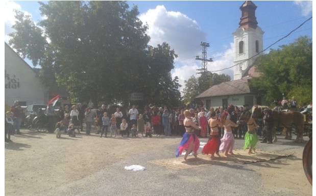
Samyra Hastánccsoport fellépése Márkón

2013. szeptember 21-én szombat délután ismét megtelt étellel a Márkói Csárda előtti murvás parkoló. Sorra érkeztek a lovasok, lovaskocsik és traktorok Bándról. A szüreti felvonulás első állomáshelyén forró hangulat és sok érdeklődő várta a menet résztvevőit.