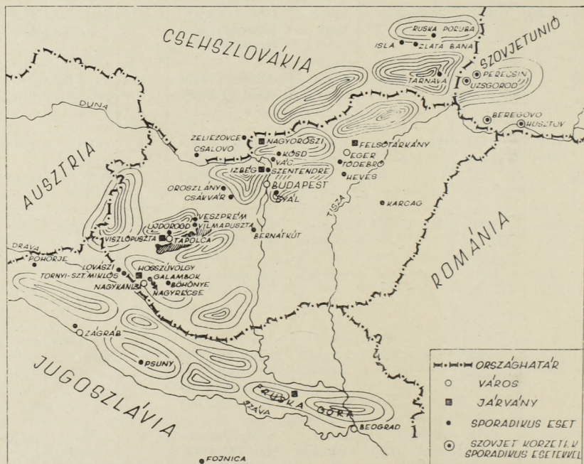
1. Magyarország és a szomszédos államok endémiás területei.

Eseteinkkel együtt Magyarországon a felismert esetek száma 123, ezek egytöbbsége sporadikus volt. A jelenleg felismert 8 és a régi 15 góccal együtt összesen 23 gócról tudunk. Mindezek alapján a vhl hazai endémiás területét ma már jobban ismerjük, mint 1959-ben (51) (lásd a térképet).