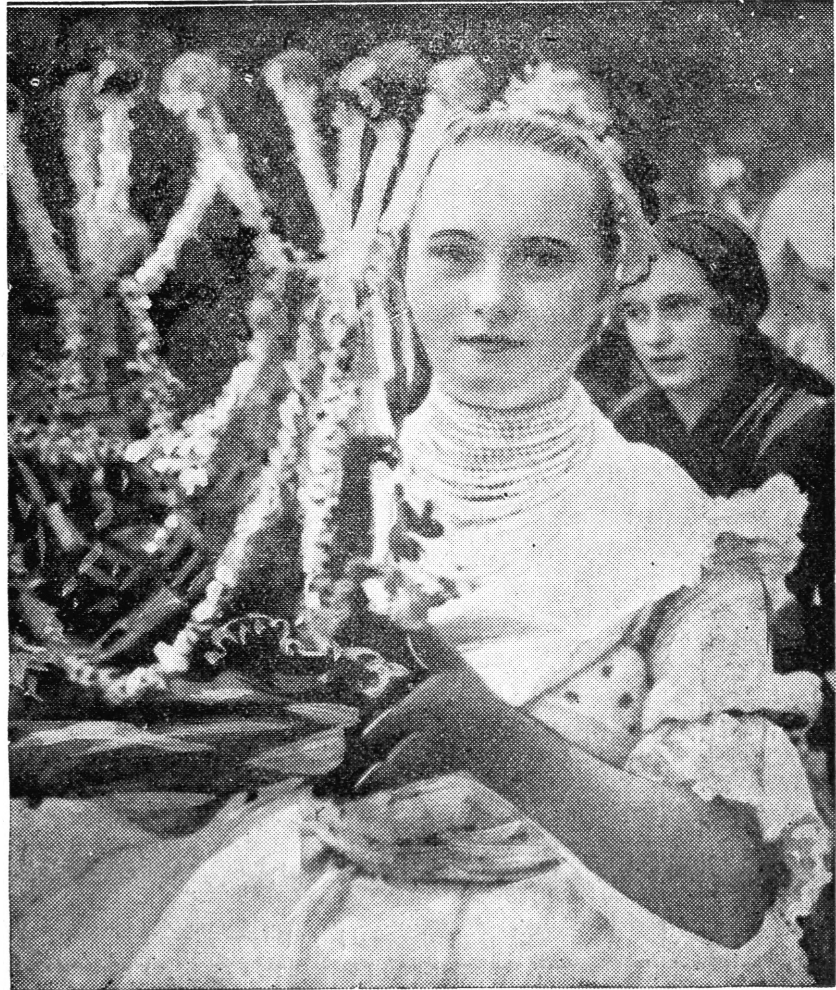
BUJÁKI LAKODALMIKALÁCS: „ÖRÖMKALÁCS”.

A község a Galga alsó völgyében, dombos, részben erdős területen fekszik. Csinos, rendezett, tiszta fau és már a tatárjárás idején volt. Mint külön érdekességet kell megemlíteni, hogy bár a község Budapesttől mindössze 60 kilométerre fekszik és lakóinak egyrésze a fővárosban keres foglalkozást, vagy pedig terményét a budapesti piacon árúsítja, a község ezek ellenére is népies viseletét, szokásait megtartotta és féltékenyen őrzi. A nők ünnepi posztószoknyája apró ráncba szedett, rövid, de a térdet takarja. A posztó színe piros, meggyzsin, sötétlila, zöld, csikkal nagy kockával mintázva, de sokan a sima szövetet kézzel hímezett virágokkal díszítik. A felsőszoknya alá 5—6 fehér, gyengén keményített szoknyát vesznek. A szoknyát kiegészíti az úgynevezett „nyúló”, amely mintázott bársonyból, vagy fehér selyemből készül. Nyáron félinget hordanak, keményített csipkés, rövid ujjakkal, szaggal átkötve és hozzá díszes pruszlikot. A rojtos selyemkendő helyett „jeles” ünnepeken magukkészítette fehérhímzett kendőt viselnek. A lányok hajukat a fejtetőn választva, többszínű „hajfonóba” fonják és a választék összevonásánál széles, hímzett szalagból készült és félhátig leérő csokorral díszítik. A fiatal menyecskék ezenkívül nyakbakötőt és a hátukon elomló és szoknya aljáig érő hímzett szalagokból készült csokrot viselnek. Templomba csak bekötött fővel, — selyem, vagy hímzett fehér kendő —