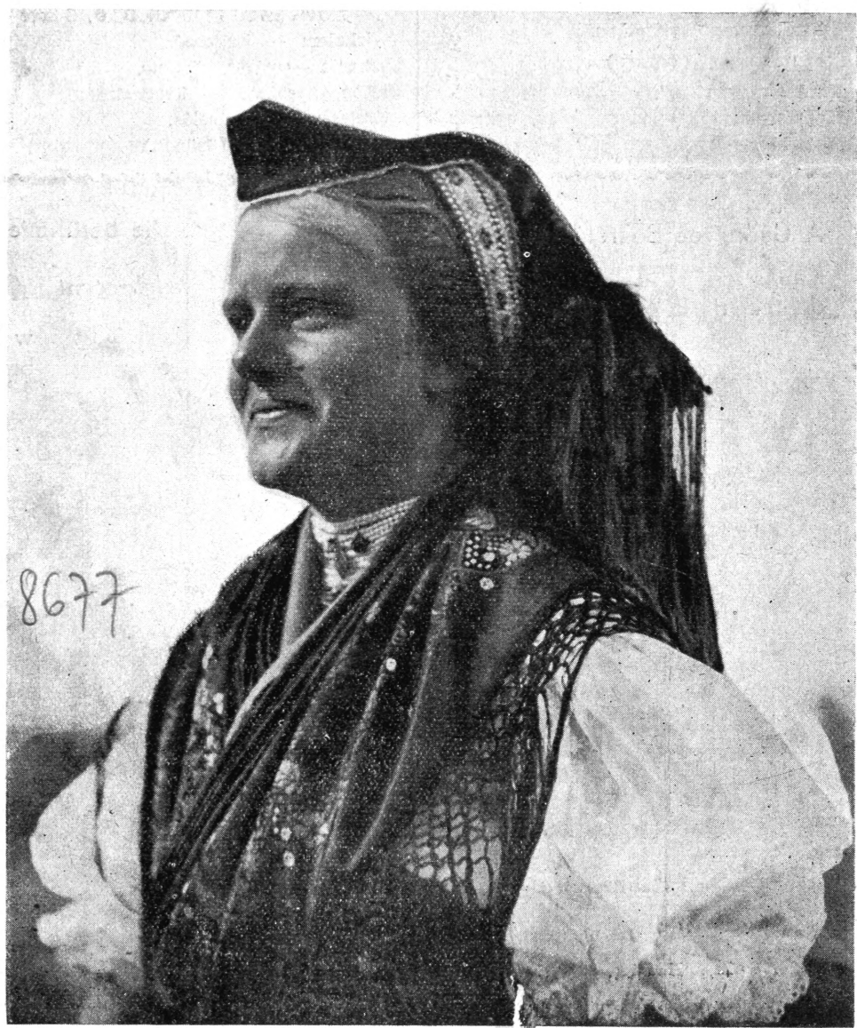
A RIMÓCIAK (NÓGRAD MEGYE) MOST SZERELNEK ELŐSZÖR A GYÖNGYÖS BOKRÉTÁBAN.