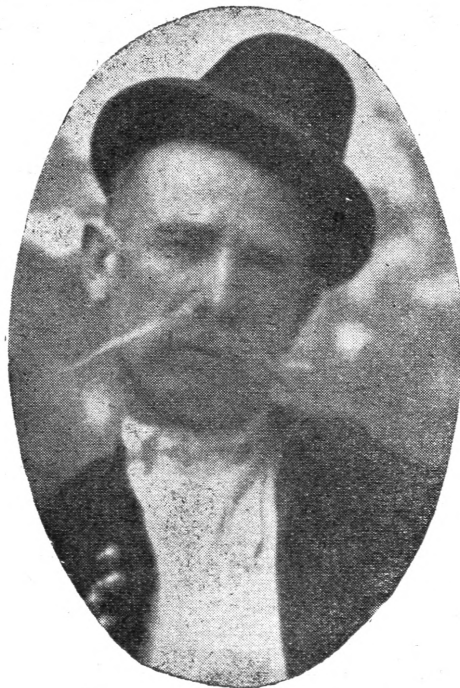
Baranya bácsi . . .

vaesorán nagyon gyanus volt a pörkölt íze, de azért csak legyűrték a paprikást. A tur-