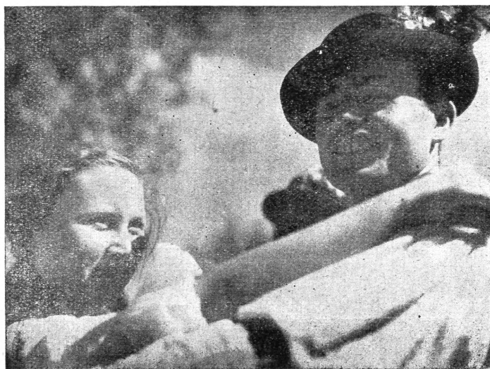
JANCSI . . .

Azok, akik a magyar népművészeti „divatot“ igazában megérintették, minden esetre leszögezzük álláspontjukat. Lehet, hogy ennek ellenére — lesz lazaronizmus stb., főként a bokrétákon kívül, de ezért nem lesznek okolhatóak az eleget harcoló építkezők.